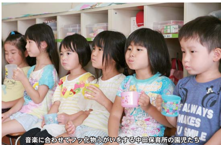
音楽に合わせてフッ化物うがいをする中田保育所の園児たち