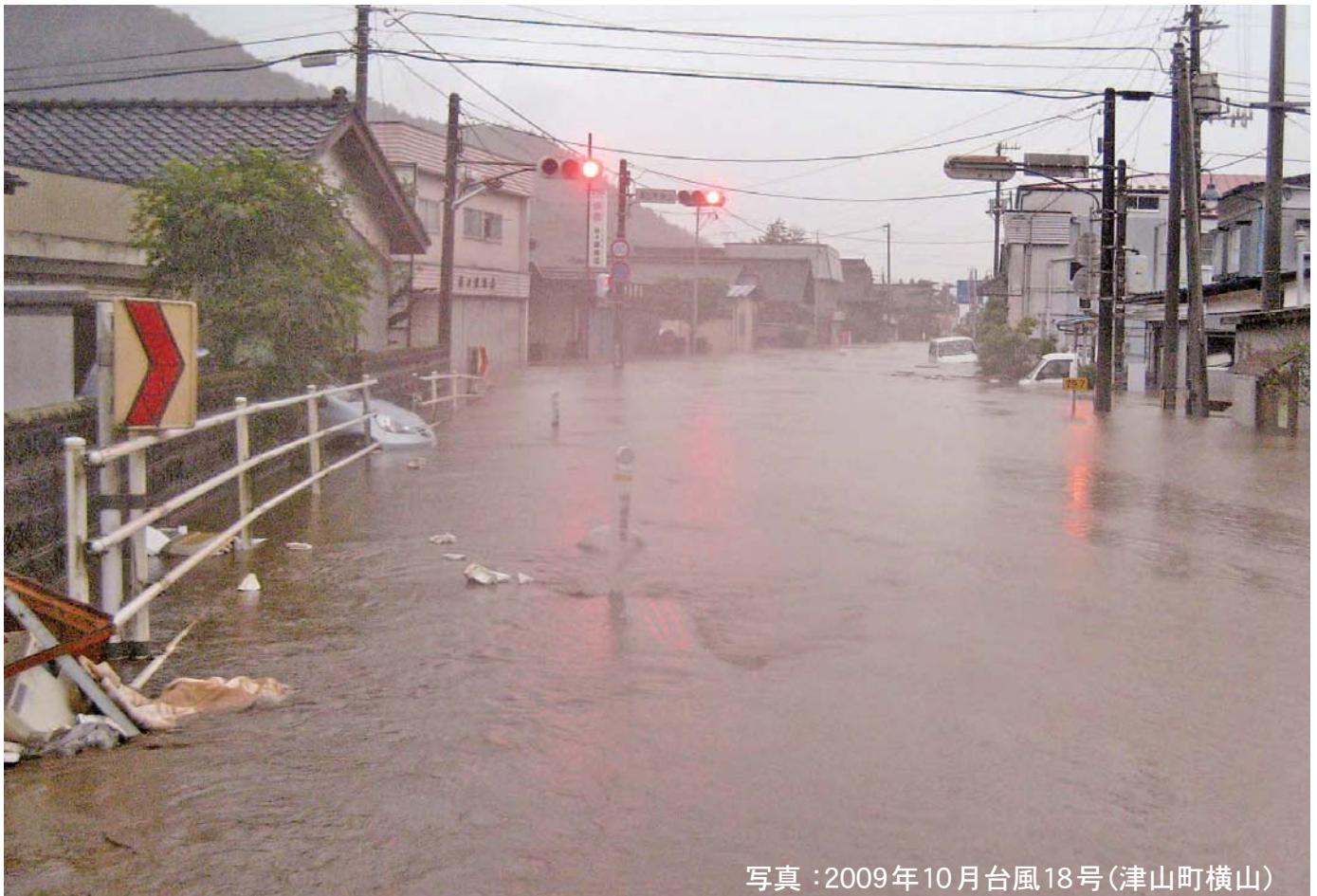
写真：2009年10月台風18号(津山町横山)