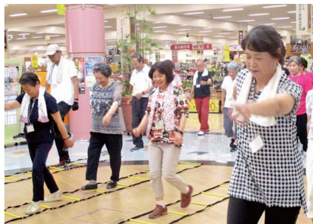
イオンタウン佐沼で定期的に行われている「タウンウォーキング」。