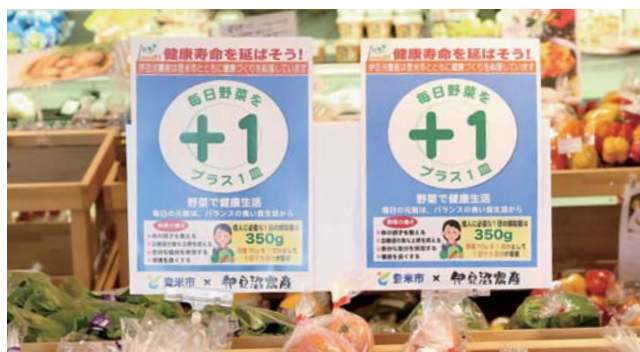
市内道の駅、物産店やスーパーなどにポスターを掲載しています。