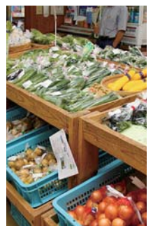
旬の野菜が並びます

で、11月まで取り扱っています。これから秋に向けて、ナガイモ、ゴボウ、ニンジン、ニンクなどの「根っこ物」も出てきます。ナガイモは一般的なもののより粘りが強く、味が濃厚ですので、ぜひご賞味ください。