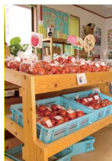
トマトが一番のお勧め