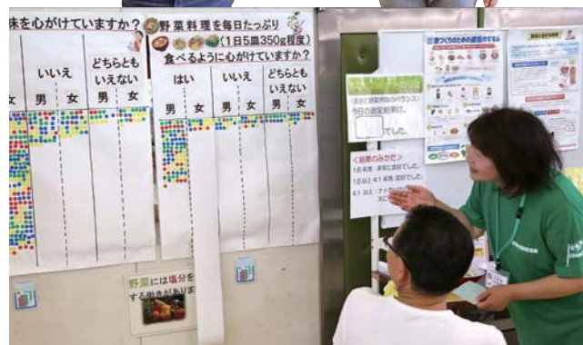
特定健診会場では、保健活動推進員が普段の食生活を聞き、見直すきっかけにつなげています。