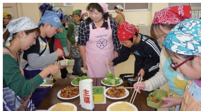
「すこやかキッズ教室」で3・1・2弁当箱法に取り組む児童と保護者ら。