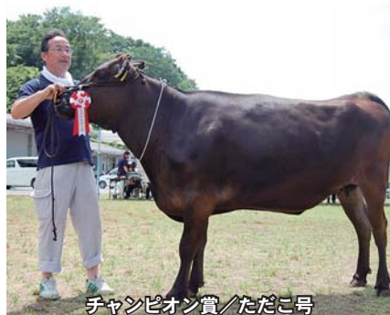
チャンピオン賞/ただこ号