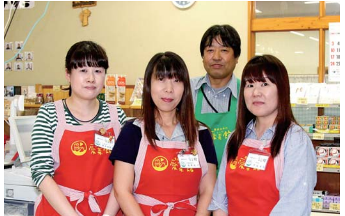
「新鮮な切り花や野菜はもちろん、隣接している加工場で作られるお餅、お弁当やパンなども、できたてがお店に並びます」と話すスタッフの皆さん