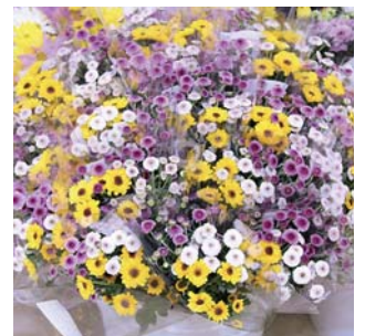
切り花は、「お盆市」で行列ができるほどの人気商品