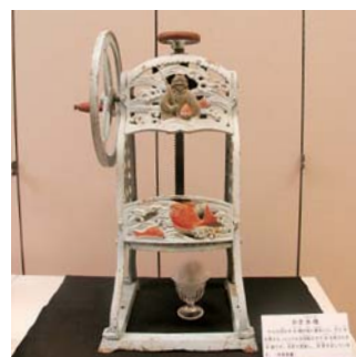
昔の手回しかき水機