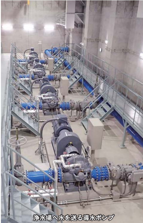
浄水場へ水を送る導水ポンプ