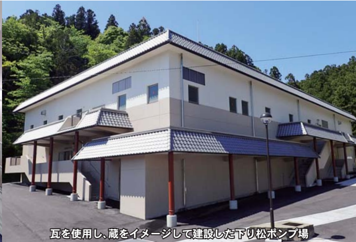
瓦を使用し、蔵をイメージして建設した下り松ポンプ場