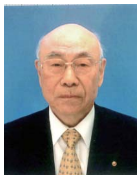
東京中田会幹事 中田町(大泉)出身