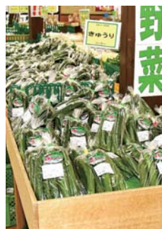
新鮮なキュウリがお出迎え

8月11～16日に「お盆市」を開催する予定です。期間中、13日は朝6時から開店します。