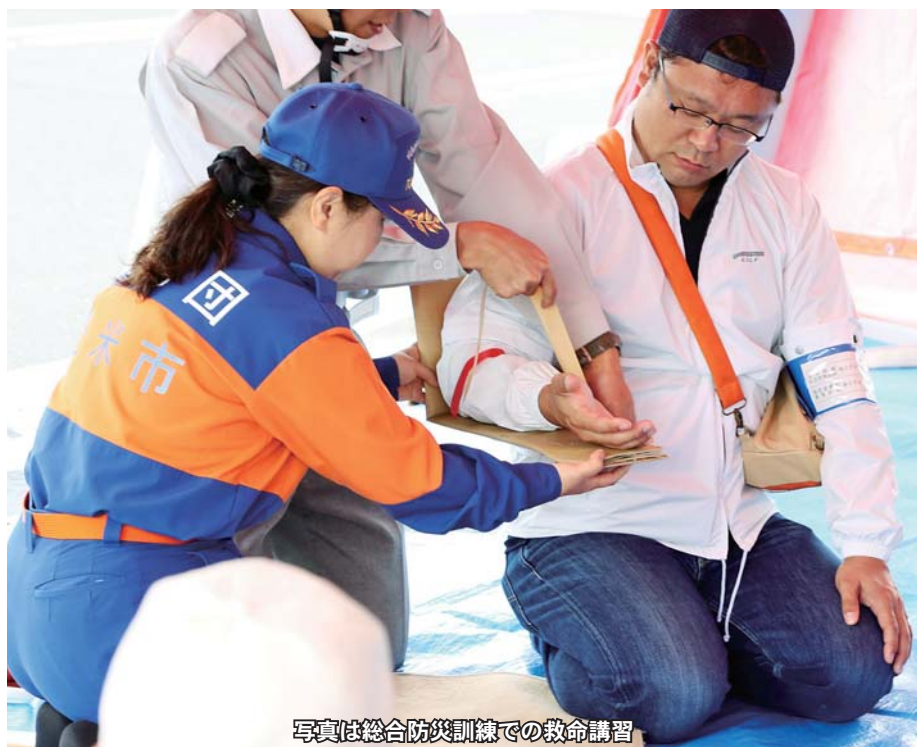
写真は総合防災訓練での救命講習