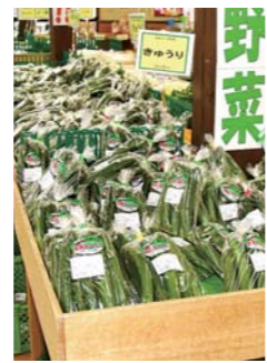
新鮮なキュウリがお出迎え

た中田産の米を取り扱っています。味もおいしいですよ。 Q これから開催されるイベントなどを教えてください 8月11〜16日に「お盆市」を開催する予定です。期間中、13日は朝6時から開店します。