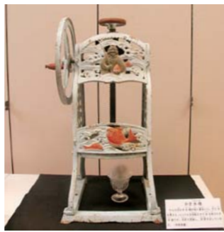
昔の手回しかき氷機

【日時】8月14日(火)午後6時～7時30分 【場所】市歴史博物館 【参加費】1人100円 【定員】30人(先着順) 【参加条件】①家族(必ず成年保護者同伴)で参加ください ②LED懐中電灯を持参ください 【申し込み・問い合わせ】市歴史博物館 ☎0220(21)5411