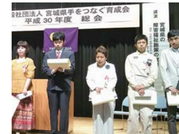
表彰式の様子。緊張した面持ちで参加する受賞者の皆さん。

平成30年度優良勤労知的障害者表彰式(宮城県手をつなぐ育成会主催)は5月29日、仙台市福祉プラザで知的障害者の自立と社会参加の促進を目的に行われ、本市からは前年の4人に続き、過去最多の5人が表彰された。 今号は、受賞した5人のこれまでの軌道を追う。