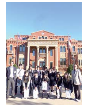
※学校、学年は参加当時のものです ※感想は研修報告から抜粋したものです

ホストファミリーはとても良い家族で、ホームステイができて良かったと心の底から思いました。ホームステイ期間中に迎えた私の誕生日も盛大に祝ってもらい、最高の思い出になりました。 中学校で習った基本的な英語が活躍し、もつと多くのフレーズを覚えておくべきだった。