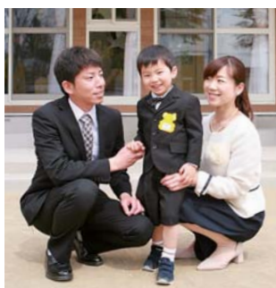
佐沼明星こども園

市内の認定こども園は、新たに4園が開園し合計で5園になりました。親が一番に願うのは、子どもが元気で健やかに成長すること。市では、官民一体となって、子育て環境の充実を目指します。