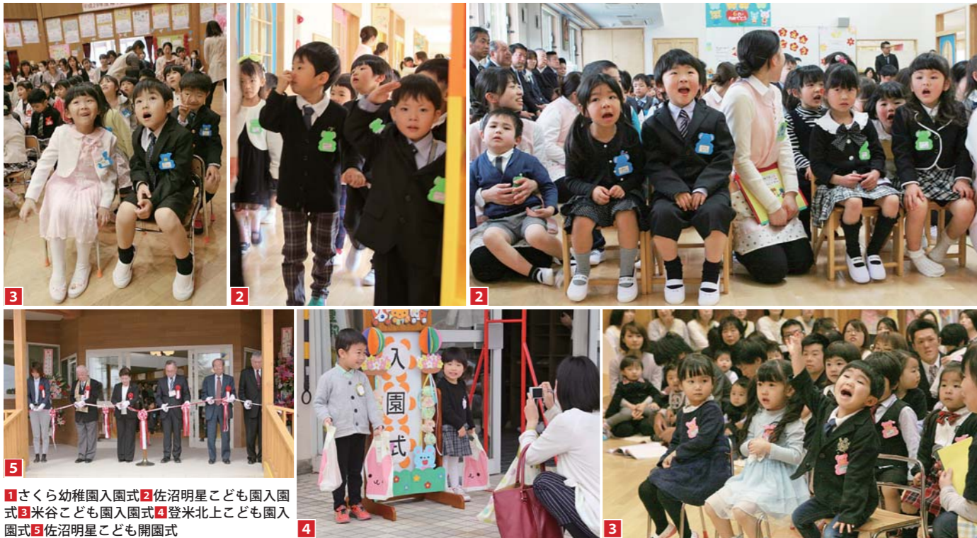
1 さくら幼稚園入園式 2 佐沼明星こども園入園式 3 米谷こども園入園式 4 登米北上こども園入園式 5 佐沼明星こども園開園式

私たちの方針は、子ども一人一人を大切に、生き生きとした明るい子どもに育てること。子どもと地域のつながりも大切にしたいので、今年から地域の運動会に参加する予定です。よく遊び、よく考えて行動できる元気な子どもに育てていきたいと考えています。