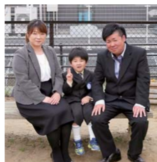
登米北上こども園

慣れ親しんだ北上保育園が閉園して、名残惜しさもあります。新しい場所で不安もありますが、先生に頼るところが大きいです。子どもには、病気やけがなく元気に通園してほしいと思います。