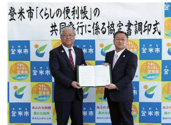
協定書に調印した熊谷市長(左)と浅田常務。印刷から発行、配布に必要な経費は、広告料でまかなわれます。

暮らしの便利帳は、昨年までNTTタウンページに特集企画として掲載してきましたが、形態を一新。A4判フルカラーで、行政情報のほか登米市の自然や文化、祭り、特産品などの地域情報、事業者広告を掲載します。発行部数は3万3千部、暮らしに役立つ情報が豊富で、使い勝手が良く実用性の高い便利帳を制作し、平成30年10月頃に各家庭へ配布する予定です。