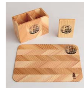
※写真は記念品イメージです。