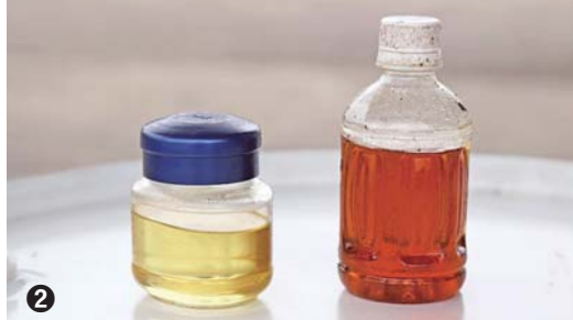
①廃食油が入っていたタンクを洗う施設利用者の皆さん。一人一人が回収から精製まで一連の作業を行います②精製したBDF(左)と廃食油