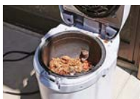
機械で処理された生ごみ。量が減り、捨てやすくなりました

これまで生ごみは、可燃ごみに出していました。生ごみは、臭いがするし、水を切っても汁が残るので、集積所に運ぶのが大変でした。夏場は特に腐敗が早いですからね。衛生上よくないなと思っていました。