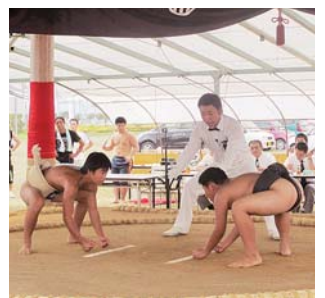
小学生たちが熱戦を繰り広げる「丸山杯少年相撲大会」

8月28日(日)に「道の駅米山花火まつり(仮称)」を開催します(雨天時は、花火だけ29日(月)に順延)。合併前まで米山の夏の風物詩だった花火