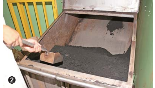
①肥料にできないごみを分別して、機械で細かく 刻む。刻んだ後は、装置に投入②完成する肥料の 量は、投入した廃棄物の10分の1