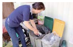
普段から分ければ、リサイクルに出すときの手間が省けます

ごみは分別して処理します。びん、缶はもろろんのこ、プラスチック製のボトル容器やキャップなどは、資源ごみとして集積所に。市で回収してない白色トレイは、洗ってからスーパールの回収ボックスに出しています。分別に手間はかかりますが、大切な資源をごみとして処分するのは、もったいないと思います。