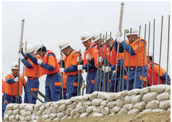
北上川や迫川、伊豆沼など、水資源が豊かな分、水害発生の危険性も高い本市。日頃からの備えが重要になってきます。

演習は、大型台風の局地的な大雨で迫川が増水し、堤防が越水、漏水が発生した想定で実施されました。土のうを作る「準備工法」、堤防の越水を防ぐ「積み土のう工法」、堤防の漏水を防ぐ「月の輪工法」などを実施。団員たちは、真剣な表情で訓練に取り組んでいました。