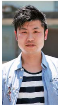
横山地区水害体験者に聴く

私は自営業で、台風18号の水害の時は、家で昼休みの時間帯でした。決壊して20分ほどで、床上に浸水。本当に一瞬でした。自宅から避難所の横山小学校に行く経路は、国道45号線しかありません。水害後、横山地区で「人名財産を守る会」を発足し、横の連携を強化しました。今後も、守る会で避難ルートなどを検討していきたいです。