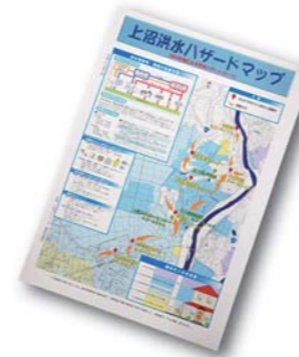
ハザードマップには、情報入手先や浸水状況の目安などが、詳細に書き込まれている

上沼地区は、北上川沿いに位置しています。幼少の頃、カスリン台風で大泉堤防が決壊。被害はほぼ中田町全域に及び、多くの犠牲者が出ました。このことから、一昨年末に市の協力を得て地区全体のハザードマップを作成。避難所や避難経路は、各行政区の役員と現地を確