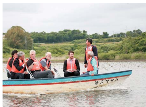
ボートランドは、常設で2000mのコースが8レーンあり、国際大会を開催できる国内屈指の環境を誇ります。

視察に訪れたのは、オリンピック委員会チームサービス部門ディレクターのデレック・コヴィングトン氏と、カナダボート協会ハイパフォーマンスディレクターのピーター・クックソン氏。2人は、艇庫やトレーニング施設、船に乗ってコースを回り、ブイの間隔や水深なども確認しました。クックソン氏は「練習に適した素晴らしい施設。なるべく早いうちに選定結果を報告します」と話しました。