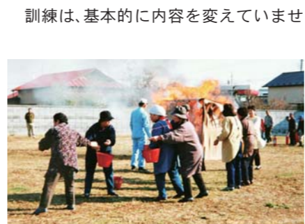
燃える小屋をバケツリレーで消火。訓練は全て手作り、小屋も自分たちで製作したものだ。

鉄砲丁区は住宅が密集しています。火事が起きたら、地域全体が焼失する恐れがあります。このことから、昔から防火意識が高く、訓練を実施してきました。50年ほど前に防火訓練が始まり、現在は防災に重きを置いて訓練をしています。