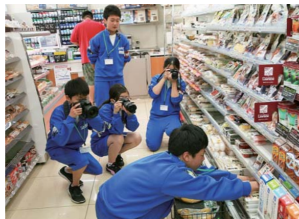
同じく、職業体験中の同級生に取材をする4人。店主への取材交渉から編集まで、慣れない仕事に四苦八苦しました。

4人は、職員から仕事内容やカメラの使い方などの説明を受け、早速市内へ取材に。体験後4人は「どこの職場も、あいさつや時間を守るなど、小さい頃から教えられることが大切だと分かりました」と3日間の社会人体験を振り返りました。