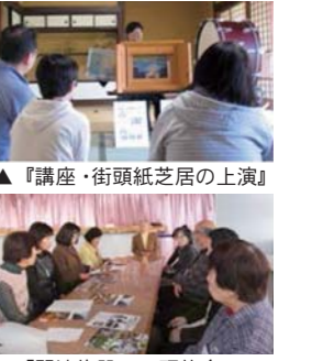
▲『講座・街頭紙芝居の上演』

【ボランティア内容】▼緑化活動 歴史博物館の敷地内 ▼旧 巨理邸の解説 ▼各種講座の補助 ▼街頭紙芝居の上演 など 【申し込み方法】歴史博物館に備え付けの申込用紙に必要事項を記入の上、郵送・ファクシミリ・持参のいずれかの方法で、歴史博物館まで提出し