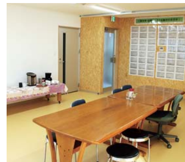
▲無料で使用できるミーティングルームでは各種講座や団体交流会などを開催することができます