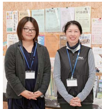
▲お気軽にご来館ください スタッフ一同お待ちしております

【申し込み・問い合わせ】 医療局経営管理部総務課 〒987-0511 登米市迫町佐沼字下田中25番地(登米市民病院内) ☎0220(21)6888