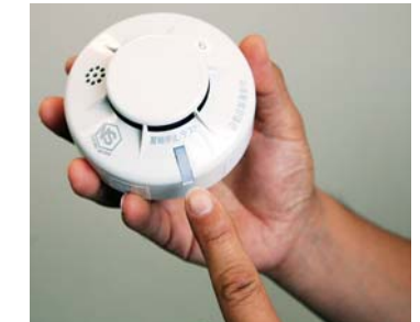
写真のように、ボタンを押すものや、ひもを引き点検するものがあります

※午前9時10分から午後1時までではコース内に車両は入れませんので、迂回路を通過してください。 ※指定駐車場(なかだアリーナ、中田中学校、中田球場、セブンスイレブン登米中田町宝江店裏の駐車場)以外には車両を止められません。なお、規制時間中は原則として駐車場の車の移動はできません。 【問い合わせ】教育委員会生涯学習課(体育振興係) ☎0220(34)2698