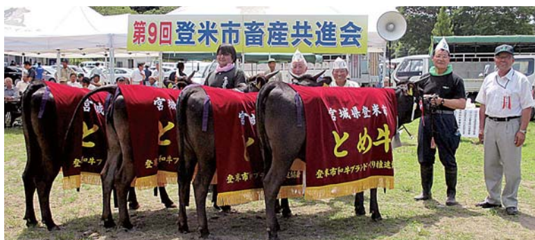
▲南方町和牛改良組合出品の4頭がチャンピオン賞に輝きました

に上向きに。14年度は肉牛で1頭当たり約93万4千円、子牛で約54万3千円と、原発事故以前より、高値で取引されるようになりました。 ※1：主に黒毛和種・褐毛和種・日本短角種・無角和種の4品種を指す※2：牛の品種の一つ。国内で飼育されている肉用種の約80%を占めるといわれる