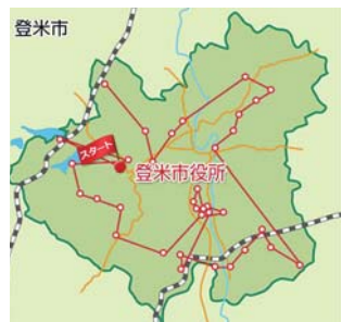
まずは、市内の名所巡りからスタート

現在、健康寿命の延伸を目指し、ウォーキング事業を展開しています。その一つとして本年8月20日から、スマートフォンアプリを利用し、1日8千歩、1年で300万歩を目標とし架空の旅に出る「登米市オリジナル歩き旅」を公開します。 「オリジナル歩き旅」は、市内の名所巡りから始まり、踏破後は本市にゆかりの深い「奥の細道」の旅につきな