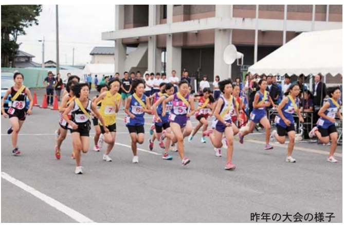
昨年の大会の様子