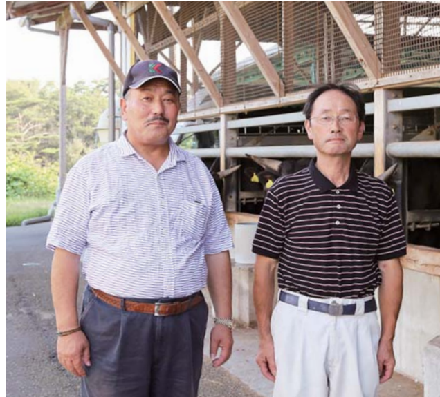
有限会社千葉仁畜産 代表取締役社長