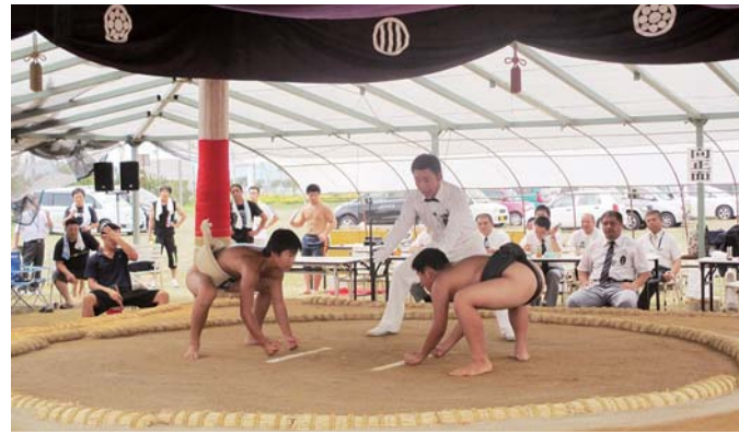
郷土が生んだ名力士、第三代横綱丸山権太左衛門 丸山杯少年相撲大会