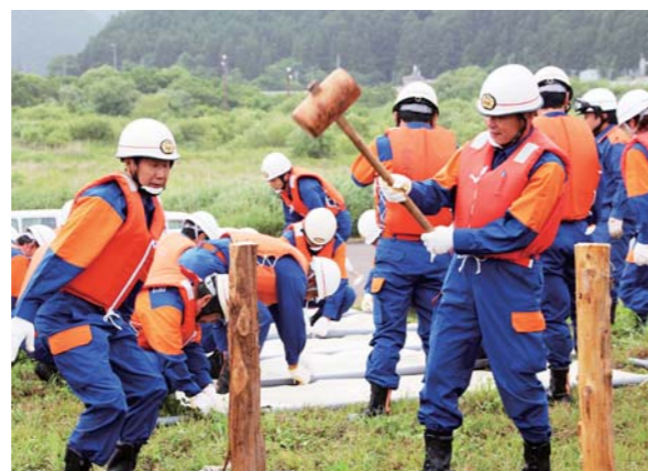
本番を想定しての訓練に、緊張感が漂います。作業は丁寧かつ迅速に進められました。

訓練では、袋に砂を詰めて土のうをつくる「準備工法」堤防の越水を防ぐ「積み土のう工法」堤防の漏水を防ぐ「シート張り工法」と漏水の圧力を弱め、量を軽減させる「月の輪工法」を実施。過去に東日本大震災で河川の堤防が被災していること、これから出水期を迎えることもあり、団員一同真剣な表情で訓練に取り組んでいました。