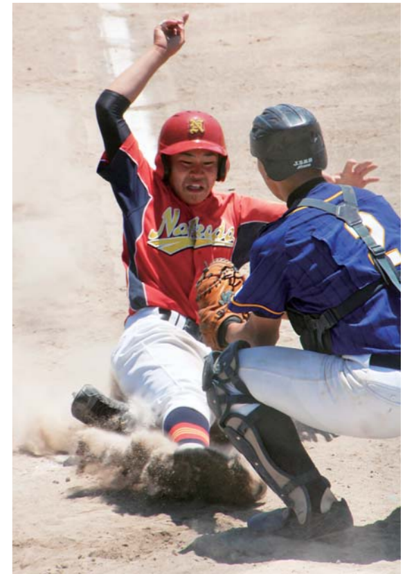
今号は、市、県を制し 上位大会への切符を手にした 市内の小中学生を紹介する