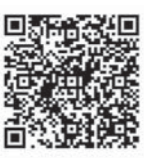
「登米市ホームページ」

寄付申込書を登米市ホームページからダウンロード、または担当課へ電話などでご請求いただき、郵送、ファクシミリ、またはメールなどでお申し込みください。 http://www.city.tome.miyagi.jp/kurashi/somu/furusatonouzei.html