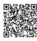
「ふるさとチョイス」

ふるさと納税ポータルサイト「ふるさとチョイス」の申し込みフォームからお申し込みください。携帯電話・スマートフォンからも利用できます。 http://www.furusato-tax.jp/japan/prefecture/04212