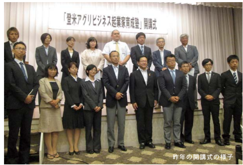
昨年の開講式の様子