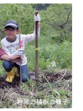
昨年の植樹の様子

市と県では、植林体験の参加者を募集します。また、お子さまの誕生や結婚記念日などを標柱に記し、植樹する「わたしの記念植樹」を実施します。「わたしの記念植樹」の募集人員は先着50人となります。 【日時】5月24日（日）午前10時～午後1時（小雨決行） 【集合場所・時間】津山町「道の駅津山」もくもくランド駐車場／午前9時30分 【植林場所】津山町横山字大萱沢地内