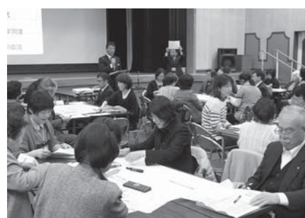
現在の活動をどう発展させていかなどが話し合われたグループワーク

ティア研修会を実施しました。会場の中田農村環境改善センターには、ボランティア会員や学校教諭など約140人が参加しました。