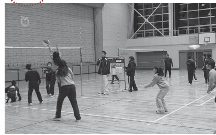
▲ソフトバレーを楽しむ児童たち。みんなで気持ちの良い汗を流しました