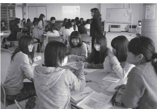
高校生たちはグループに分かれ、お互いにコミュニケーションを取りながら思春期の心と体の変化を学習

いる尚絅学園大学（名取市）の学生3人の指導を受けながら、伝え合うことの大切さを学びました。また、心理カウンセラーからは「人の権利」「生と性」について話がありました。講座終了後、参加者一人一人に受講証が手渡されました。