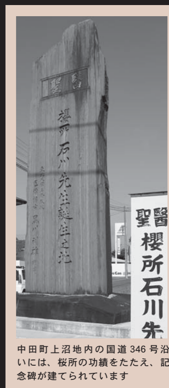
中田町上沼地内の国道346号沿いには、桜所の功績をたたえ、記念碑が建てられています