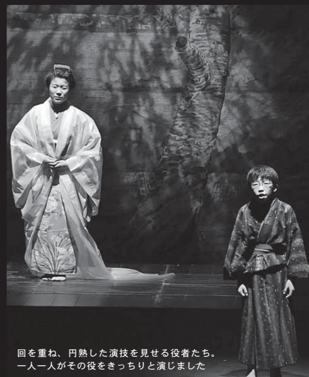
回を重ね、円熟した演技を見せる役者たち。一人一人がその役をきっちりと演じました