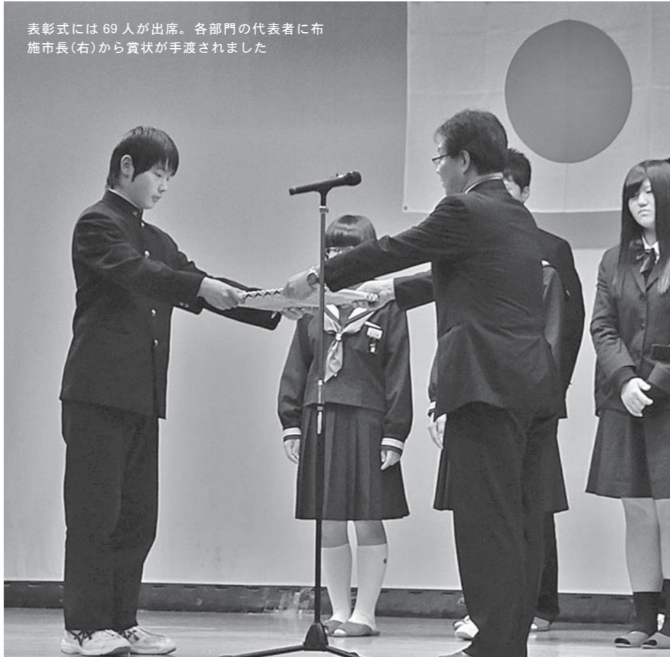
表彰式には 69 人が出席。各部門の代表者に布施市長(右)から賞状が手渡されました

文化・スポーツの分野で優秀な成績を収めた個人・団体などを表彰する「平成 26 年度市文化・スポーツ表彰式」が、3 月 8 日に中田農村環境改善センターで行われました。本年度は、文化・スポーツの 11 部門で 117 人、23 団体が受賞。部門ごとに布施孝尚市長から表彰状と記念品が贈られました。