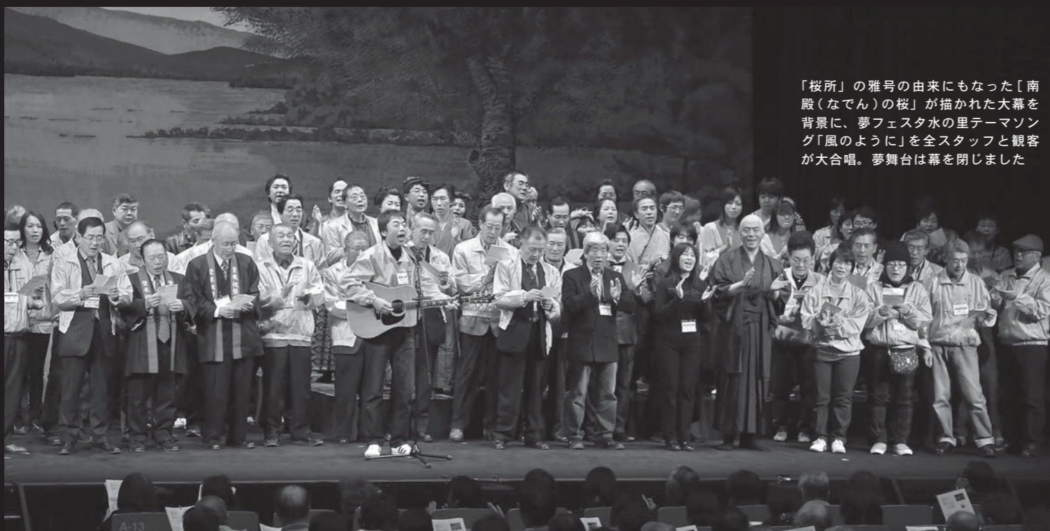
「桜所」の雅号の由来にもなった「南殿（なでん）の桜」が描かれた大幕を背景に、夢フェスタ水の里テーマソング「風のように」を全スタッフと観客が大合唱。夢舞台は幕を閉じました