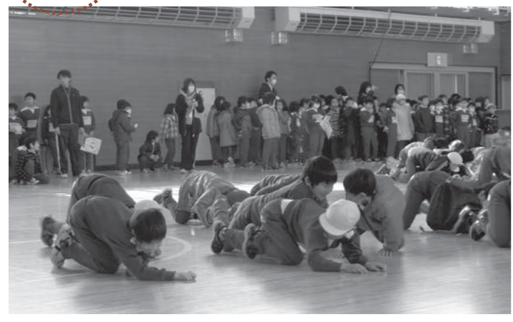
▲火災を想定した避難訓練では、煙を吸わないよう低い姿勢で避難