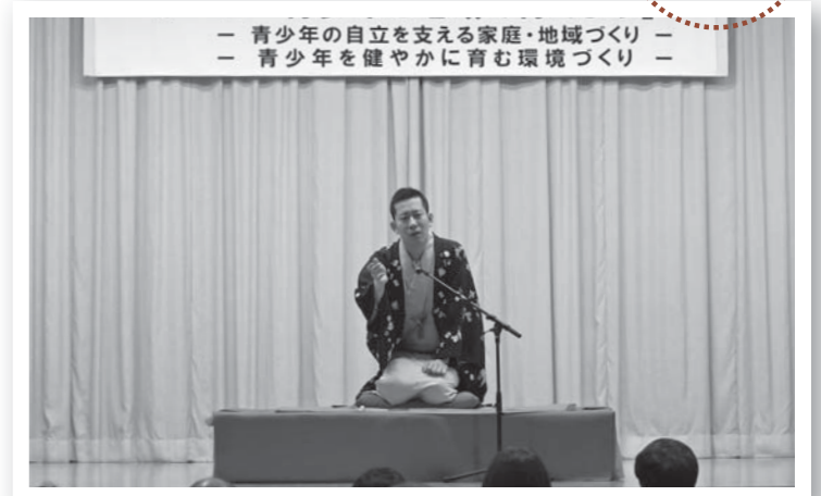
▲林家氏の話に、会場は終始笑いに包まれました