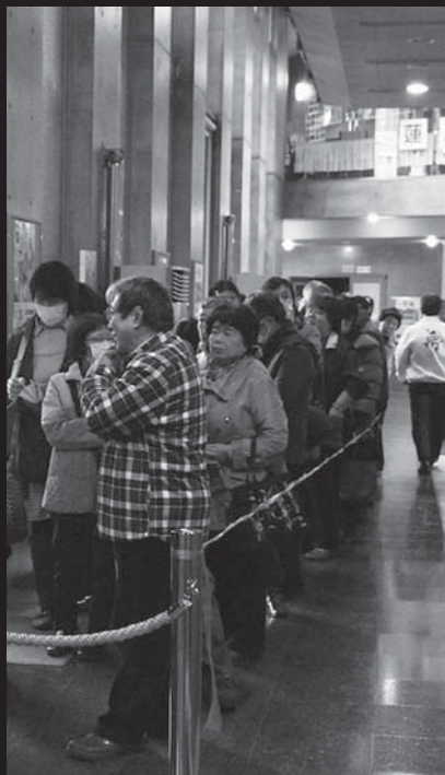
▲市民劇場として多くのファンを持つまでに成長した「夢フェスタ」。入場開始前から多くの来場者が列を作りました