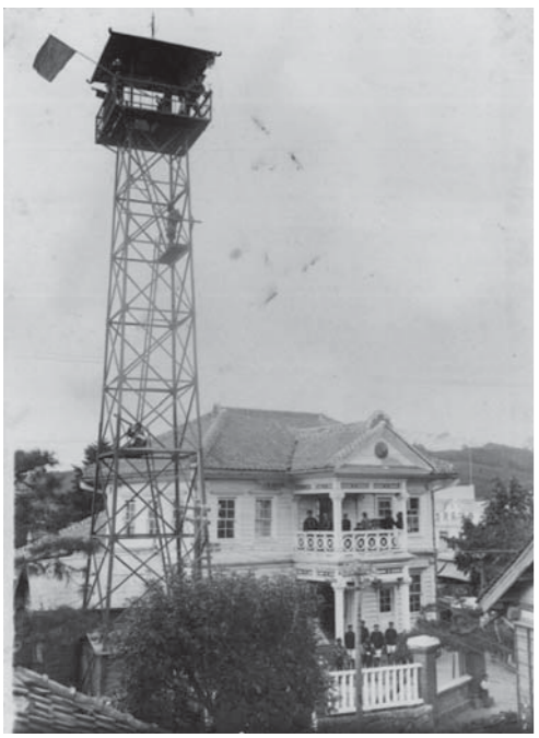
【旧登米警察署庁舎と火の見櫓】 防空演習の様(昭和13年9月15日撮影)

年前の大正15年8月に建設されました。警察署は昭和21年まで警察行政と消防行政を管轄していた、当時の消防が警察行政と一体となっていたことを現代に伝える貴重な建造物です。 ※旧登米警察署庁舎 附棟札(昭和63年8月26日県指定) 【問い合わせ】 教育委員会生涯学習課(文化振興・文化財保護係) ☎0220(34)2698