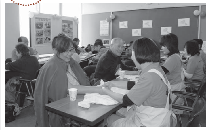
▲ハンドマッサージを体験する来場者