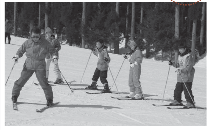
▲指導員から丁寧にスキーを教わる児童たち

市スポーツ少年団豊里支部と市教育委員会豊里教育事務所では2月21日、「そり遊び・スキー教室」を大崎市鳴子のオニコウベスキー場で実施しました。スポーツ少年団と、町内の子どもたちが自然体験やスポーツなどを通して交流する「ときめきキッズクラブ」の会員ら36人が参加しました。参加者は、そり遊びとスキーの班にそれぞれ分かれ、スキー班は指導員から一人一人丁寧に指導を受けていました。参加者は、時間がたつにつれ仲良くなり、スピードを競い合うなど楽しんでいました。