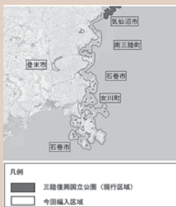
凡例 ■三陸復興国立公園(移行区域) □今回編入区域