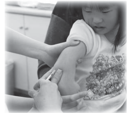
【表1】 定期の予防接種(接種費用は市が全額負担します)

市では、定期予防接種することを勧めるとともに、任意予防接種費用の全額助成を実施しています【表1、2】。保護者の皆さんは母子健康手帳を確認し、まだ済んでいないものがある場合は、体調の良いときに接種しましょう。 【問い合わせ】市民生活部健康推進課(健康推進係) ☎0220(58)2116