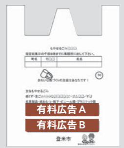
■広告掲載袋イメージ

市では、家庭で使用する「燃やせるごみ指定袋(大)」に掲載する広告の広告主を募集します。掲載を希望する場合は、下記によりお申し込みください。 【対象者】市内にある事業所、店舗などを有する法人などで、その業務内容が明確なこと。 【対象袋】燃やせるごみ指定袋(大) 【掲載期間】おおむね平成27年7月から平成28年3月までの販売分。ただし、流通品につき一斉に販売することはできません。詳しくは市ホームページをご覧ください。 【広告内容】▶掲載枚数=約150万枚(販売枚数によって変動があります) ▶掲載サイズ=①1枠の大きさ=縦70mm×横250mm ②1色塗り(赤色) ▶掲載枠2枠▶広告掲載料=1枠15万円 【申込受付期間】2月23日(月)～3月13日(金) 午前8時30分～午後5時15分(土・日曜・祝日を除く) 【決定方法など】掲載を可とする広告主が枠数を超えた場合には、抽選で決定します。 【申し込み・問い合わせ】環境事業所クリーンセンター ☎0225(76)0102 ※募集に関する内容や応募に必要な書類、提出方法などについては市ホームページをご覧ください。