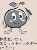
農林業センサスマスコットキャラクター「つっちー」

農林水産省では、平成 27 年 2 月 1 日現在で「2015 年農林業センサス」を実施します。この調査は、わが国の農林業・農山村地域の実態を明らかにする最も基本的な調査です。