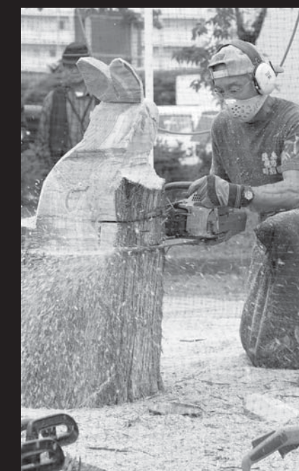
チェーンソーアートの実演。匠(たくみ)の手にかかると丸太がみるみるウサギの形になりました