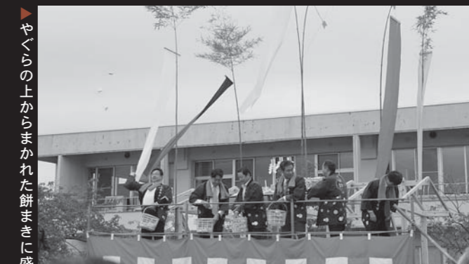
やぐらの上からまかれた餅まきに盛り上がった模擬上模式