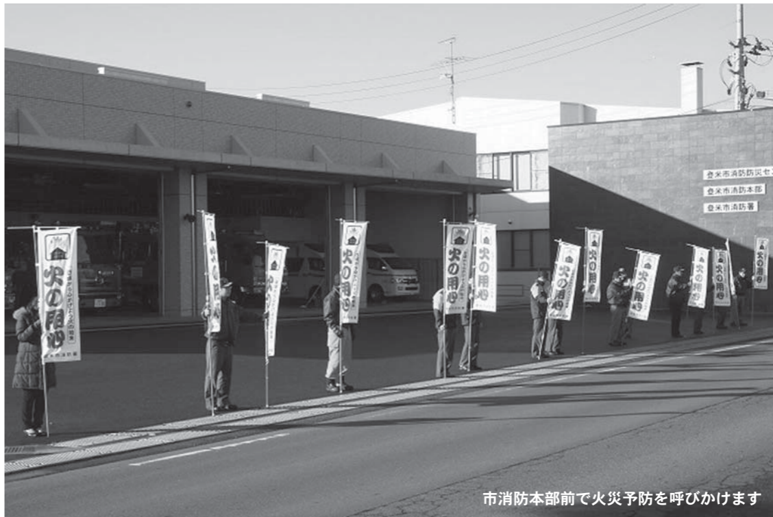
市消防本部前で火災予防を呼びかけます

これから冬に向けて日増しに寒くなり、ストーブなどの暖房器具の使用が増えることに加え、空気も乾燥し、火災が発生しやすい季節を迎えます。火災予防に対する意識をより一層高め、火災が発生しないよう注意しましょう。