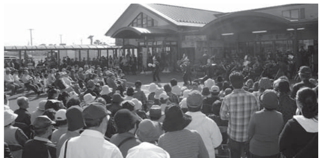
駐車場いっぱいの観客が見守る中、歌や踊りのパフォーマンスを交え演奏する陸上自衛隊音楽隊

望コンサート」と銘打ち、地元の大鼓やよさこいなどが披露されました。19日には陸上自衛隊音楽隊が登場。中田中学校吹奏楽部と合同演奏したり、映画「アナと雪の女王」の主題歌や東日本大震災復興ソング「花は咲く」などを演奏したりして10周年を盛り上げました。