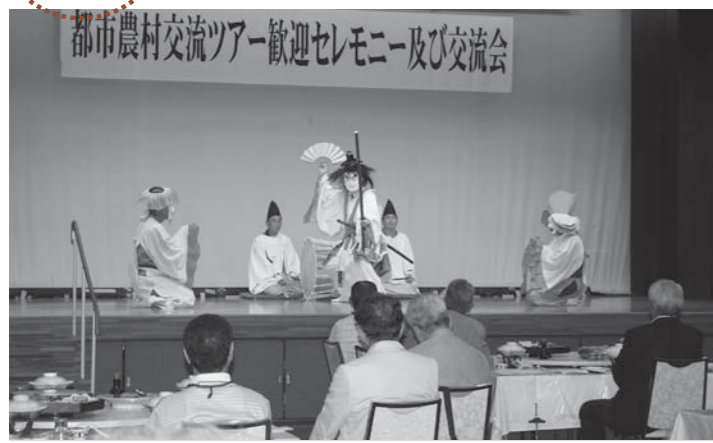
▲神楽によるオープニングで参加者を歓迎しました