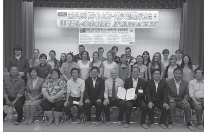
9月19日に開かれた歓迎会。友好確認書を取り交わし、今後、一層の相互交流が進むものと期待されます

オーストラリア・クイーンズランド州メリバラにある州立高校「オールドリッジ・ステイト・ハイスクール」の訪問