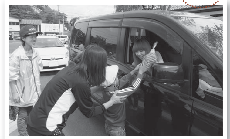
▲ドライバーへ赤いリンゴを手渡す児童