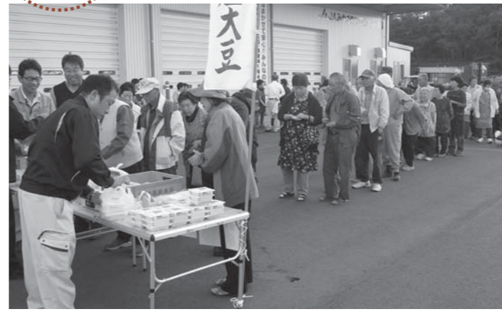
▲石越産大豆を使用した商品「さんごやセット」には長蛇の列ができました