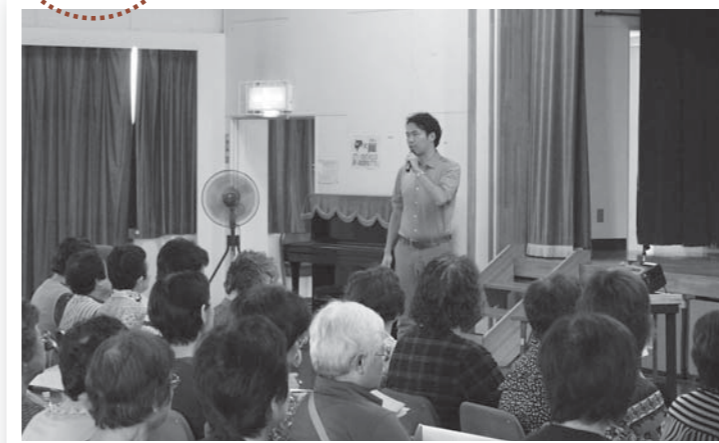
▲全員参加型の地域包括ケア体制の重要性を説く田上院長(中央)