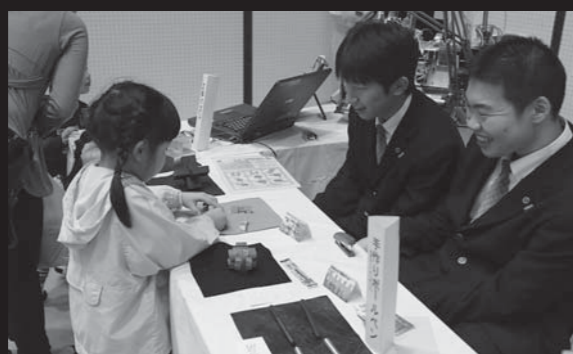
市内の高校生も作品などのブースを出展。来場者と触れ合いました