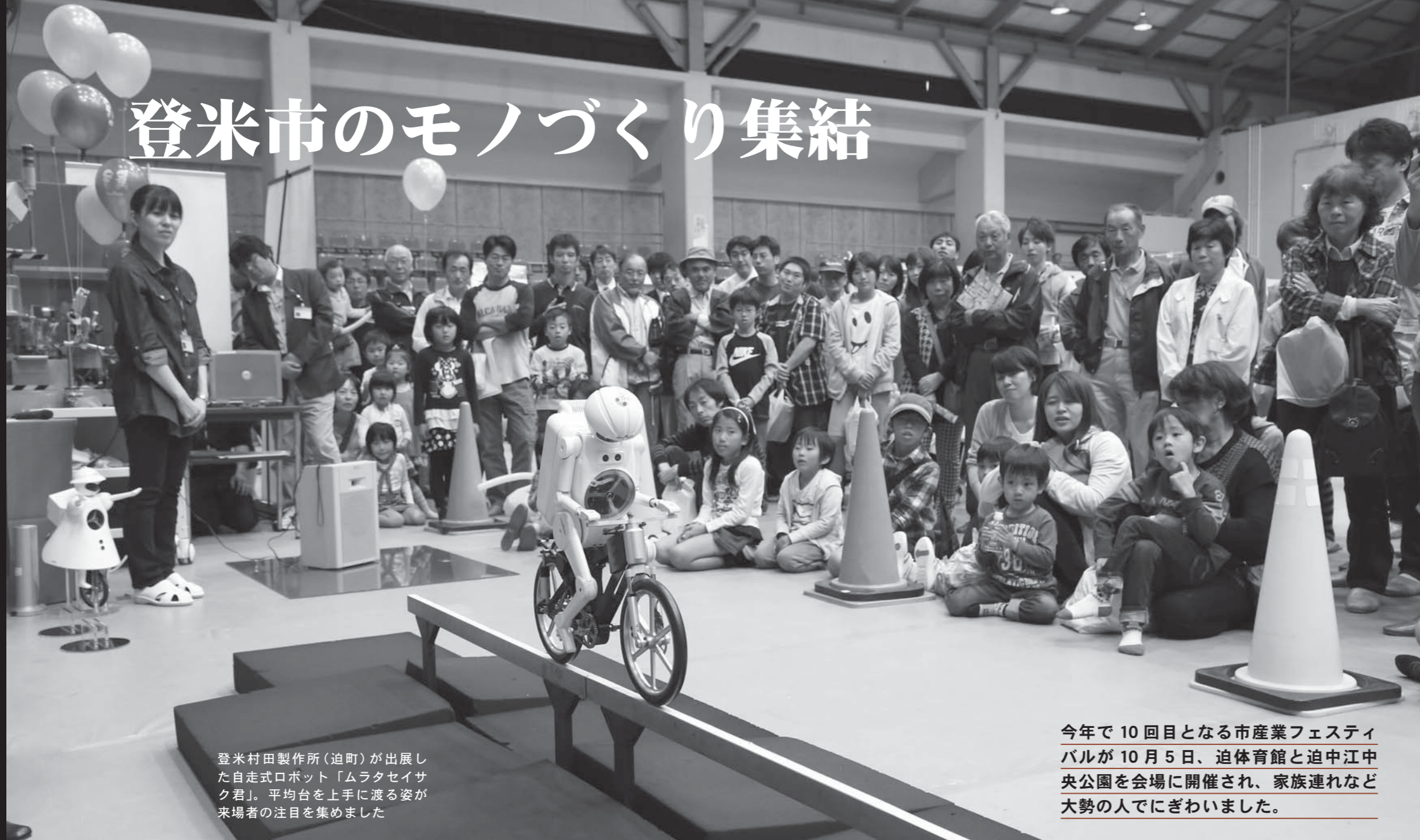
登米村田製作所(迫町)が出品した自走式ロボット「ムラタセイサク君」。平均台を上手に渡る姿が来場者の注目を集めました