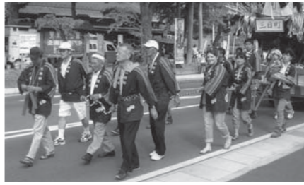
訪問団はホームステイ先で市民と交流。伝統の「登米(とよま)秋まつり」に参加した女子生徒(中央)もいました

オーストラリア・クイーンズランド州メリバラにある州立高校「オールドリッジ・ステイト・ハイスクール」の訪問