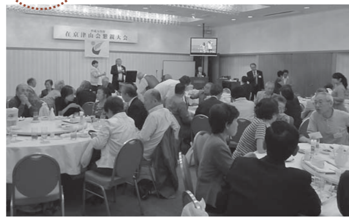
▲ふるさと津山の思い出話を語り合う参加者