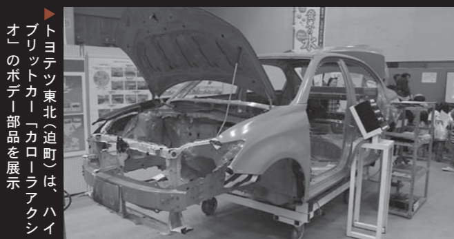
トヨタ自動車(迫町)は、ハイブリットカー「カローラアクシオ」のボデー部品を展示