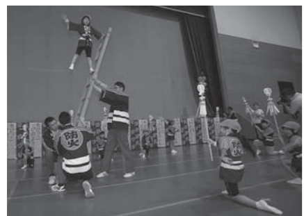
北上保育園の園児は、見事な「はしご乗り」を披露し会場を沸かせました

「幼年防火まつり」が9月11日、中田総合体育館で開かれ、子どもたちが「火の用心」の心構えを学びました。