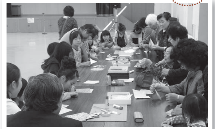
▲折り紙をする参加者。思い思いの形に折って遊びました