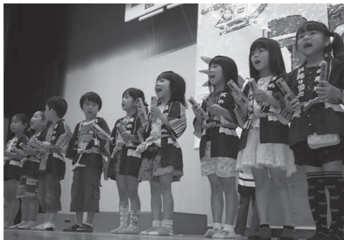
拍子木を打ち元気に「防火の誓い」を述べる豊里保育園の園児たち

「幼年防火まつり」が9月11日、中田総合体育館で開かれ、子どもたちが「火の用心」の心構えを学びました。