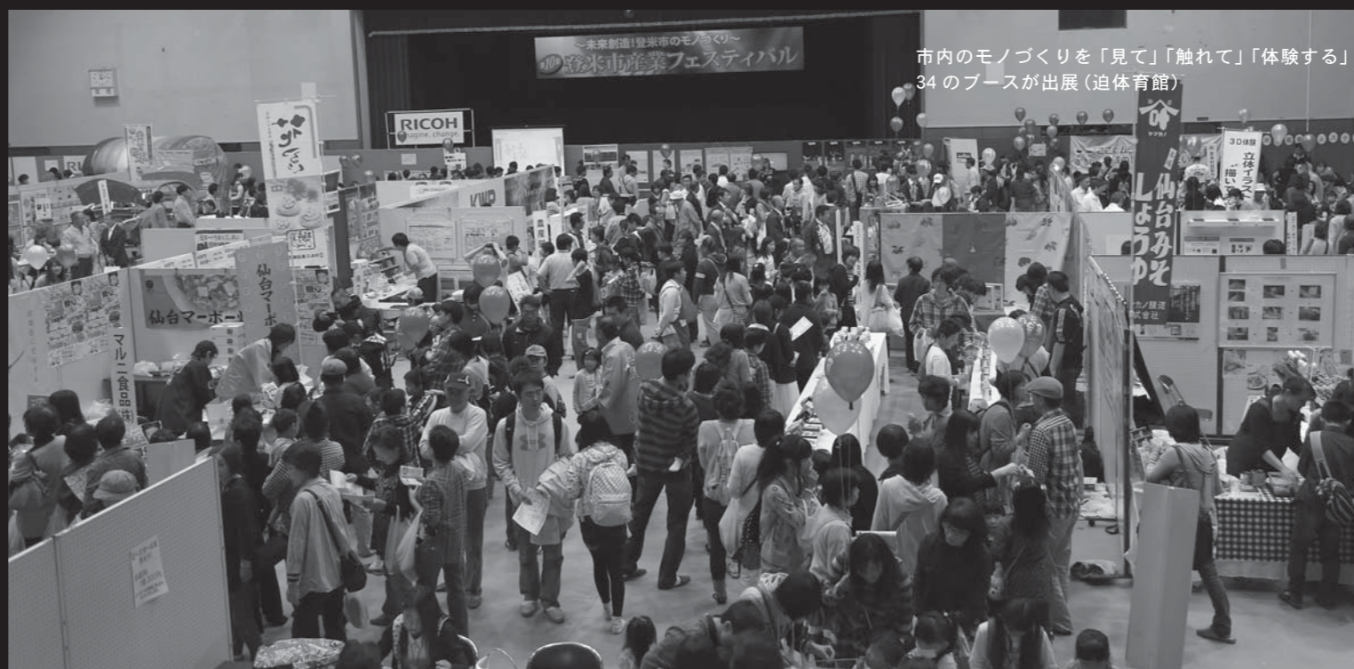
市内のモノづくりを「見て」「触れて」「体験する」34のブースが出展(迫体育館)