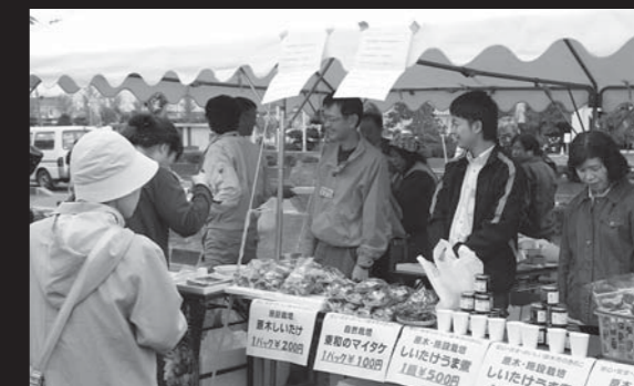
会場には地場産品を直売するテントも並び、来場者が買い求めました