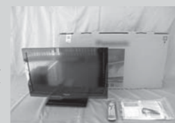
昨年の差し押さえ物品例

FAX 022(211)2289 http://www.pref.miyagi.jp/soshiki/choutai/