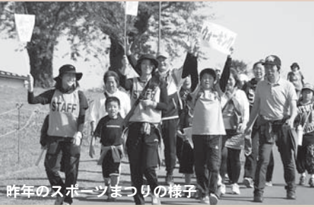
昨年のスポーツまつりの様子

【問い合わせ】登米市スポーツまつり実行委員会(中田総合体育館内) ☎0220(34)7302