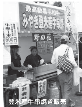
登米産牛串焼き販売

▼登米グルメ村&軽トラ市▼市内産農産物PR販売▼登米産牛串焼き販売▼牛肉・豚肉消費拡大フェア▼米粉チヂミづくり体験