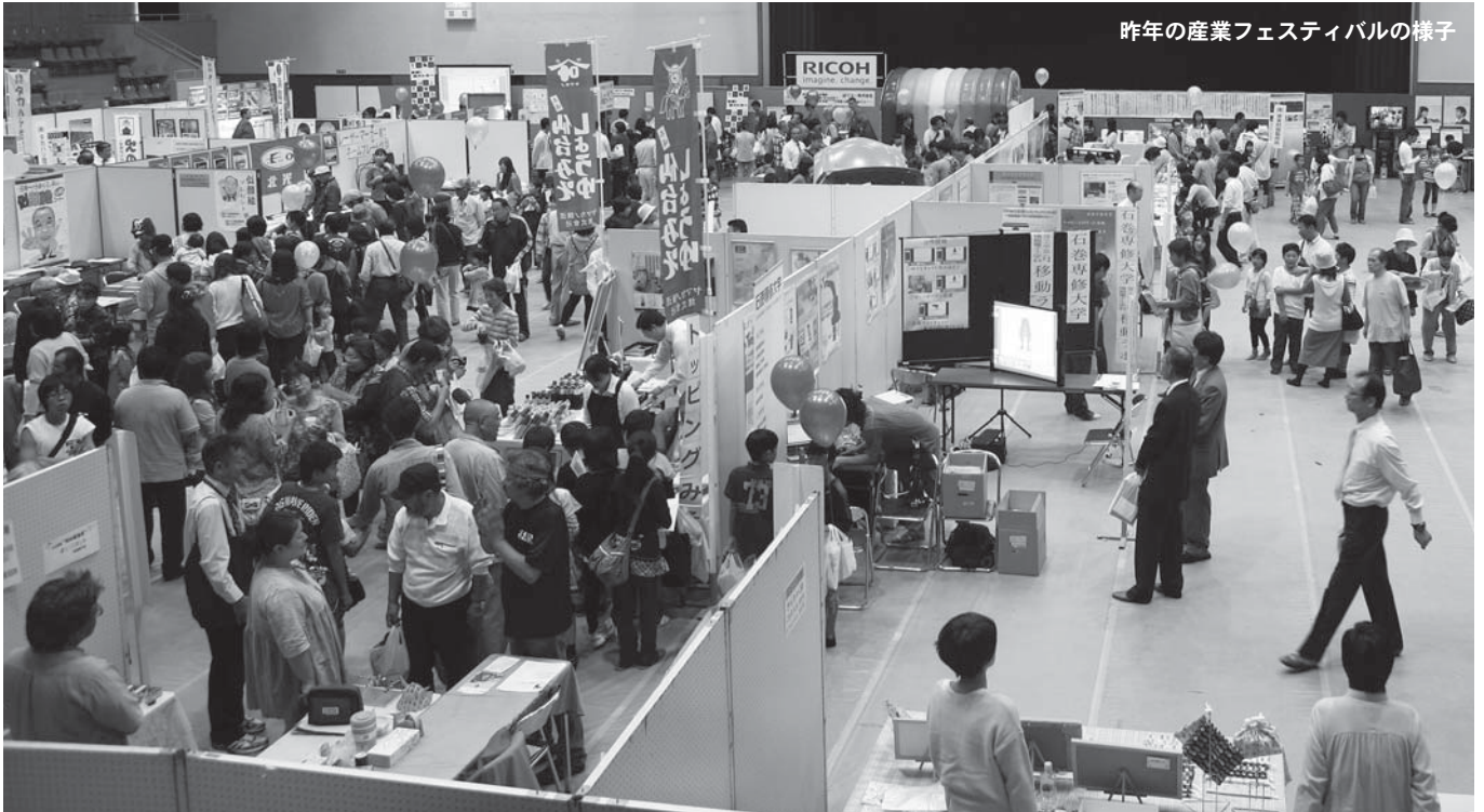
昨年の産業フェスティバルの様子

市内には、食品加工や木材加工、電子部品や金属製品、自動車部品など多くのモノづくり産業があります。その多様なモノづくり産業や企業を紹介し、市民との触れ合いの場を提供するため「登米市産業フェスティバル」を開催します。