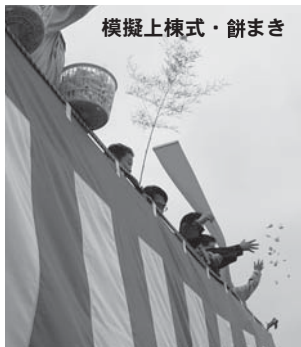
模擬上棟式・餅まき

▼H@!FM(ハット・エフエム)による実況放送▼模擬上棟式、餅まきプレゼント▼ちびっこ広場▼豪華賞品が当たる「スタンプラリー」