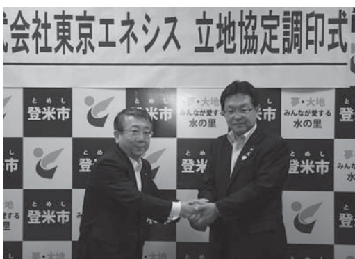
メガソーラーの立地協定に署名し握手する布施市長(右)と榑崎社長。本年6月に工事に着手。平成27年2月に発電を開始する予定です。