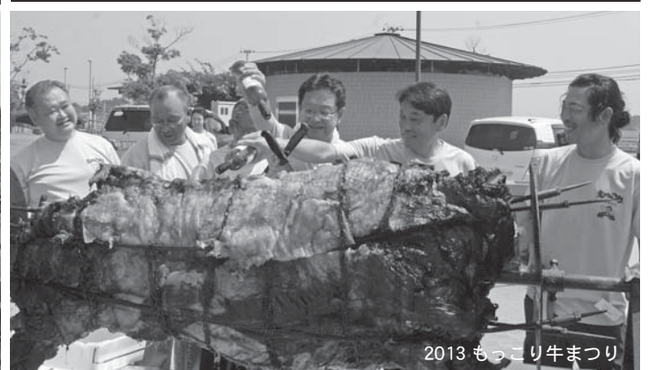
2013 もっこり牛まつり