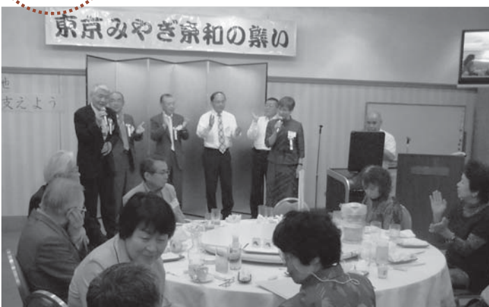
▲懇親会で米川音頭を合唱する皆さん