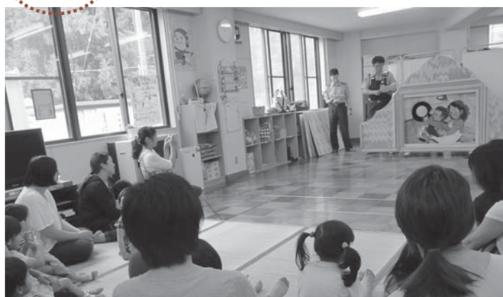
▲初のお披露目となる大型紙芝居で交通ルールを学ぶ子どもたち