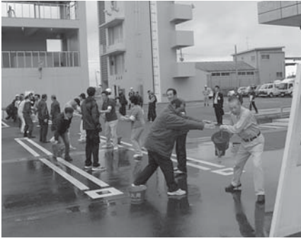
バケツリレーによる初期消火訓練を行う参加者

市では、平成26年度の市総合防災訓練を6月8日、市消防防災センターを会場に実施しました。今年は東和町を重