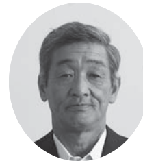
猪又 基 中田選挙区 (中田町・沼畑)