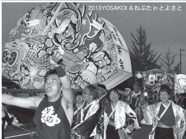
2013 YOSAKOI & ねぶた in とよさと

夏本番。古くから伝わる伝統的な祭りや地域の特色を生かした祭りなど、登米市の熱い夏をにぎやかに彩るイベントの数々。見るもよし！参加するもよし！今年の夏も感動の名場面を心と体に刻みに出掛けてみませんか？