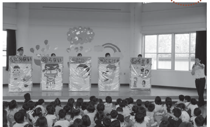
▲大きなパネルで犯罪を未然に防ぐ方法を教わりました