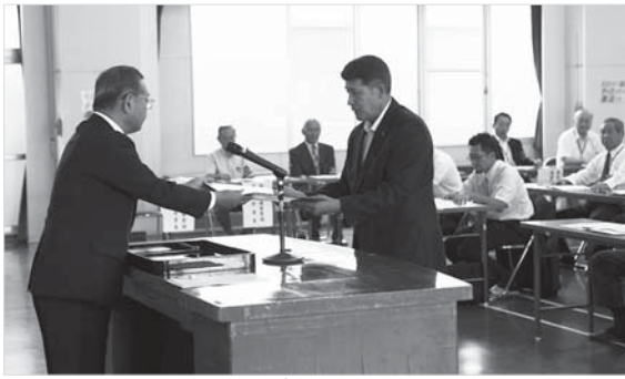
千葉委員長(左)から当選証書が付与されました

※写真について、選挙で選出された人は、右から左へ選挙区ごと、立候補届け出順。敬称略