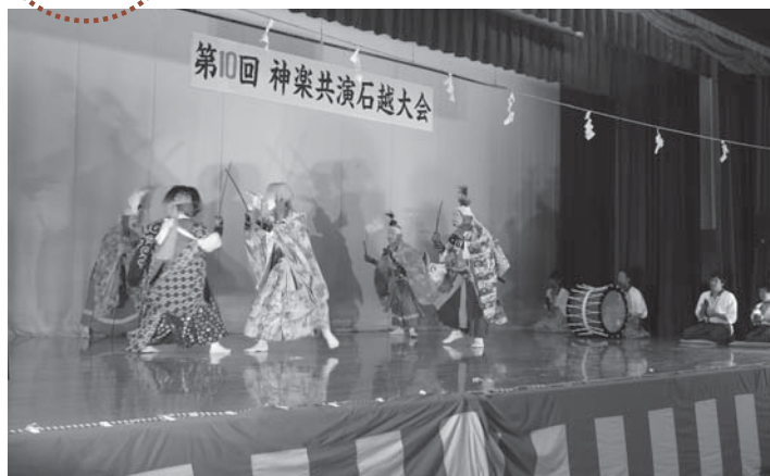
▲赤谷南部神楽保存会の迫力ある舞