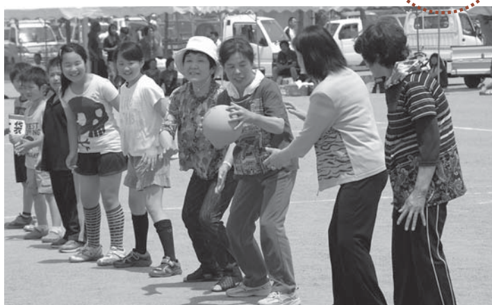
▲新種目「ボール送りリレー」で息の合ったプレーを披露