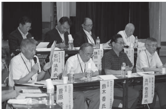
計画策定の効果と課題を発表するコミュニティ組織の代表者

市では昨年度に引き続き、地域づくり計画の策定に取り組みコミュニティ組織を対象に支援しています。