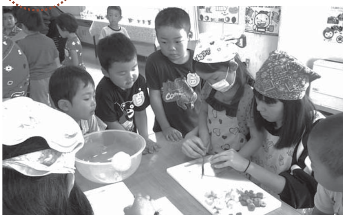
▲高校生のお姉さんと一緒に野菜を切る園児たち