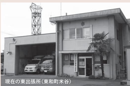
現在の東出張所(東和町米谷)