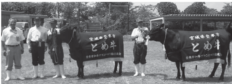
▲チャンピオン賞に輝いたおくひら号(右)とおくひろ号(左)

共進会は、地域の家畜改良意欲の高揚と飼養管理技術の向上と普及に努めることを目的に毎年開催しているものです。