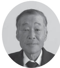
まもる 齊 守 米山選挙区 (米山町・下小路)