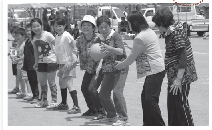
▲新種目「ボール送りリレー」で息の合ったプレーを披露