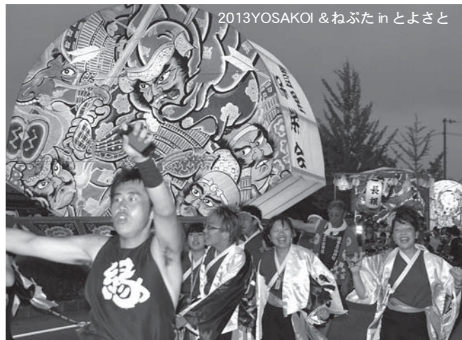
2013 YOSAKOI & ねぶた in とよさと

夏本番。古くから伝わる伝統的な祭りや地域の特色を生かした祭りなど、登米市の熱い夏をにぎやかに彩るイベントの数々。見るもよし！参加するもよし！今年の夏も感動の名場面を心と体に刻みに出掛けてみませんか？