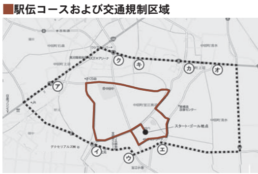
駅伝コースおよび交通規制区域

市中学校駅伝競走大会が中田町を会場に開催されます。レースの発着は「なかだアリーナ」です。下記の地図に記載した区間がコースとなるため、大会当日は交通規制がされます。コース付近を通る場合は、十分にご注意ください。 【大会日時】9月4日(木)午前9時～午後0時30分 ▼女子 9時30分スタート ▼男子 11時スタート ※雨天決行。台風などの悪天候時には順延となります。 【交通規制区間(下図)】 ●コース ●迂回路が誘導します。 ※午前9時から午後0時30分まで、コース内に車両は入れません。迂回路を通じてくだ