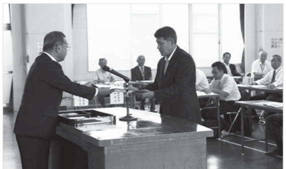
千葉委員長(左)から当選証書が付与されました

6月29日告示7月6日執行の市農業委員会委員一般選挙は、各選挙区全てで委員定数(計40人)と立候補者数が同数となったため、無投票となりました。