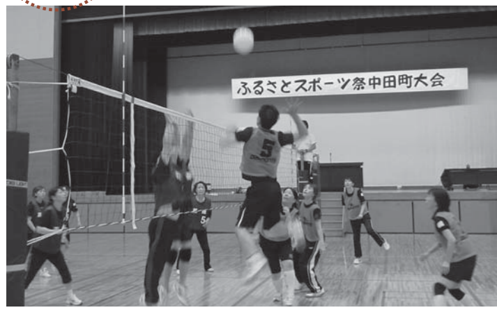
▲どのチームも優勝目指して熱戦を繰り広げました