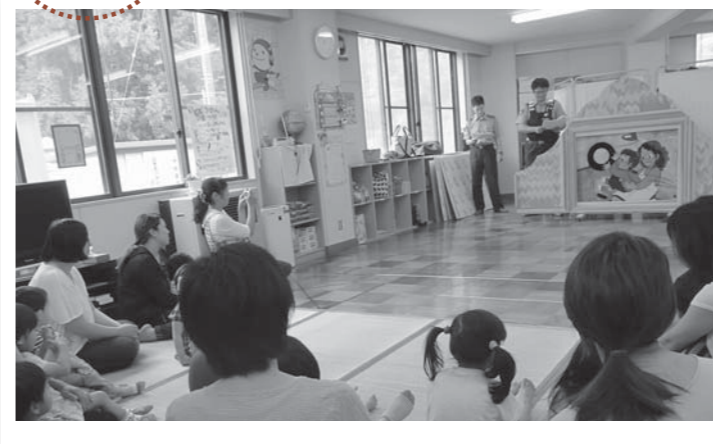
▲初のお披露目となる大型紙芝居で交通ルールを学ぶ子どもたち