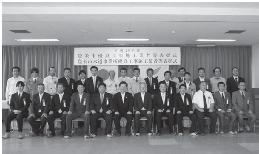
優良工事業者として表彰された皆さん

市では7月4日、本年度の市優良工事施工業者、市水道事業優良工事施工業者の表彰式を開催。模範となる工事を施工した13業者を表彰しました。