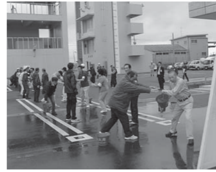
パケツリレーによる初期消火訓練を行う参加者

市では、平成26年度の市総合防災訓練を6月8日、市消防防災センターを会場に実施しました。今年は東和町を重