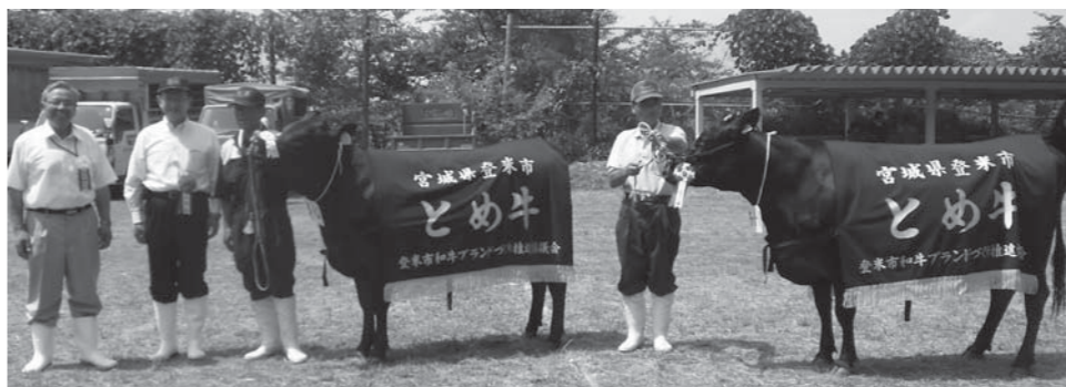
▲チャンピオン賞に輝いたおくひら号(右)とおくひら号(左)

共進会は、地域の家畜改良意欲の高揚と飼養管理技術の向上と普及に努めることを目的に毎年開催しているものです。