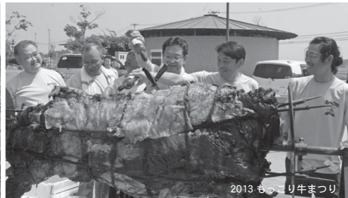
2013 もっこり牛まつり