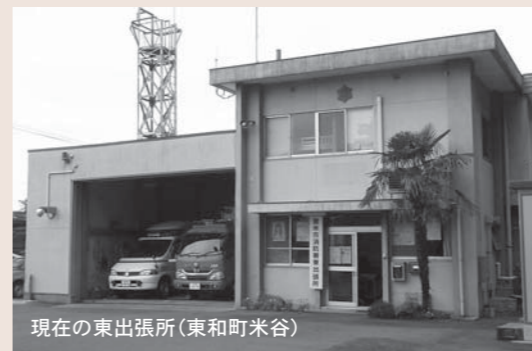
現在の東出張所(東和町米谷)

消防署東出張所(東和町米谷字私荷)は、施設の老朽化や職員の増員によって庁舎が手狭になったこと、急傾斜地崩壊危険地区にあり建物倒壊の危険性があることから、東和町錦織字小童子へ移転することになりました。 移転先については、災害発生箇所10分程度で到着できる区域を現在より増やし、洪水などの影響を受けにくく大規模な自然災害などに対応できる場所を候補地として選定、議会などで審議を重ねた上で決定しました。 新出張所の建築工事は本年8月の着工、平成27年4月の業務開始を予定しています。工事期間中は工事車両の往来などで、地域住民をはじめ市民の皆さんには大変ご迷惑をおかけしますが、ご理解とご協力をお願いします。 ●消防署東出張所の概要 【移転先】東和町錦織字小童子93番地19(東和総合運動公園北側入口) 【構造】木造一部鉄骨造り平屋建て 【延べ床面積】約497平方メートル 【職員数】15人 【配備車両】3台(消防ポンプ自動車、高規格救急車、査察広報車) 【勤務体制】24時間勤務(8時30分～翌日8時30分の二交替制)