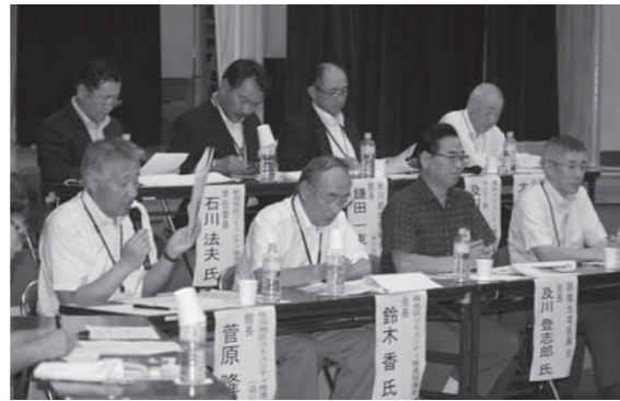
計画策定の効果と課題を発表するコミュニティ組織の代表者

市では昨年度に引き続き、地域づくり計画の策定に取り組みコミュニティ組織を対象に支援しています。