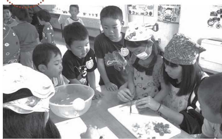
▲高校生のお姉さんと一緒に野菜を切る園児たち