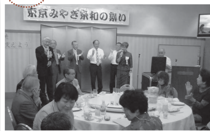
▲懇親会で米川音頭を合唱する皆さん