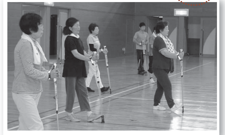
▲背筋を伸ばして、視線は前に。たくさんの良い汗をかきました