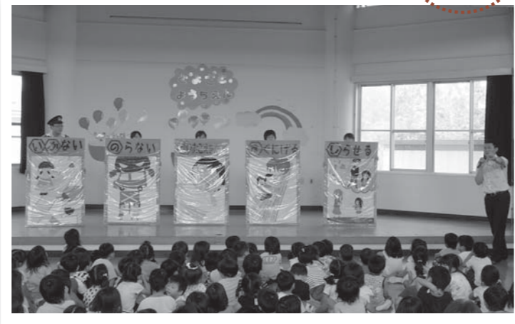
▲大きなパネルで犯罪を未然に防ぐ方法を教わりました