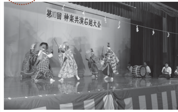
▲赤谷南部神楽保存会の迫力ある舞