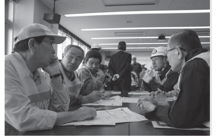
大規模災害時の初動活動を想定した図上訓練。自主防災組織役員らが、地区内住民の安否確認や食糧・物資の調達、役割分担などを話し合いました

市では、平成26年度の市総合防災訓練を6月8日、市消防防災センターを会場に実施しました。今年は東和町を重