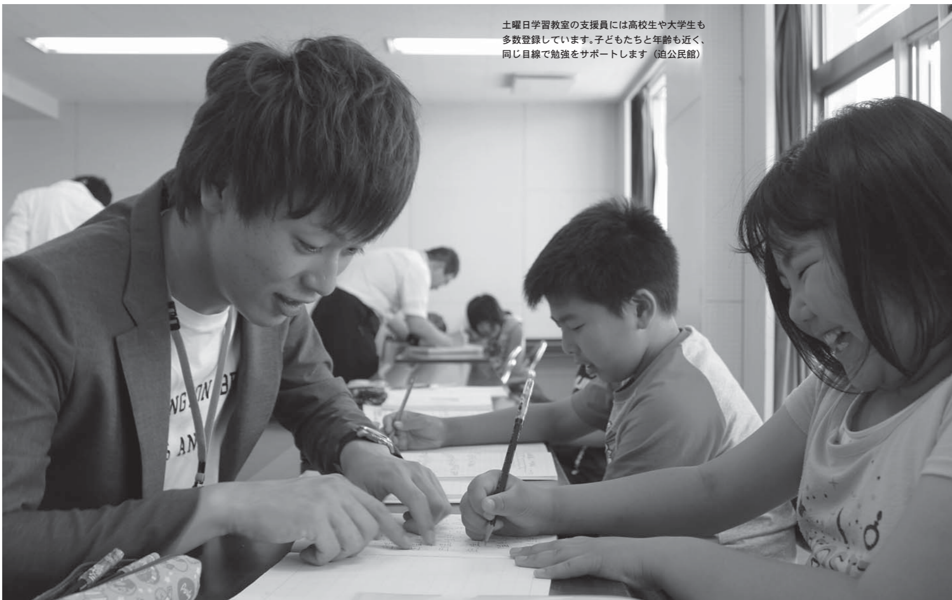
土曜日学習教室の支援員には高校生や大学生も多数登録しています。子どもたちと年齢も近く、同じ目線で勉強をサポートします（迫公民館）

市教育委員会では、家庭学習の定着と学力向上に向けた取り組みの一つとして、昨年度から開始した「土曜日学習教室」を本年度も開催。子どもたちの学びを支援しています。