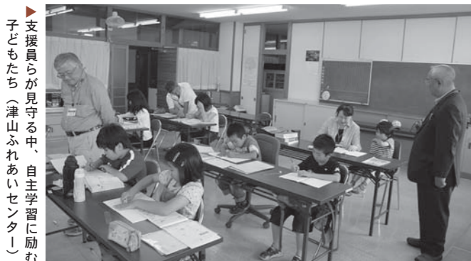
支援員が見守る中、自主学習に励む子どもたち（津山ふれあいセンター）