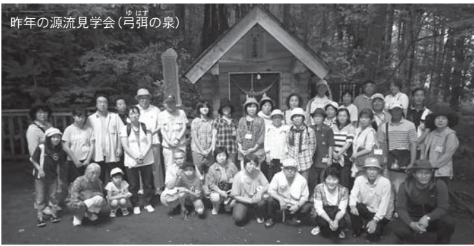
昨年の源流見学会(弓弭の泉)