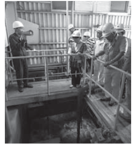
▲旧松尾鉦山新中和処理施設を見学