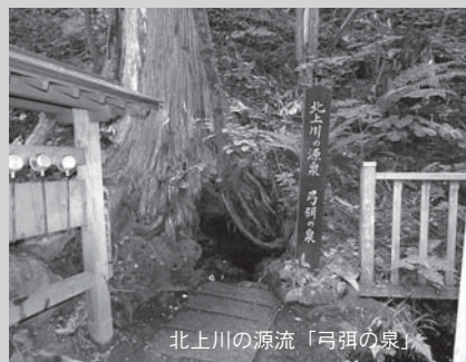
北上川の源流「弓弭の泉」

【弓弭の泉】北上川の源流には諸説ありますが、国土交通省では、岩手町御堂観音境内「弓弭の泉」の湧水を源流と定めています。