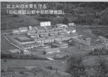
北上川の水質を守る 「旧松尾鉦山新中和処理施設」

【旧松尾鉦山新中和処理施設】旧松尾鉦山から流れ出る強酸性の湧水を中和処理しています。