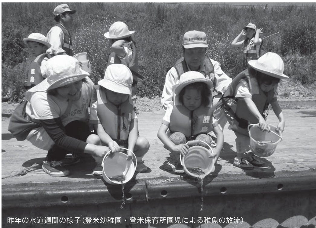
昨年の水道週間の様子(登米幼稚園・登米保育所園児による稚魚の放流)