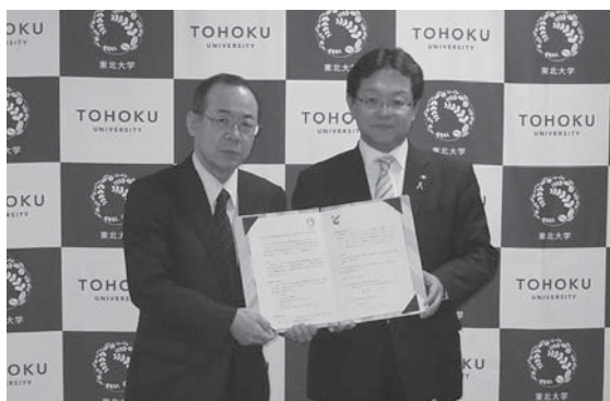
協定を締結した布施市長(右)と東北大学院の駒井科長

定の締結により、大学の知見を生かした農業分野の人材育成、6次産業化など1次産業を基軸とした新しいビジネス創出に取り組んでいきたい」と述べました。市では昨年、市内の農業経営者を育成する「登米アグリビジネス起業家育成塾」などで、同大学院から支援を受けています。