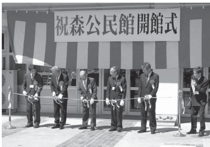
旧・森小の校舎を改装して開館した新しい森公民館

東日本大震災で大きな被害を受け使用できなくなった迫町森地区にある森公民館。平成25年4月に佐沼小と統合し