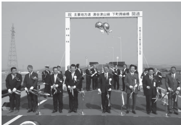
完成した跨線橋の開通を盛大に祝いました

本市津山町の国道45号と浦谷町の国道346号を結ぶ主要地方道・浦谷津山線で、豊里町のJR気仙沼線に架かる