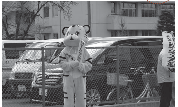
▲ドライバーに安全運転をアピールする着ぐるみのトラ

春の交通安全週間初日となる4月7日、豊里地区の合同出発式がJ.Aみやぎ登米豊里支店前で実施されました。出発式には交通安全協会豊里支部や交通安全母の会など約50人が参加。「交通事故のない安全安心なまちづくり」を宣言し、それぞれ街頭指導に出発しました。街頭指導では、会員らが信号待ちのドライバーにチラシや母の会手作りの折り鶴を手渡し、安全運転を呼び掛けました。この日は「着ぐるみ作戦」も実施。パング、サル、トラの3匹の着ぐるみが県道を走るドライバーに手を振り、交通安全をアピールしていました。