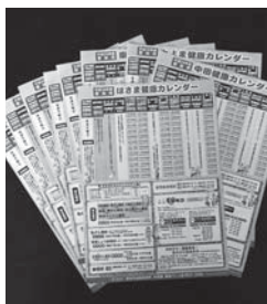
各家庭に配布している健康カレンダーで健診日程を確認しておきましょう

定期的に健診・検査を受けることは、自分の健康課題を知る絶好の機会です。1年に一度受診して健康増進に役立てましょう。