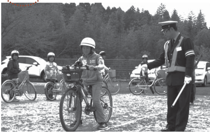
▲自転車の交通ルールを学ぶ児童たち