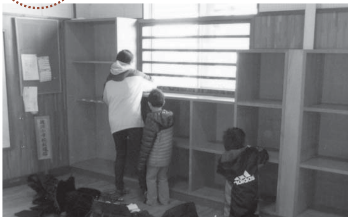
▲普段使用しているロッカーも心を込めて清掃しました