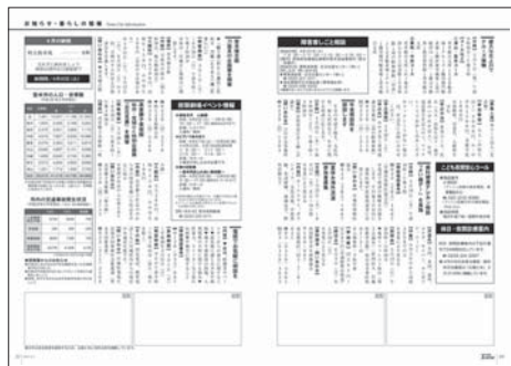
【図1】広報とめ広告掲載イメージ