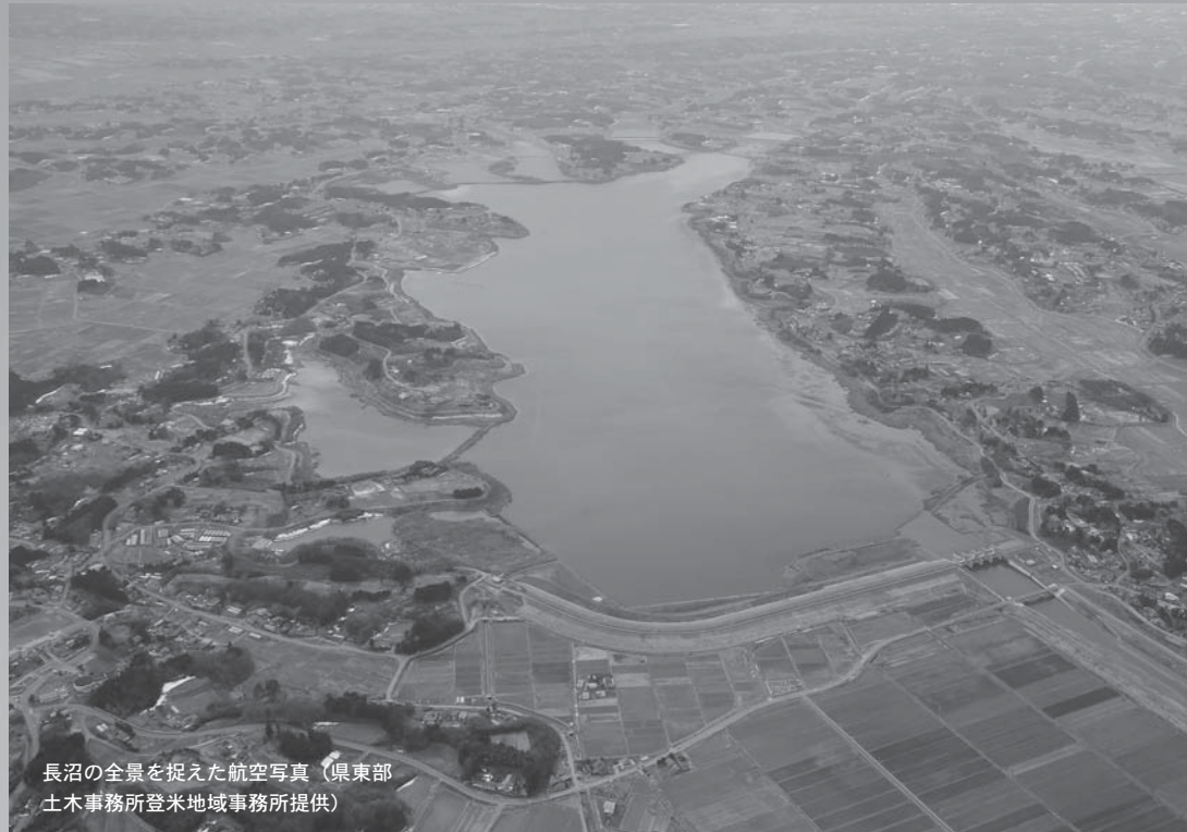
長沼の全景を捉えた航空写真