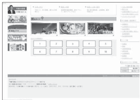
【図2】ホームページ広告掲載イメージ