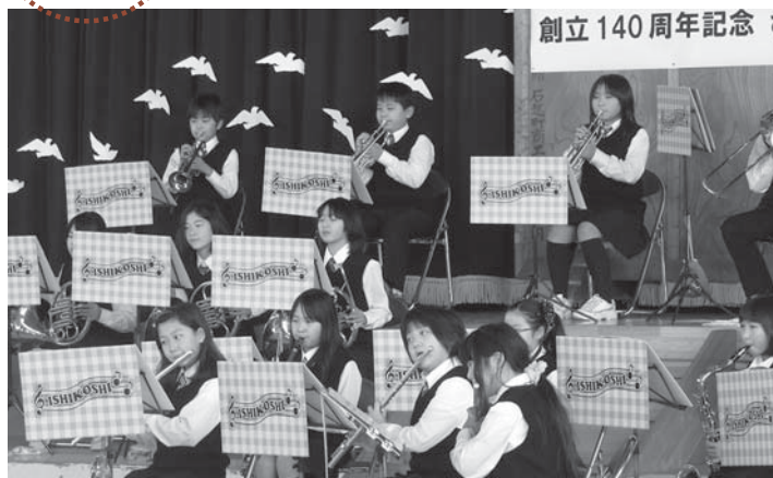
▲新しい楽器を手に、感謝の気持ちを込めた演奏を披露する児童たち