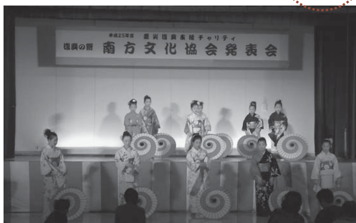
▲ステージでは、子どもたちのかわいらしい踊りも披露されました