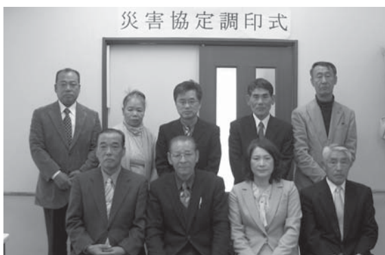
災害協定を締結した八の森部落会と友愛自治会、グループホームはさまの関係者ら