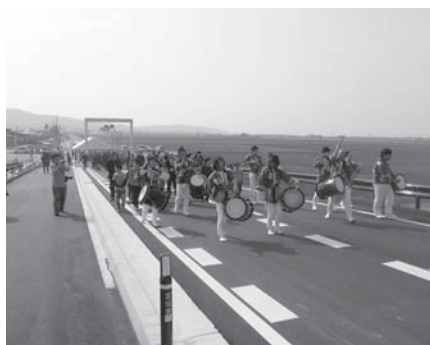
住民らによる渡り初めも行われた開通式

本市津山町の国道45号と浦谷町の国道346号を結ぶ主要地方道・浦谷津山線で、豊里町のJR気仙沼線に架かる