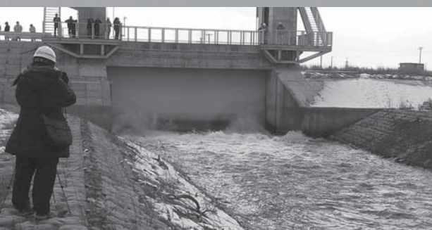
▲試験湛水で最高水位まで水をためた後、今度は最低水位まで下げるため、水門から迫川と荒川にダムの水が放流されました（2月25日）

事業着手から43年。完成した長沼ダムの総貯水容量は3180万ト。洪水調節や既得用水の補給のほか、ボート競技コースとして湖面利用を図る多目的ダムとなります。