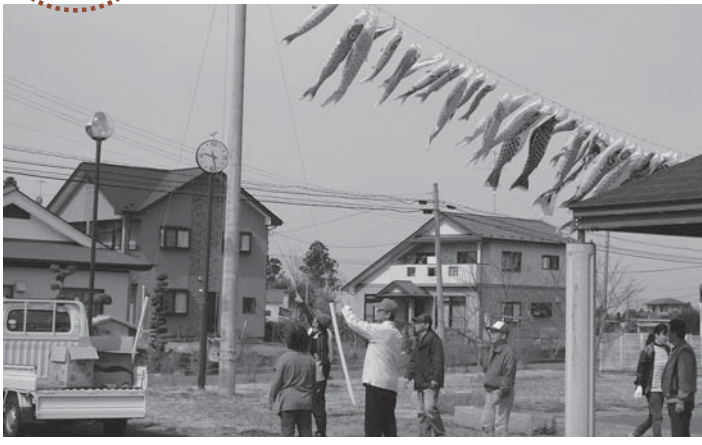
▲20年目を迎え、すっかり季節の風物詩となった浅水のこいのぼり