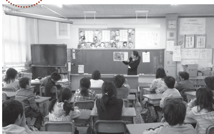
▲週に1度行われる本の「読み聞かせ」。子どもたちも楽しみにしています