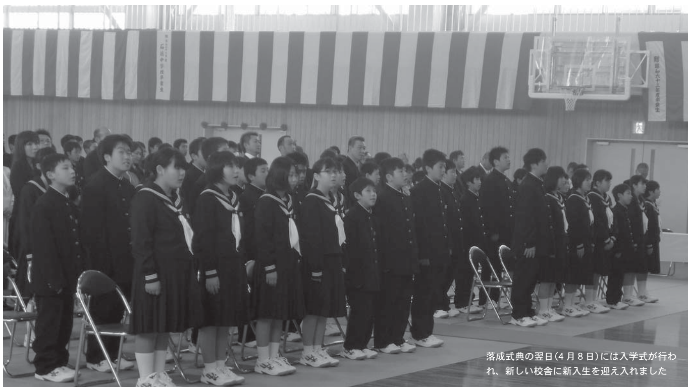
落成式典の翌日(4月8日)には入学式が行われ、新しい校舎に新入生を迎え入れました