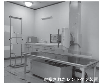
寄贈されたレントゲン装置