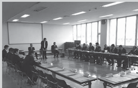
第64回災害対策本部会議(3月26日:市役所)