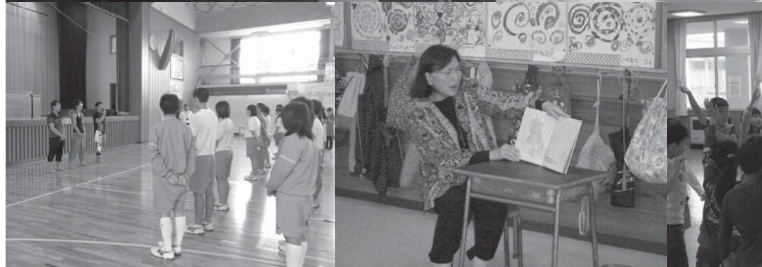
■ボランティア登録状況（平成26年2月28日現在）