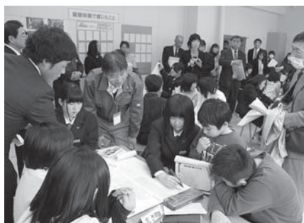
発表会に先立ち、小、中、高生の交流学習も行われました

県教育委員会から平成25年度「みやぎの志(こころざし)教育」推進地区に指定された登米小と登米中、登米高の登