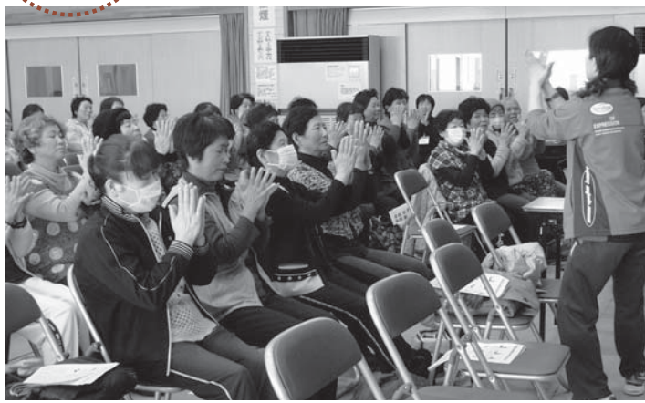
▲自分の健康チェックをする参加者