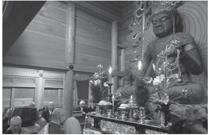
2年ぶりに不動堂に安置された不動明王坐像。復活した姿は、4月25～29日に行われる横山不動尊「慶祝法要、春季大祭典」でも披露されます

東日本大震災で損傷した津山町の横山不動尊「不動明王座像」が京都での修復を終え、2年ぶりに帰郷しました。