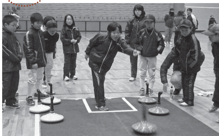
▲ユニカールに挑戦。子どもたちはすぐに上達しました

津山地区少年少女ニュースポーツ教室が2月14日、津山若者総合体育館で開催されました。 教室は、児童の健康増進とニュースポーツの普及などが目的。当日は42人が参加しました。 今回の教室ではソフトバレーボールと、カーペットの上でストーンを滑らせ円形の目標地点に近づけるユニカールの2種目を体験しました。初めて体験する競技に最初は戸惑っていた子どもたちでしたが、指導を受けるとすぐに上達。気軽に楽しめるニュースポーツの面白さにはまっていました。