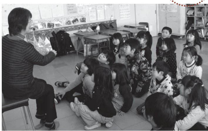
▲絵本の世界によろこそ、今日のお話は何か

学校支援ボランティアによる絵本の読み聞かせが2月13日、南方小学校で行われました。読み聞かせは学校と地域をつなぐ「学校・地域教育力向上対策事業」の一環として実施。本の楽しさを伝えるために小学校低学年を中心に行われ、今回で19回目になります。