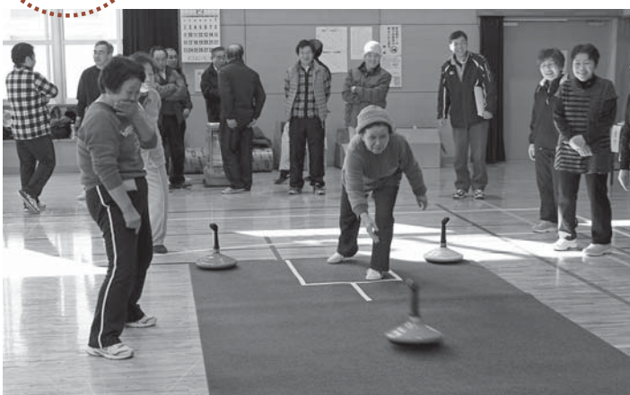
▲サークルの中心を狙って、ストーンを投げる選手たち