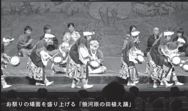
お祭りの場面を盛り上げる「狼河原の田植え踊」