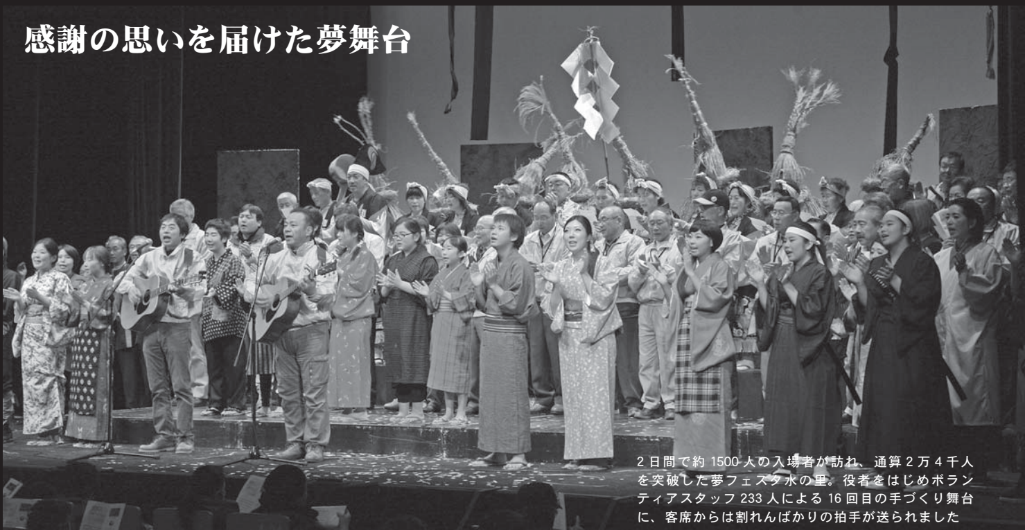
2日間で約1500人の入場者が訪れ、通算2万4千人を突破した夢フェスタ水の里。役者をはじめボランティアスタッフ233人による16回目の手づくり舞台に、客席からは割れんばかりの拍手が送られました