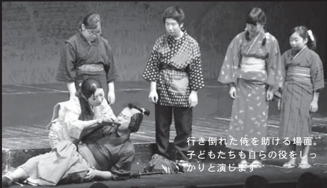
行き倒れた侍を助ける場面。子どもたちも自らの役をしっかりと演じます