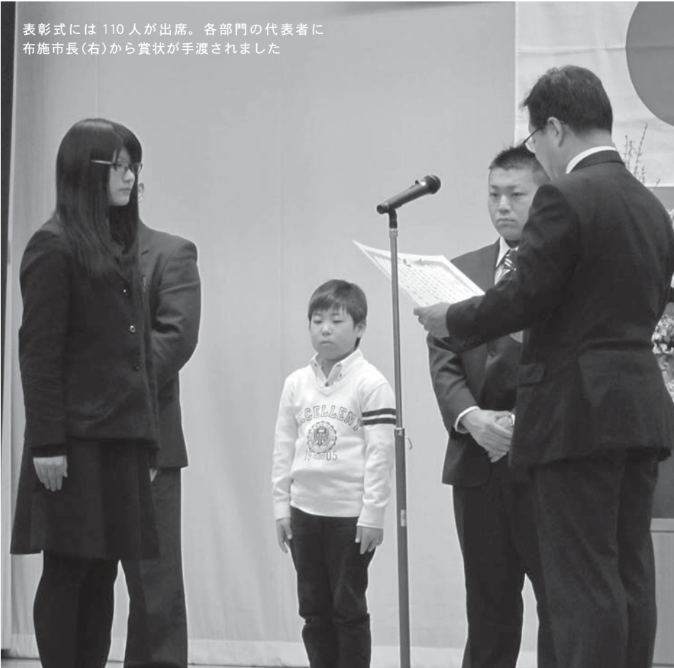
表彰式には110人が出席。各部門の代表者に布施市長(右)から賞状が手渡されました

文化・スポーツの分野で優秀な成績を収めた個人・団体などを表彰する「平成25年度市文化・スポーツ賞表彰式」が、3月9日(日)に中田農村環境改善センターで行われました。本年度は、文化・スポーツの4部門で145人、26団体が受賞し、部門ごとに布施孝尚市長から表彰状と記念品が贈られました。