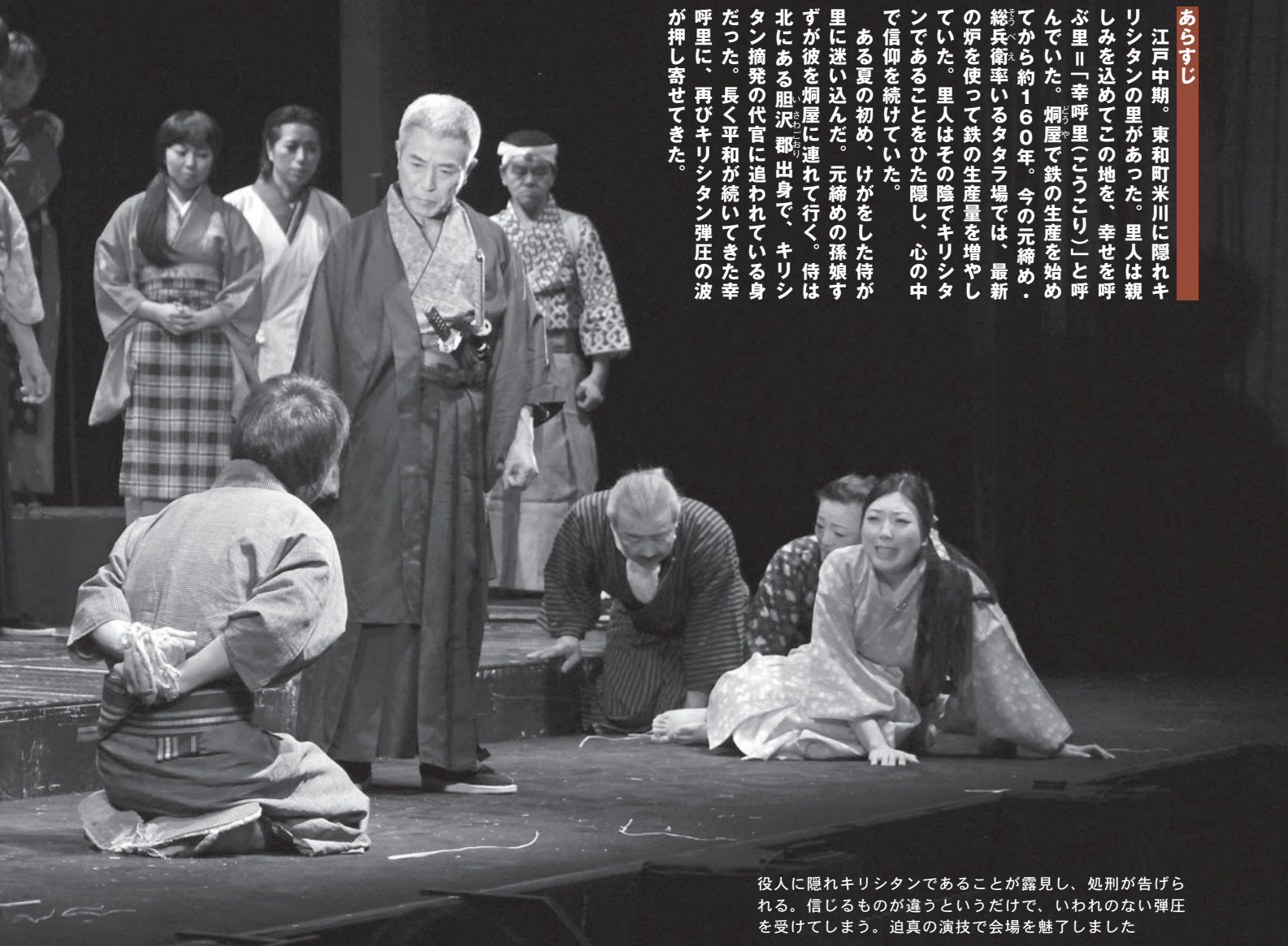
役人に隠れキリシタンであることが露見し、処刑が告げられる。信じるものが違うというだけで、いわれのない弾圧を受けてしまう。迫真の演技で会場を魅了しました

ある夏の初め、けがをした侍が里に迷い込んだ。元締めの子孫娘が彼を焔屋に連れて行く。侍は北にある胆沢郡出身で、キリシタン摘発の代官に追われている身だった。長く平和が続いてきた幸呼里に、再びキリシタン弾圧の波が押し寄せてきた。