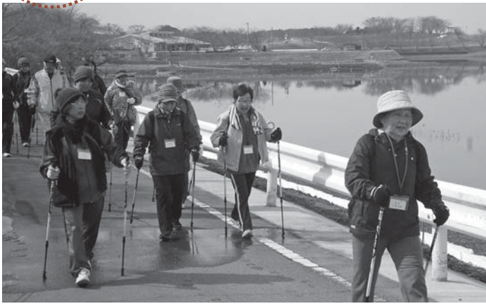
▲自然と背筋が伸び、いつもと違う景色を楽しみました