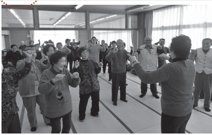
▲バランスのとれた食生活や認知症予防運動について学びました