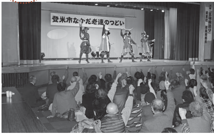
▲特別出演の伊達武将隊から元気もらいました