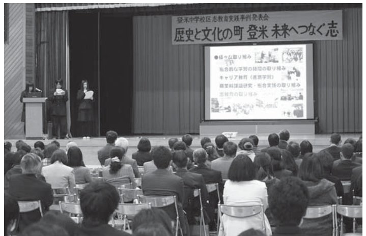
大勢の参加者が見守る中、「インターンシップへの取り組み」を発表する登米高の生徒