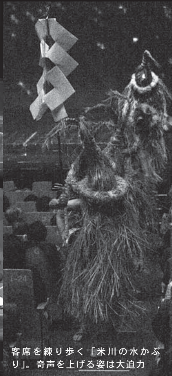
客席を練り歩く「米川の水かぶり」。奇声を上げる姿は大迫力