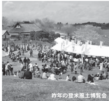
昨年の登米風土博覧会

地域の「食」の充実・掘り起こしをテーマに、春キャンペーン期間中の本市最大のイベントとして4月26日(土)・27日(日)の2日間、長沼フーピア公園を会場に開催します。