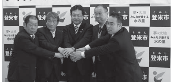
協定書に署名後、がっちり握手を交わす布施市長(中央)と四つの道の駅代表者