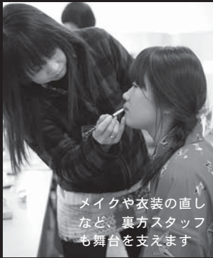
メイクや衣装の直しなど、裏方スタッフも舞台を支えます