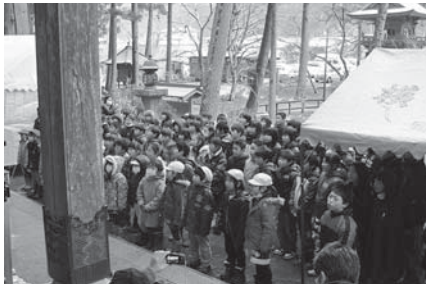
校歌に横山不動尊にちなんだ歌詞が使われている横山小の児童たちも開眼式に出席。帰郷を祝いました

東日本大震災で損傷した津山町の横山不動尊「不動明王座像」が京都での修復を終え、2年ぶりに帰郷しました。