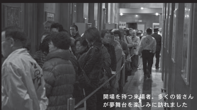
開場を待つ来場者。多くの皆さんが夢舞台を楽しみに訪れました