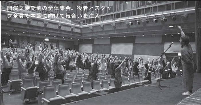
開演2時間前の全体集会。役者とスタッフ全員で本番に向けて気合いを注入