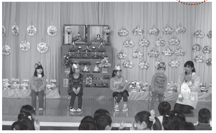
▲笑顔いっぱい。とっても楽しいひなまつり誕生会になりました。