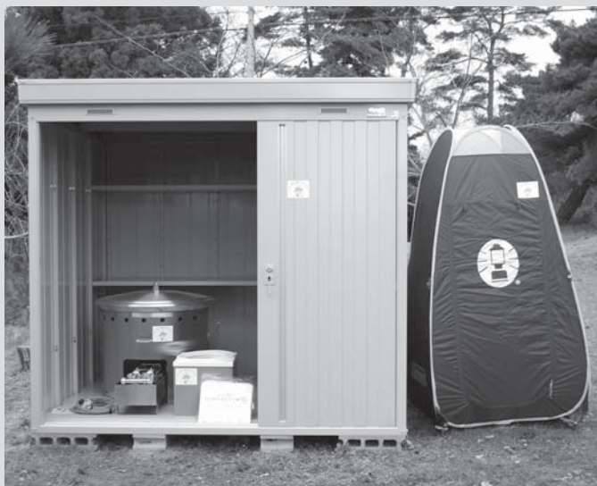
▲各地区に整備された防災用品(写真は北方地区)