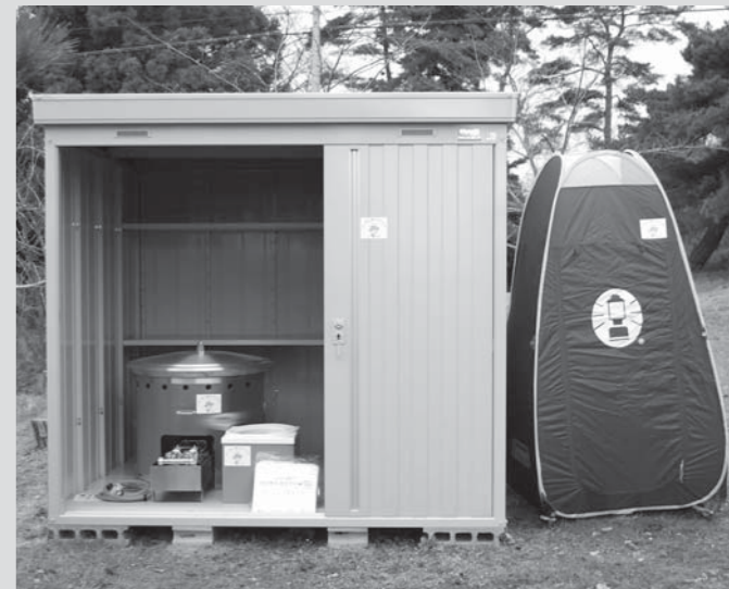
▲各地区に整備された防災用品（写真は北方地区）