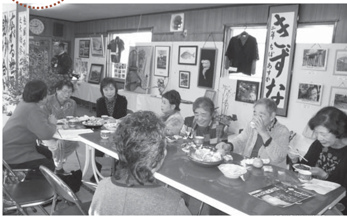
▲さまざまな手作り作品に囲まれ、集まった人たちの会話も弾みます