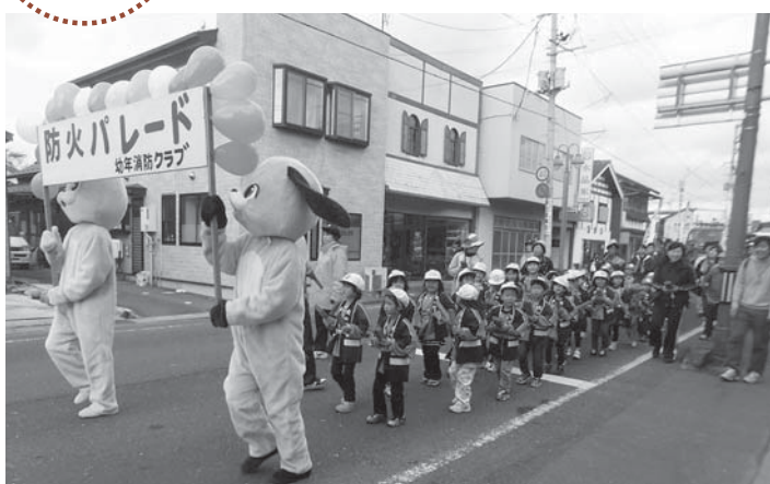
▲おそろいの法被姿で行進しながら火災予防を呼び掛ける子どもたち

その後、つやま幼稚園保護者会や婦人防火クラブ員らと一緒に、柳津小からつやま幼稚園まで約1キロの区間を行進。拍子木を打ちながら「火の用心、マッチ一本火事のもと。たき火の始末しつかり」と大きな声で沿道の人たちに火災予防を呼び掛けました。