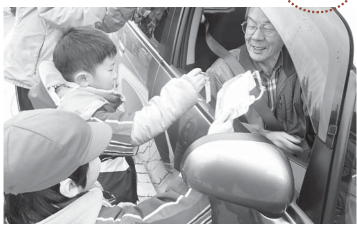
▲「交通安全」や「火の用心」と書かれた短冊と折り鶴を渡す園児たち