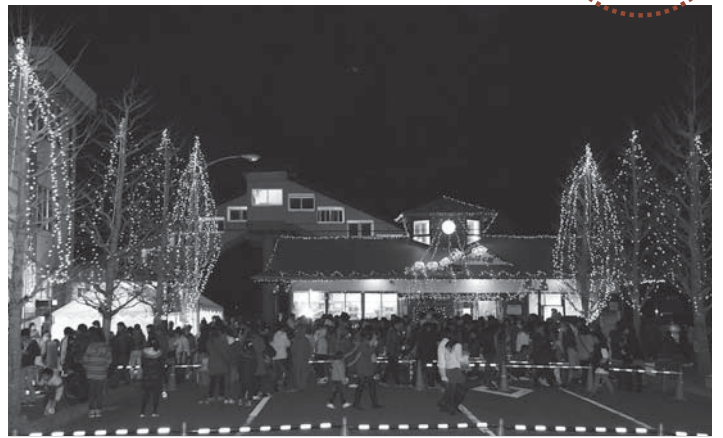
▲冬の風物詩になった駅前を飾る色とりどりのイルミネーション