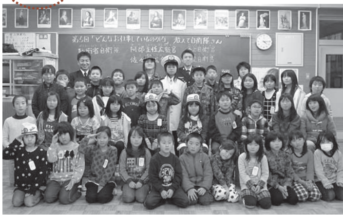
▲教室終了後、隊員の皆さんと記念撮影