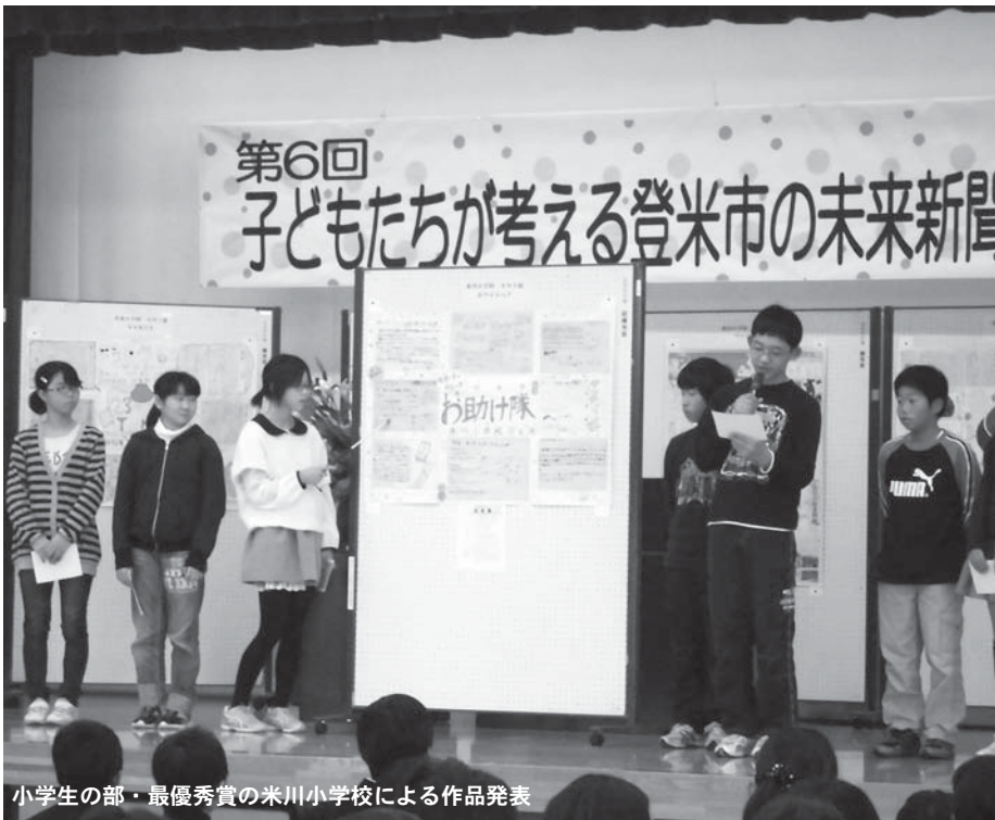
小学生の部・最優秀賞の米川小学校による作品発表

で未来の登米市をテーマにした壁新聞を作成、その制作過程で自分たちが生まれ育った登米市の魅力を再発見しながら、地域を愛する心を養うことが目的です。本年度は小学生の部7校40作品、中学生の