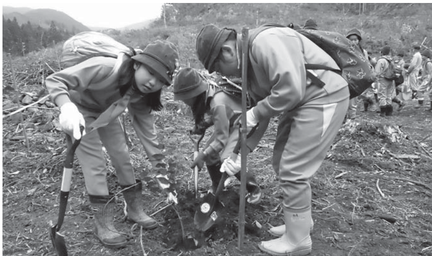
米川小みどりの少年団が毎年実施している植樹作業。こうした長年の取り組みが評価されました

米川小学校の5・6年生で組織する米川小みどりの少年団が、平成25年度緑の少年団活動発表大会(国土緑化推進機構など主催)で優良賞を受賞しました。 昭和59年4月に結成し、今年30周年を迎えた米川小みどりの少年団。今回の受賞は、結成当時から市(町)や県、地