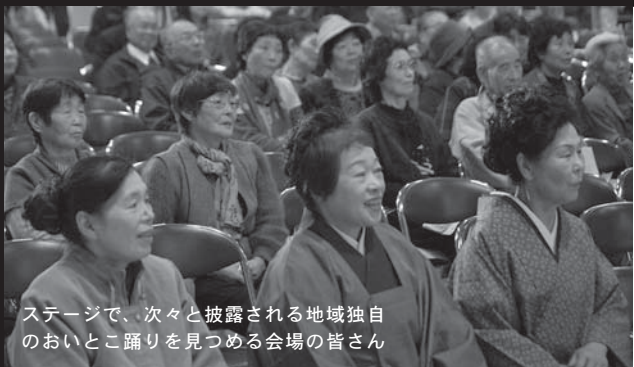
ステージで、次々と披露される地域独自のなおいとこ踊りを見つめる会場の皆さん