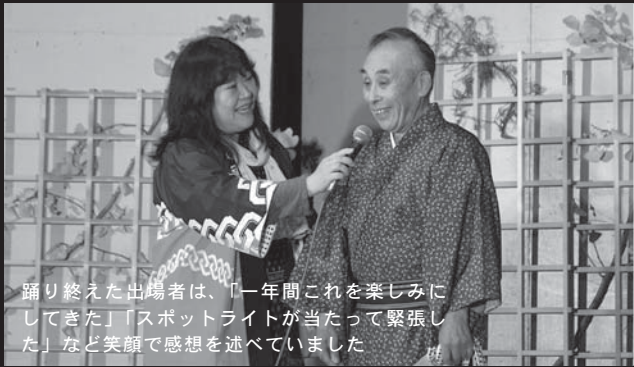
踊り終えた出場者は、「一年間これを楽しみにしてきた」「スポットライトが当たって緊張した」など笑顔で感想を述べていました