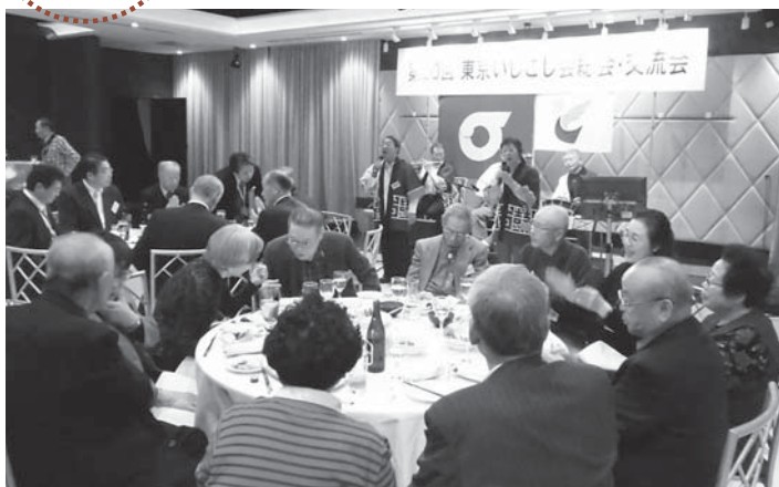
▲歌や踊りにでぎわうステージを楽しむ会員の皆さん