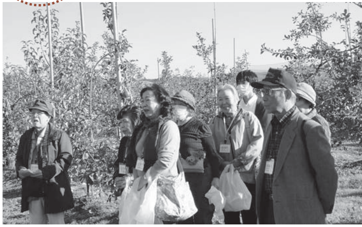
▲ふるさとのリンゴと楽しい思い出を両手いっぱい持ち帰りました