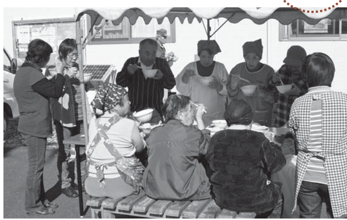
▲みんなで作った郷土料理「はっと汁」に舌鼓。互いの会話も弾みます

交流会には約140人が参加。東郷地区に伝わる大嶽丸の伝説や南三陸町の地域文化を互いに紹介したり、双方の女性陣が作った「はっと汁」を食べたりと、心もおなかも満足する一日となりました。