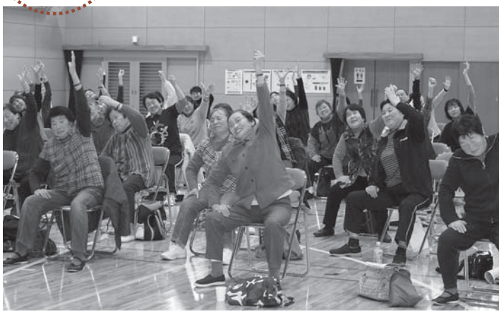
▲椅子に座ってできる運動をする参加者。体を伸ばして心もスッキリ