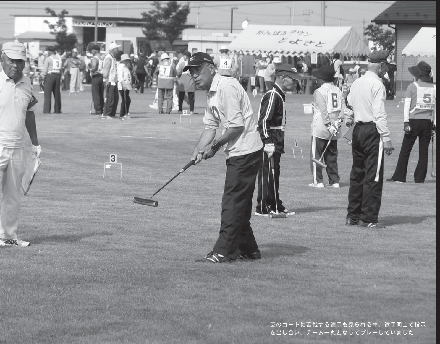
芝のコートに苦戦する選手も見られる中、選手同士で指示を出し合い、チーム一丸となってプレーしていました