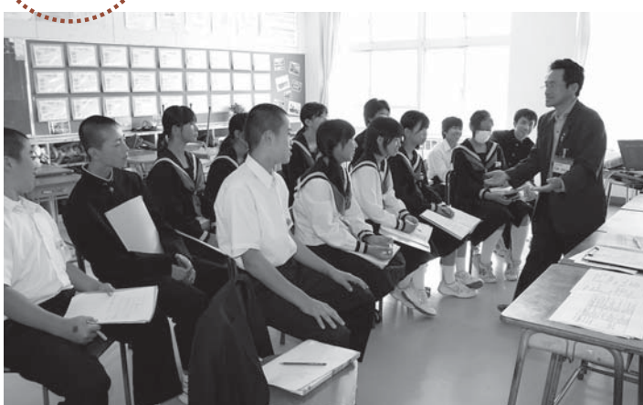
▲講師の話を真剣に聞く生徒たち