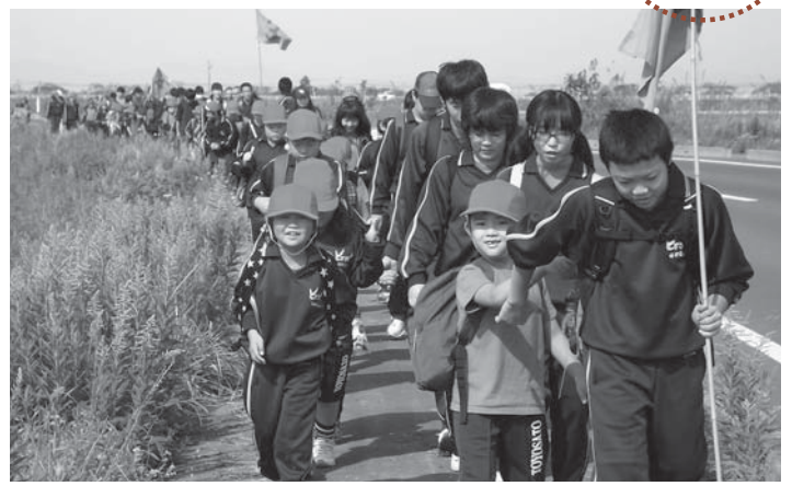
▲お兄ちゃん、お姉ちゃんたちと一緒に目的地を目指します