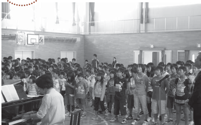
▲記念朝会で元気に校歌を斉唱する児童たち