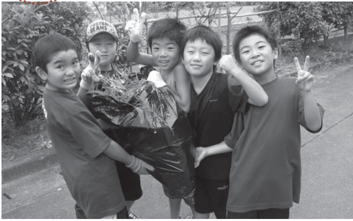
▲みんなで協力して除草作業。ゴミ袋いっぱいになりました