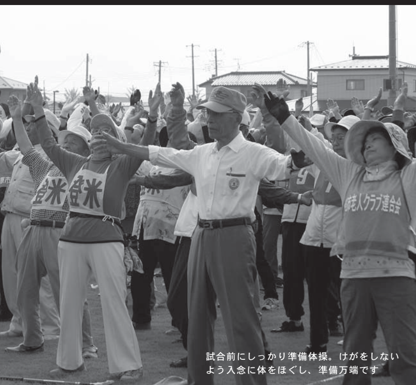
試合前にしっかり準備体操。けがをしないよう入念に体をほぐし、準備万端です