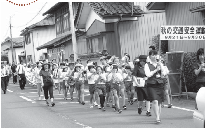
▲秋風が強く吹く中、最後まで元気いっぱい行進しました