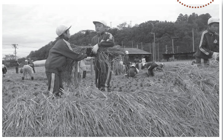
▲みんなで稲刈り。5月に植えた苗は立派な稲に成長しました