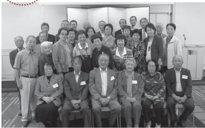
▲参加者での記念撮影。改めてふるさとへの思いを強くしました