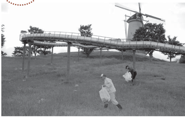
▲長沼周辺のごみを拾う長沼漁協の組合員