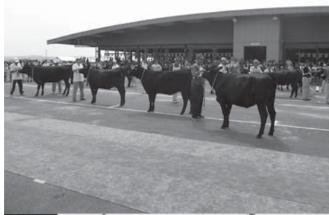
県内から89頭の牛が出品された県畜産共進会(みやぎ総合家畜市場)