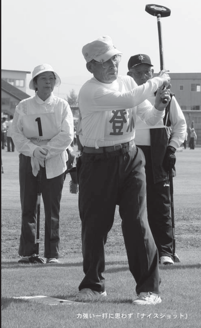
力強い一打に思わず「ナイスショット」