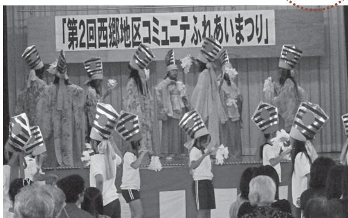
▲子、孫へ代々受け継がれてきた畑岡神楽