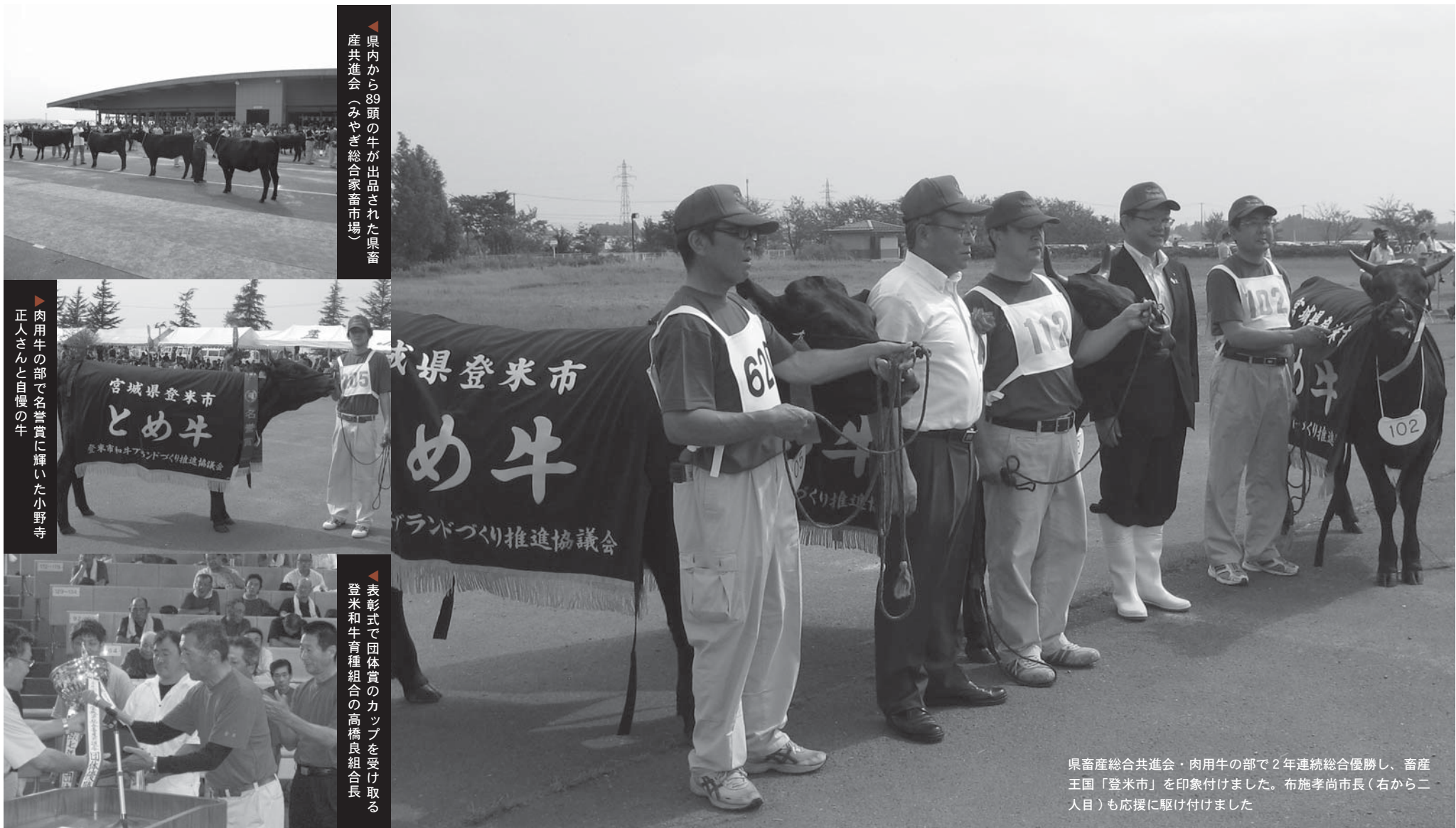
▲県内から89頭の牛が出品された県畜産共進会（みやぎ総合家畜市場）