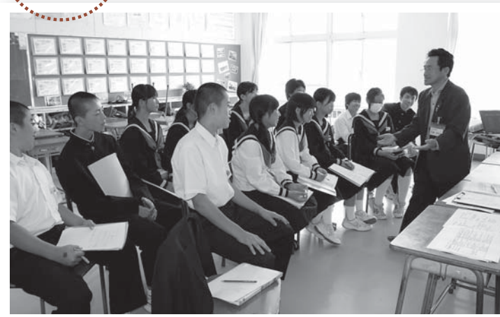
▲講師の話を真剣に聞く生徒たち