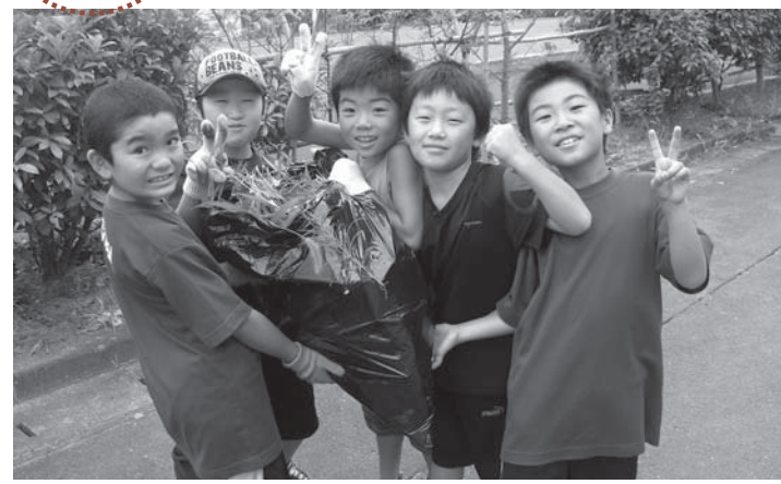
▲みんなで協力して除草作業。ごみ袋いっぱいになりました