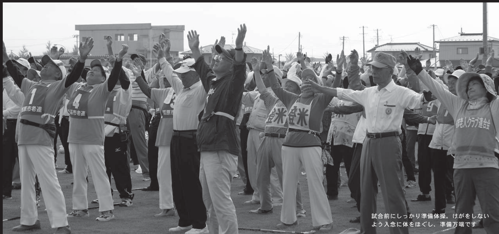
試合前にしっかり準備体操。けがをしないよう入念に体をほぐし、準備万端です