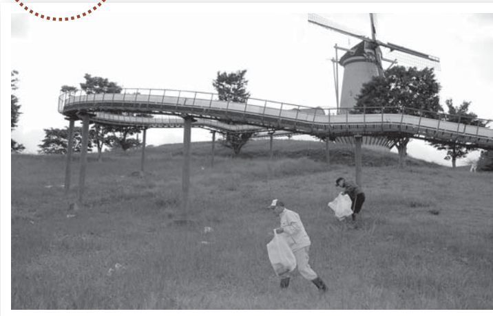
▲長沼周辺のごみを拾う長沼漁協の組合員