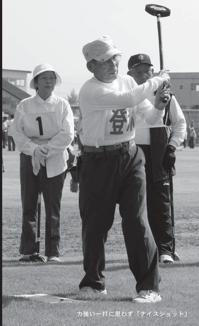
力強い一打に思わず「ナイスショット」