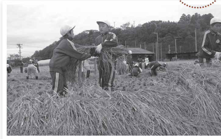
▲みんなで稲刈り。5月に植えた苗は立派な稲に成長しました