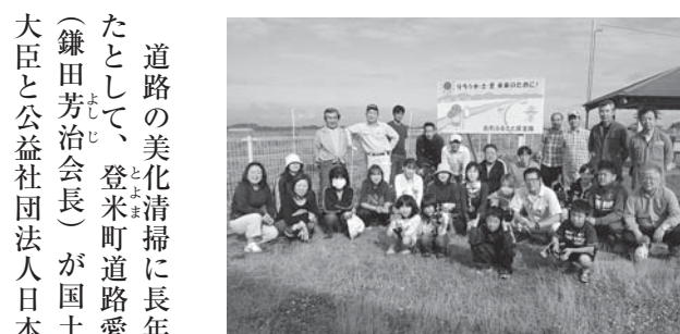
沿道にひまわりを植えていく「ひまわりロード作戦」を実施した南町昭和会

大会には、51歳から79歳までの県内の卓球愛好者、男女合わせて36チーム116人が参加。各コートで熱戦が繰り広げられました。競技の結果、男子団体では仙台ベテラン会（仙台市）が、女子団体では仙台女子会（同）がそれぞれ優勝し、市長杯を手に入れました。