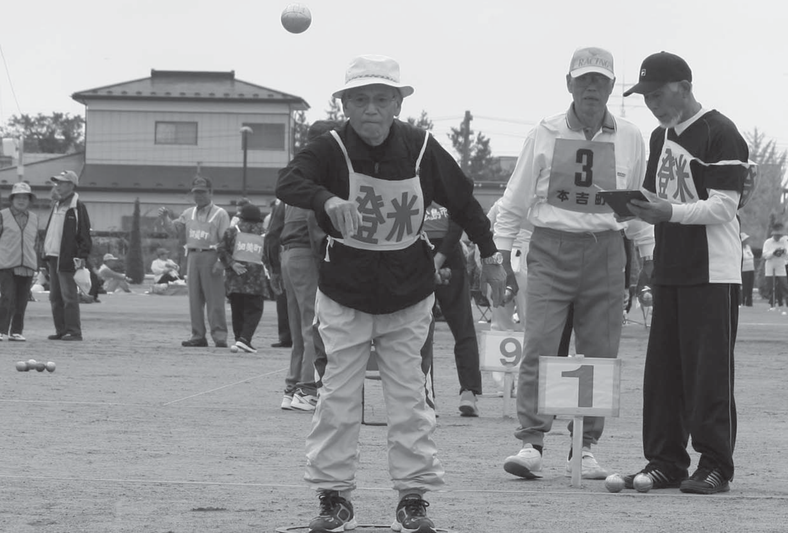
32チーム、118人が参加したベタンク競技。小さいビュット（目標球）にプール（金属球）を投げ合い、相手より近づけることで得点を競います