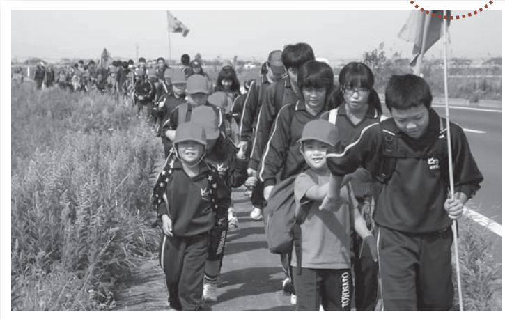
▲お兄ちゃん、お姉ちゃんたちと一緒に目的地を目指します