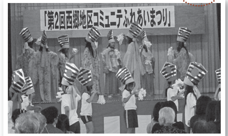
▲子、孫へ代々受け継がれてきた畑岡神楽