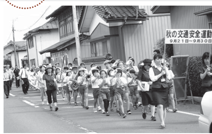
▲秋風が強く吹く中、最後まで元気いっぱい行進しました