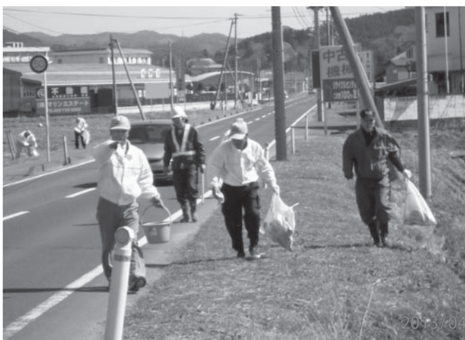
登米町道路愛護会による清掃作業