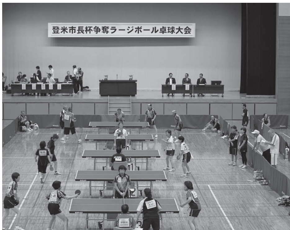
各コートで年齢を感じさせないはつらつとしたプレーが繰り広げられました

第1回登米市長杯争奪ラージボール卓球大会（市体育協会主催）が9月21日、中田総合体育館で行われました。開催の契機となったのは昨年10月、宮城で開かれた第25回全国健康福祉祭（ねんりんピック）。ラージボール卓球競技を当市で実施したことから、市長杯として開催しました。