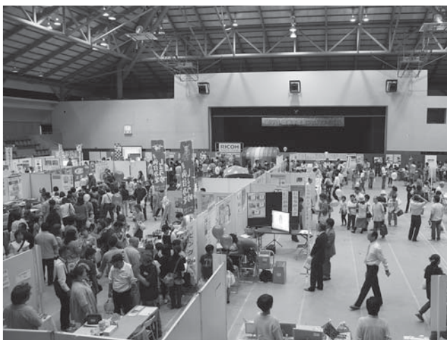
メイン会場の迫体育館には、見て触れて、体験できる35のブースが設置。多くの人でにぎわいました