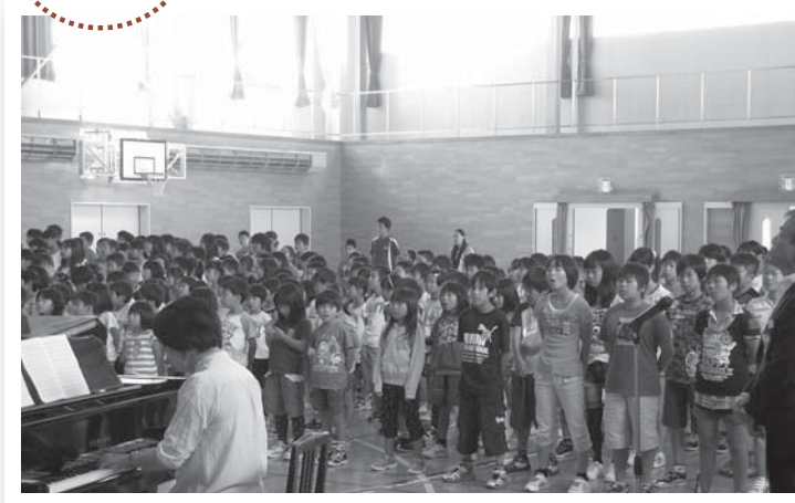
▲記念朝会で元気に校歌を斉唱する児童たち