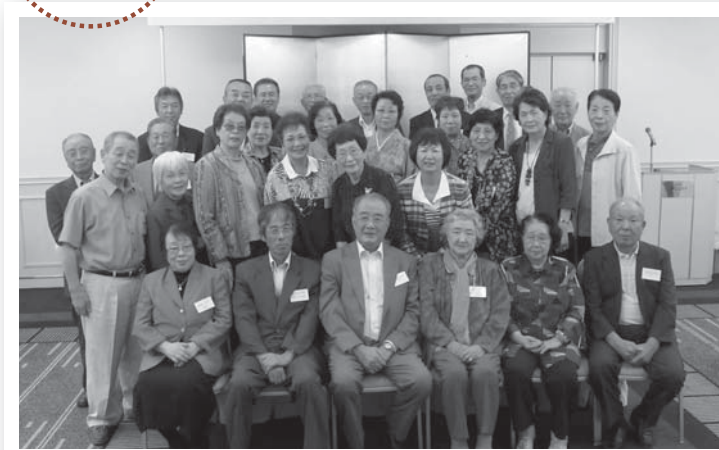
▲参加者での記念撮影。改めてふるさとへの思いを強くしました