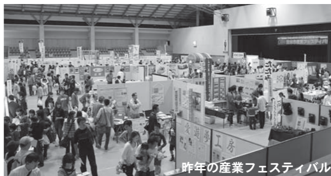
昨年の産業フェスティバル

市内には、モノづくり産業として、食品加工や木材加工、電子部品や金属製品、自動車部品など多くの業種があります。その多様なモノづくり産業や企業を紹介するとともに、市民との触れ合いの場を提供するため「登米市産業フェスティバル」を開催します。 当日は、皆さんの身近にあるモノから最先端のモノまで、多数の生産品や加工品の展示・販売を行います。自走型ロボットの実演やコピーの実験、木工教室などイベントが盛りだくさんです。ぜひご来場ください。