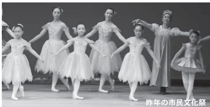
昨年の市民文化祭

市民文化協会では10月5、6日の2日間、登米祝祭劇場で第7回登米市民文化祭「ステージ発表の部」を開催します。