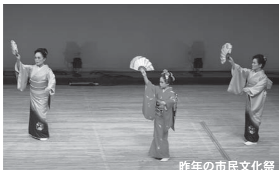
昨年の市民文化祭

この催しは、春に行われた『展示発表の部』に引き続いて開催されるものです。市内の文化協会会員および児童生徒による太鼓、舞踊、吹奏楽などのステージ発表を行います。ご近所お誘い合わせの上、ご来場ください。 【日時】10月5日(土)・6日(日) 2日間とも午前10時開演(開場午前9時30分) 【場所】登米祝祭劇場(大ホール) 【入場料】1000円(1枚の入場券で2日間もしくは2名入場できます。) ※高校生以下無料 【入場券】入場券は、各町文化協会事務局および登米祝祭劇場で取り扱っています。