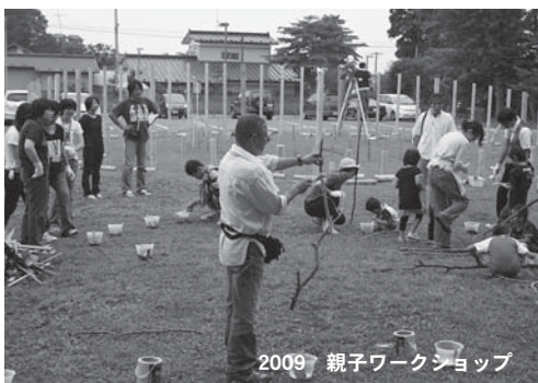
2009 親子ワークショップ