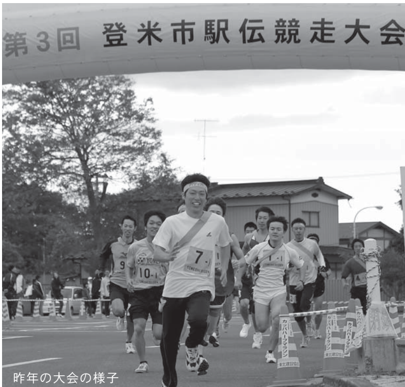
昨年の大会の様子

広く市民がスポーツに親しみ、健康の維持や世代を超えた相互の親睦と交流を図ることを目的に、「第4回登米市駅伝競走大会」を開催します。大勢の皆さんの参加をお待ちしています。 【開催日】11月4日(月) 雨天決行 ● 年代混合の部 午前9時15分スタート ● 中学生の部、高校生の部 午前10時30分スタート ● 一般の部 午前11時30分スタート