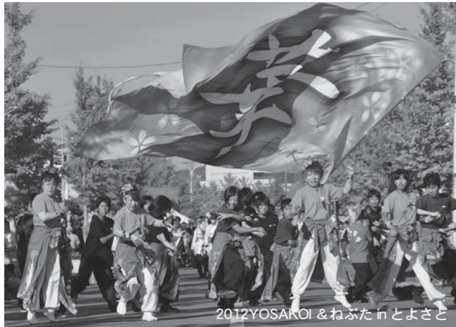
2012YOSAKOI & ねぶた in とよさと