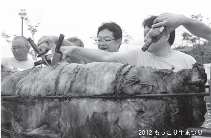
2012 もっこり牛まつり