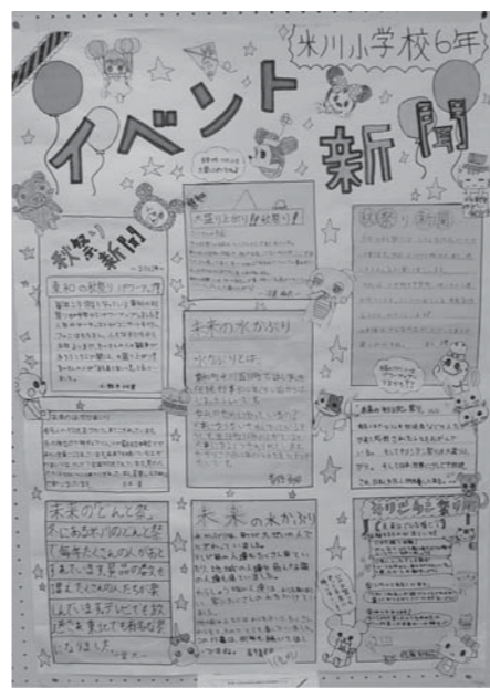
平成24年度の小学生部門で最優秀賞を受賞した米川小学校の未来新聞

【問い合わせ】企画部市民活動支援課（市民協働推進係） ☎0220（22）2173 FAX 0220（22）9164