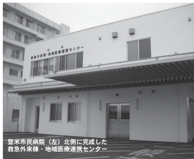
登米市民病院（左）北側に完成した救急外来棟・地域医療連携センター

相談業務を本施設で開始します。また、登米市医師会の事務所が2階地域医療連携センター内に移転するとともに、医療に関わる市民団体の活動の場としても提供します。