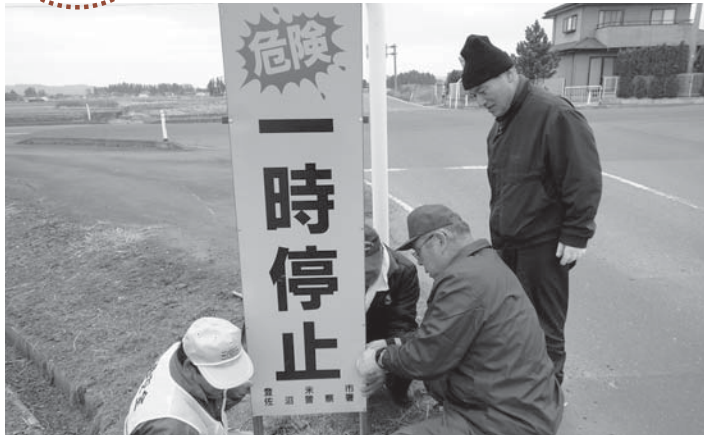
▲交通事故がなくなることを願い、交差点に看板を設置