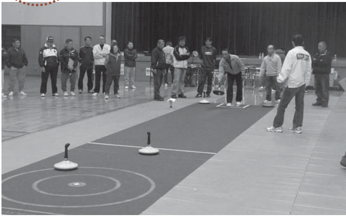
▲目標を定め、慎重にストーンを投じる選手たち