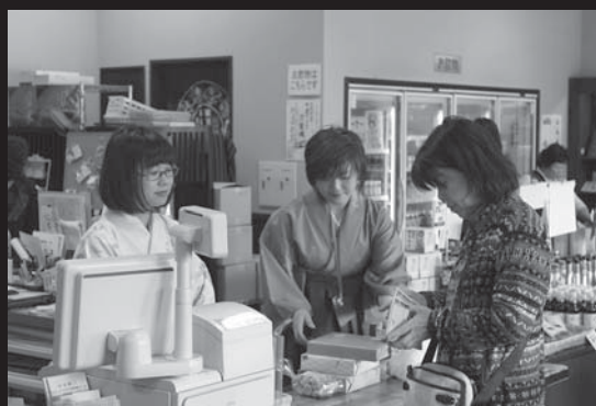
ゴールデンウィーク期間中は登米観光物産センター「遠山之里」の女性スタッフもハイカラさんにならって羽織はかま姿で対応していました