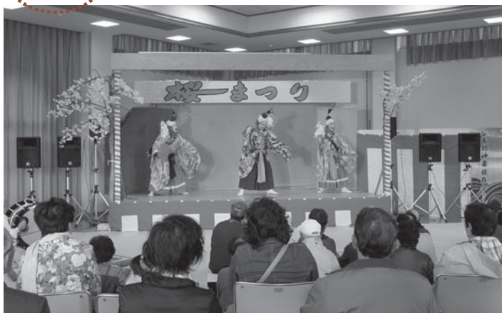
▲会場は常時たくさんの人たちでにぎわいました

「平筒沼ふれあい公園桜まつり」が4月27、28日の2日間、平筒沼ふれあい公園で開催されました。