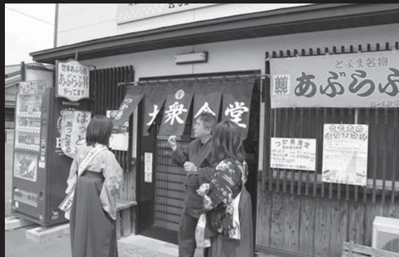
ハイカラさんは地元の人たちにとってもすっかりおなじみ。気軽に声をかけられます