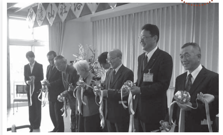
▲地域の代表と利用者代表によるテープカット