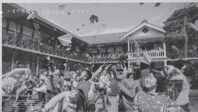
この場所で、待っています。仙台・宮城