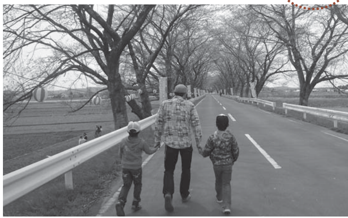
▲初の試みとなる歩行者天国を満喫する来場者

今年、「桜のトンネルを歩きたい」という市民の要望に応え、まつり初日に歩行者天国を実施。低温が続き、桜は五分咲き程度でしたが、堤防ののり面には地元の有志がまいた菜の花が見事な花を咲かせており、訪れた人たちの心を和ませていました。イベント会場では、南方文化協会の皆さんによる歌や踊りが披露され、まつりを盛り上げていました。