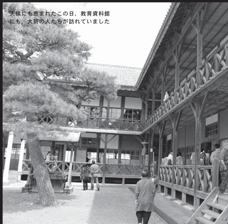
天候にも恵まれたこの日、教育資料館にも、大勢の人たちが訪れていました

仙台・宮城デスティネーションキャンペーン（DC）に合わせ、JR東日本が作製したポスターの中に、登米町を舞台にしたポスターがあります。撮影場所は、国指定重要文化財建造物の教育資料館（旧登米高等尋常小学校）。今年3月14日、冷たい風が吹く中で撮影でしたが、登米小学校の児童たちが教育資料館の前庭や2階から、紙ヒコーキを元気一杯に飛ばしている様子が切り取られています。キャッチコピーは「この場所で、待っています。仙台・宮城」。ポスターは3000枚が作製され、JR東日本や全国の主要なJRの駅に掲示されているほか、迫、中田、南方、登米庁舎などで見ることができます。