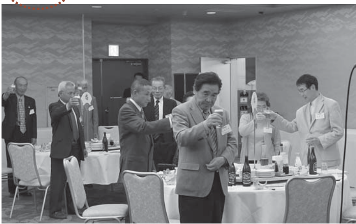
▲ふるさとの東和町を思い親睦を深めました