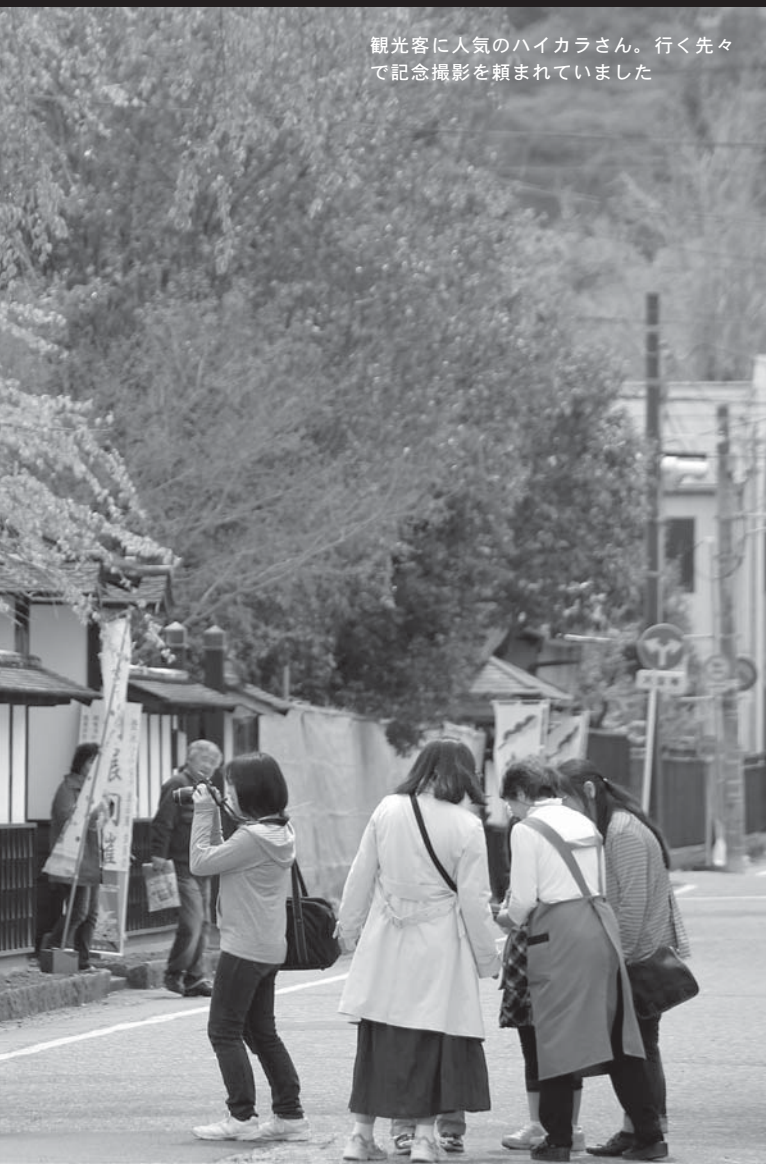
観光客に人気のハイカラさん。行く先々で記念撮影を頼まれていました