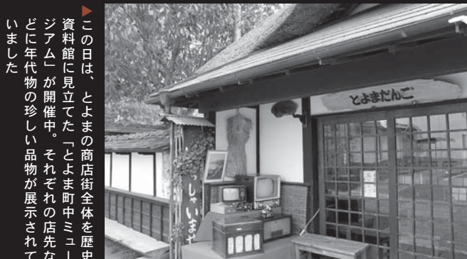
この日は、とよまの商店街全体を歴史資料館に見立てた「とよま町中ミュージアム」が開催中。それぞれの店先などに年代物の珍しい品物が展示されていました