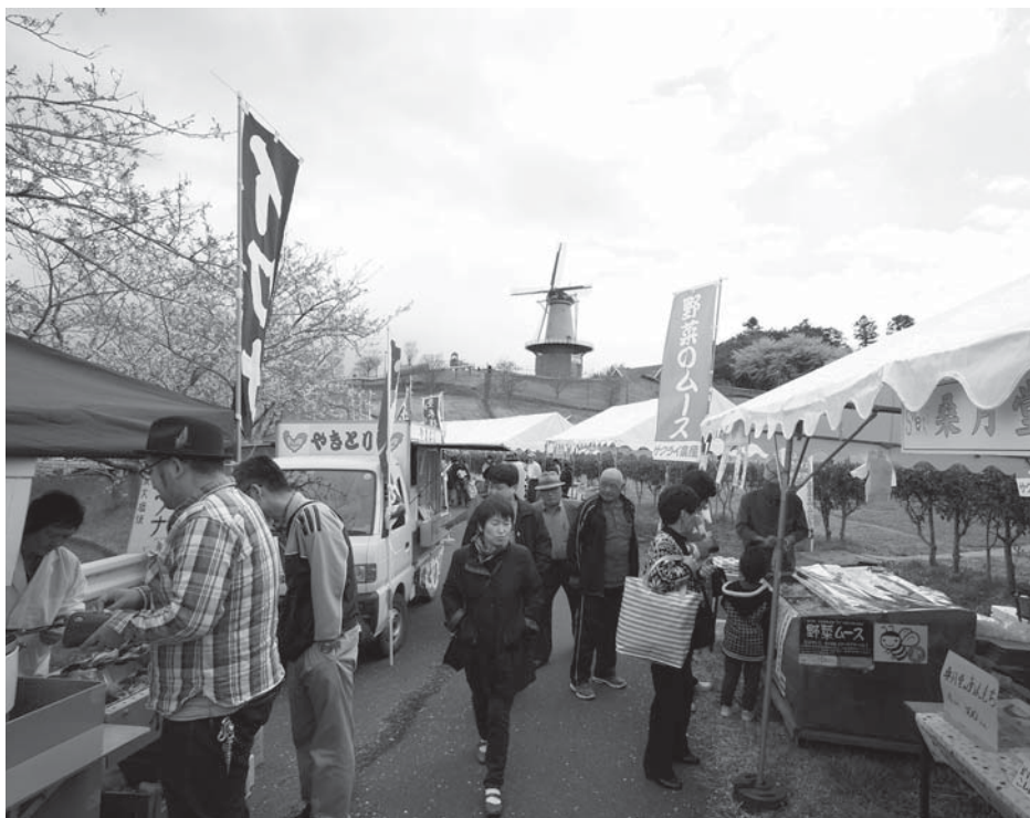
好天にも恵まれ、3日間で約2万人が訪れた登米風土博覧会

登米の「旨い」をあなたが決める3日間。登米市のご当地グルメを集めた食の祭典「登米風土（Food）博覧会」が4月27～29日までの3日間、迫町にある長沼フットピア公園を会場に開催されました。今年4月から6月まで県内で展開される大型観光キャンペーン「仙台・宮城アステイネーション」