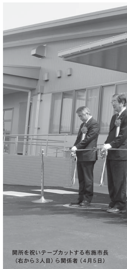
開所を祝いテープカットする布施市長 (右から3人目)ら関係者(4月5日)