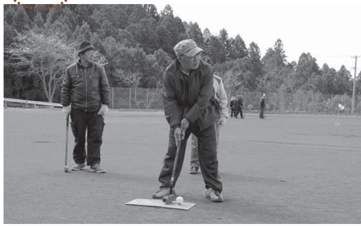
▲和気あいあいとした雰囲気の中、真剣にポールポストを狙う選手たち

好調なスタートを切る選手が多く見られ、ときにはホールインワンも出るなど白熱した大会となりました。