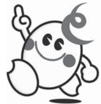
登米市協働キャラクター「とめ丸」

☎ 0220（22）2090 ✉ koho@city.tome.miyagi.jp