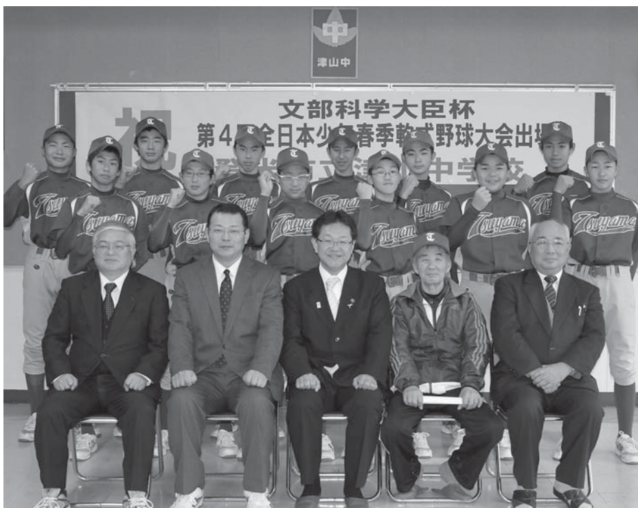
1、2年生合わせて12人の部員数ながら、予選を勝ち抜き全国大会への出場を決めた津山中野球部

昨年秋に開催された、第4回全日本少年春季軟式野球大会東北大会で優勝し全国大会への出場を決めた津山中中学校野球部で、布施孝尚市長への報告会が開催されました。 2月10日に同校で開催された報告会には選手や監督、保護者らが出席。12人の部員一人一人が布施市長に全国大会へ