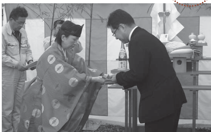
▲登米神社の春日宮司（左）から玉ぐしを受け取る布施市長