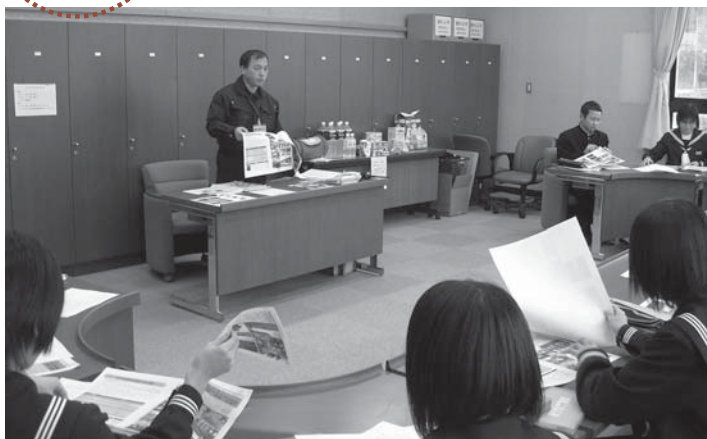
▲市職員の説明を熱心に聞く生徒たち