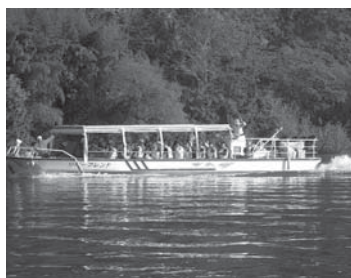
なかなかできない体験です。この機会をお見逃しなく

北上川クルーズを5月5日(日・祝)に行います。登米から乗船し、豊里までの船の旅では、雄大な北上川から新緑の風景を楽しむことができます。