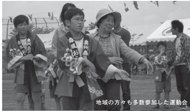
地域の方々も多数参加した運動会