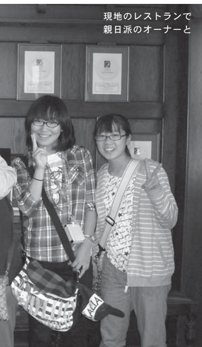
現地のレストランで親日派のオーナーと