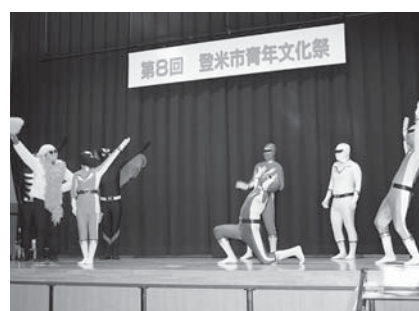
南方町青年会は、ご当地ヒーローの「大嶽戦隊もこレンジャー」で会場を沸かせました

市内で活動する青年会の芸術文化の発表の場として今年8回目を迎える登米市青年文化祭が、2月3日に開催され