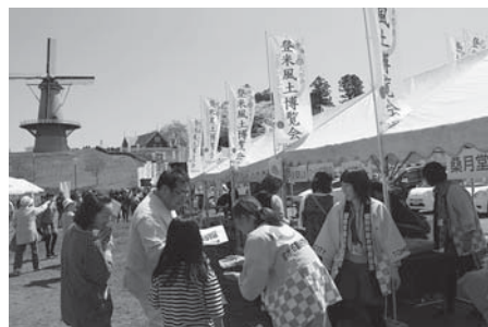
昨年春の登米風土博覧会には約2万人の客が訪れ、たくさんの笑顔でにぎわいました