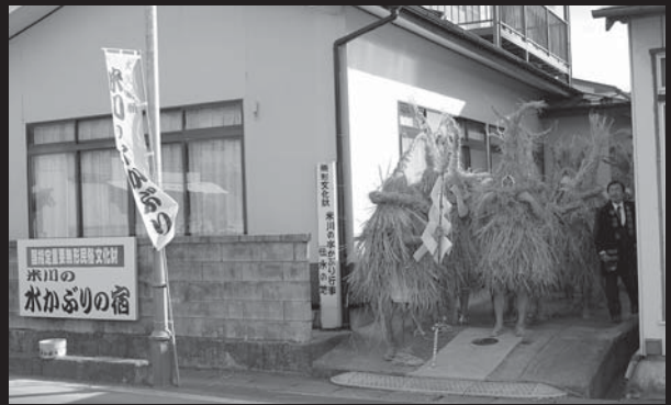
▲身支度を終えた男衆が、開会の花火を合図に「水かぶりの宿」を出発