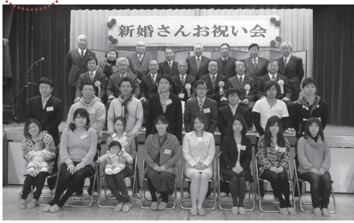
▲新婚さんお祝い会に参加した皆さん