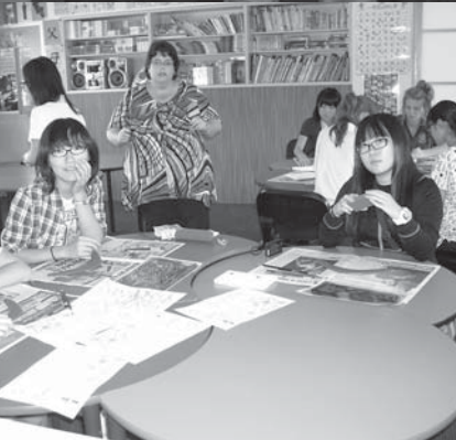
◆ 現地の学生との交流