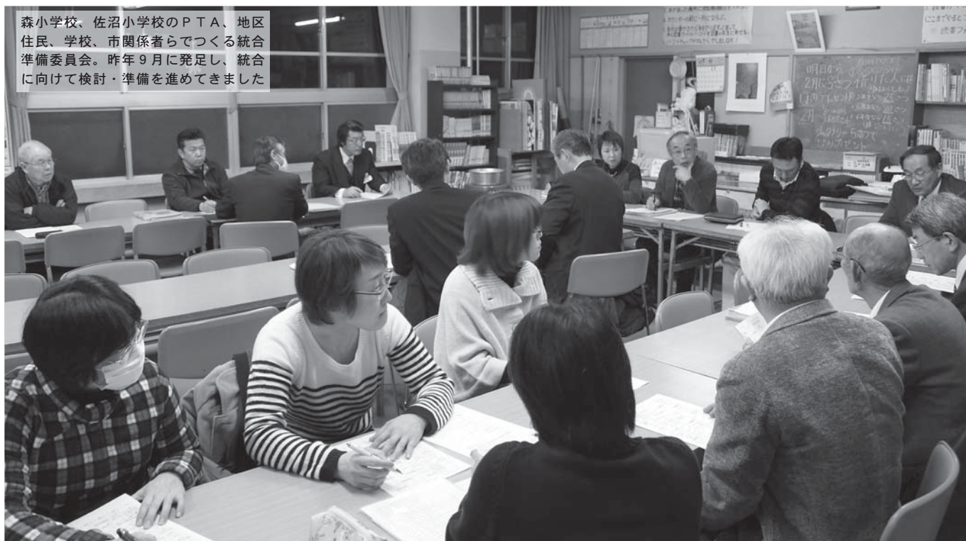
森小学校、佐沼小学校のPTA、地区住民、学校、市関係者らでつくる統合準備委員会。昨年9月に発足し、統合に向けて検討・準備を進めてきました