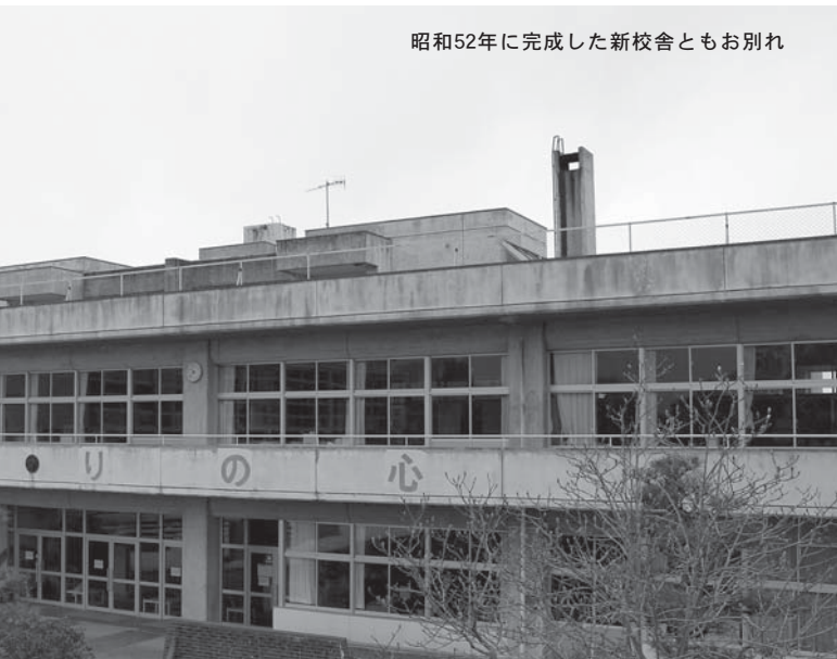
昭和52年に完成した新校舎ともお別れ

迫町にある森小学校が平成25年4月から佐沼小学校と統合します。森地区のコミュニティの拠点であり140年の歴史を重ねてきた同校の閉校を関係者の思いを交えて紹介します。