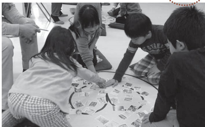
▲かるた遊びを通じて南方町を学ぶ