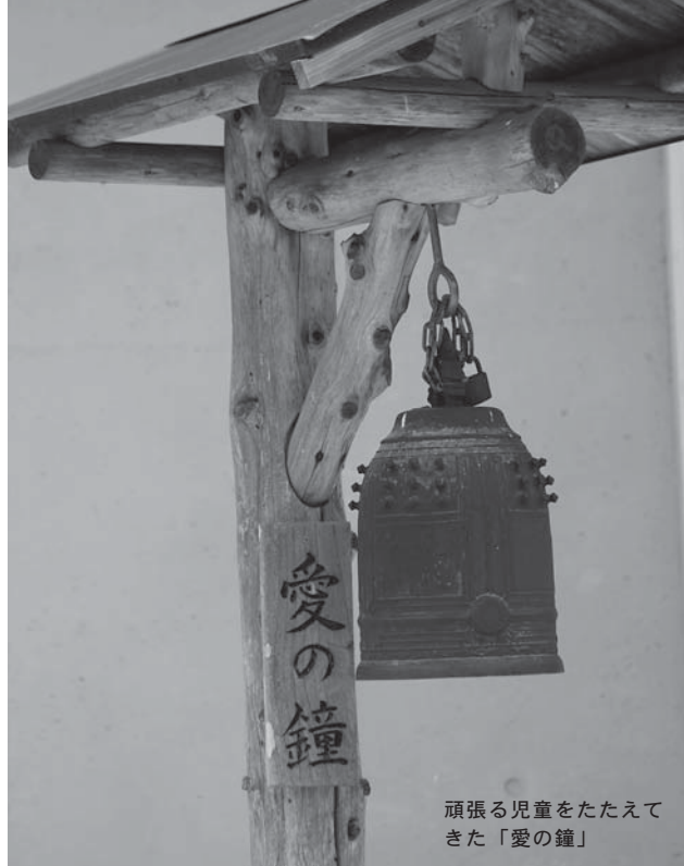
頑張る児童をたたえてきた「愛の鐘」