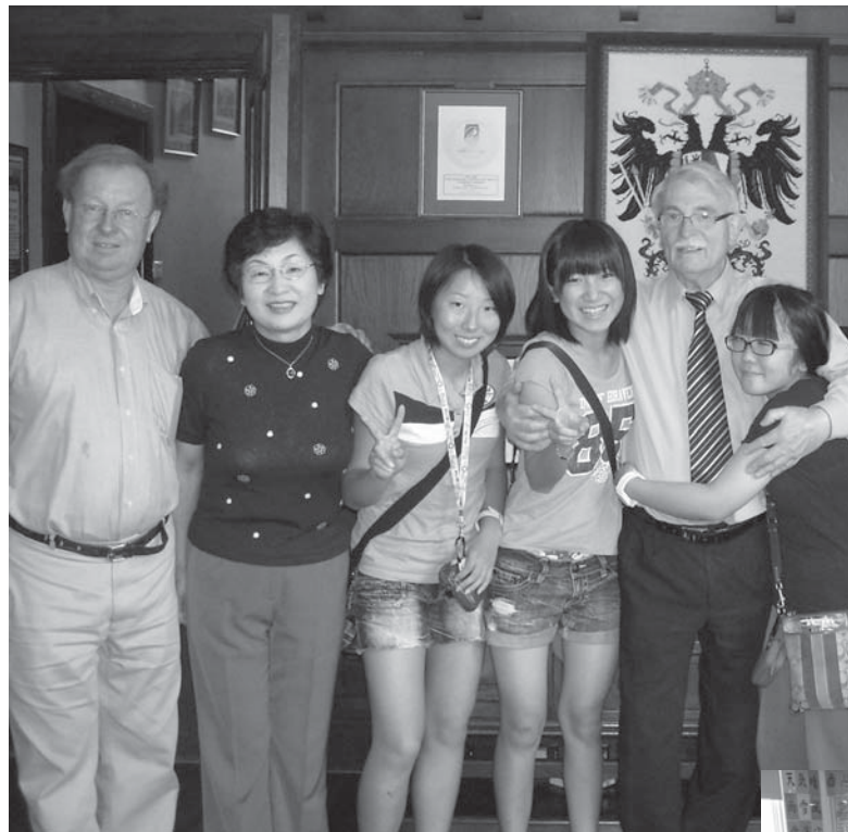
オーストラリア：平成 24 年 10 月 31 日～ 11 月 7 日