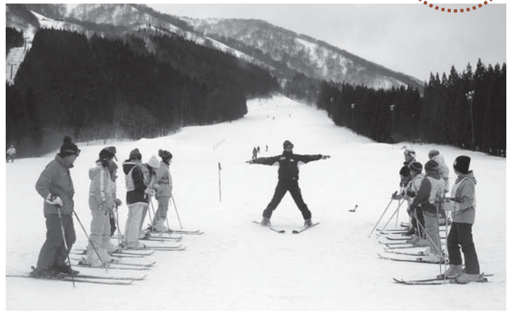
▲指導員の説明を熱心に聞く子供たち

豊里町内で活動するスポーツ少年団員と、ときめきキッズクラブ会員の交流を深めることを目的とした「そり遊び・スキー教室」が2月3日、大崎市鳴子のオニコウベスキー場で開催され、小・中学生とその保護者42人が参加しました。雪が降りしきる中、二つの班に別れ、そり専用の広場で思いっきり遊んだり、インストラクターからスキーの基礎などの指導を受けたりしていました。昼食時には、おいしい料理を囲みながら、そり遊びやスキー教室の話で大いに盛り上がり、終始にぎやかムードで交流を深めていました。