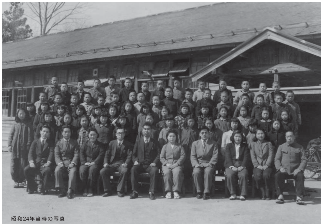
昭和24年当時の写真