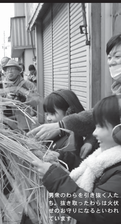
男衆のわらを引き抜く人たち。抜き取ったわらは火伏せのお守りになるといわれています