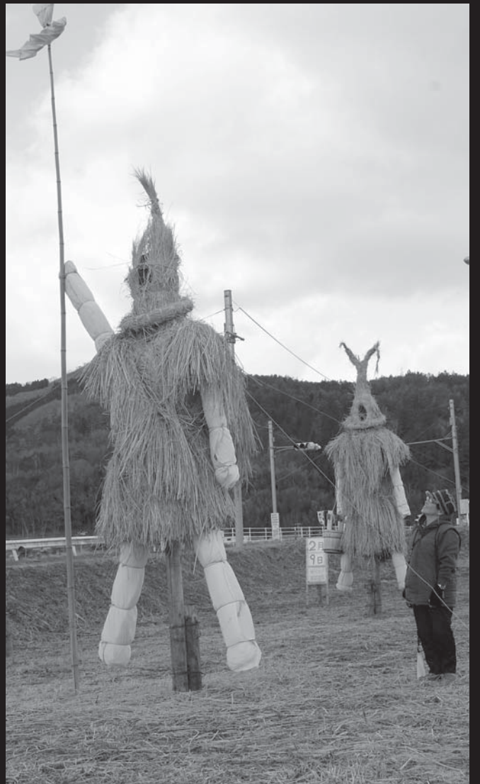
▲東和町米川地区入口の国道346号沿いでは「米川の水かぶり保存会」の会員が設置した、高さ4mの巨大わら人形が祭りをPR