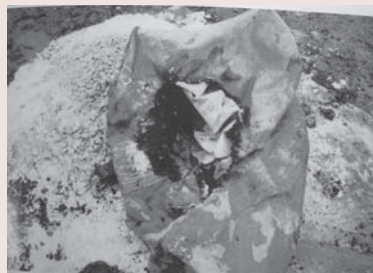
放置していた生石灰に雨水が掛かり発熱し、着火したもの

また、生石灰が水と接触すると、水酸化カルシウムとなり発熱します。このとき、可燃物と接触しているため、この可燃物が発熱によって出火することがあります。