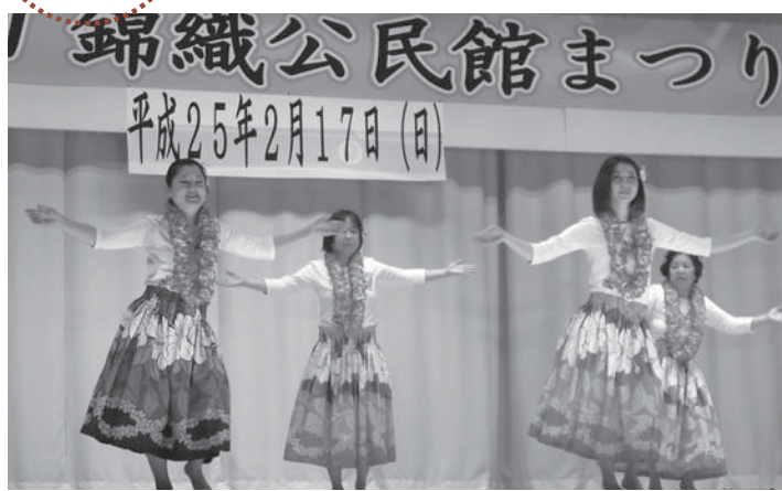
▲錦織フラダンス教室の皆さんによるステージ