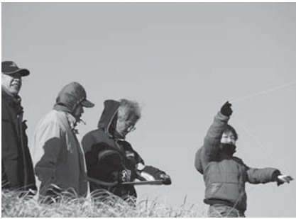
大会では、凧のあがり具合やデザインが審査されました