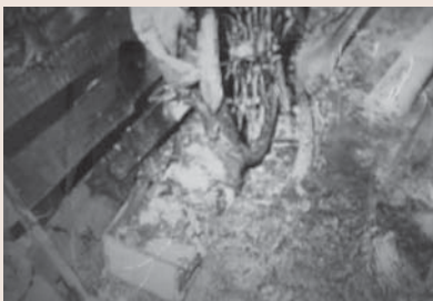
放置していた農薬から出火したもの

たとえば、農薬（ダイアジノン）を木箱に入れ、約一年前から納屋入口の直射日光が入る場所に保管していたため、中に入っていた自然発火性物質のダイアジノンが発火して火災になることがあります。