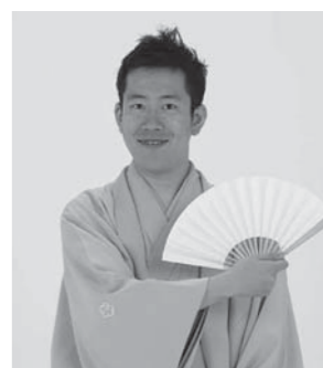
はやしや きくぞう 講師：林家 木久蔵 さん

落語家の林家木久蔵さんをお招きし、「笑い」を通して、人権の大切さについて講演していただきます。 ご家族・お友達お誘い合わせの上、ぜひお越しください。