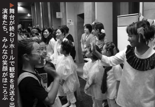
▶ 舞台が終わりホールで観客を見送る出演者たち。みんなの笑顔がほころぶ