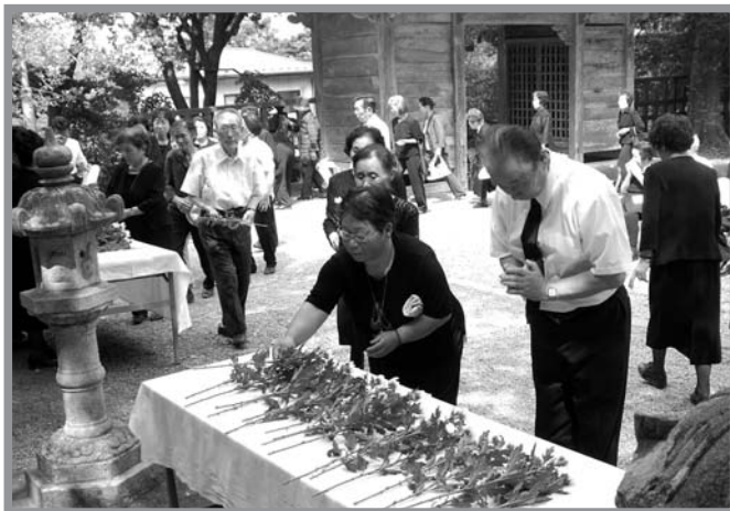
▲献花台に花を手向け、手を合わせる参列者