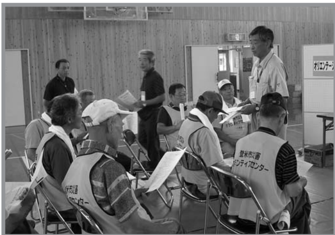
▲災害発生時の対応手順について、熱心に説明を聞いていました