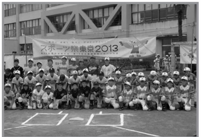
▲交流事業に参加した登米市と東大和市の子どもたち

東和町の少年野球チーム、錦小ホエールズと米谷タイガースの合同チームが8月17日から19日までの3日間、東京の東大和市に招かれ、地元の子どもたちと交流しました。これは、東日本大震災による被災地の子どもたちとスポーツを通じて交流を図ろうと東京都と都体育協会が主催したものです。東和町の子どもたちは、17日に東京に到着し歓迎会の後、東大和市の選手の自宅にホームステイしました。翌日の交流試合では1対4で惜しくも敗れたものの、夏休みの楽しい思い出になりました。