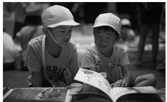
たくさんのお絵本の中からお気に入りの絵本を見つけ、仲良く読む子どもたち

館選定の「よい絵本の展示」150冊が展示されたほか、図書館ボランティアによる「読み聞かせ」も行われました。 会場を訪れた子どもたちは、普段見る機会のない絵本の原画を見たり、展示されている絵本を友達と一緒に読んだりしながら、絵本の世界を楽しんでいました。