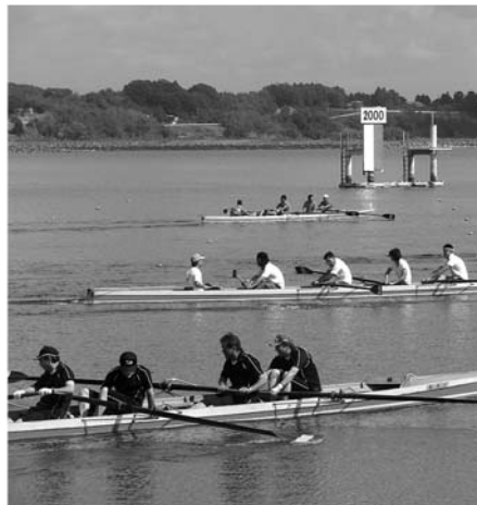
ゴールを目指して熱戦を繰り広げた長沼レガッタ

登米市の秋の訪れを告げる風物詩として定着した、長沼レガッタが9月16日、県長沼ポート場で開催されました。