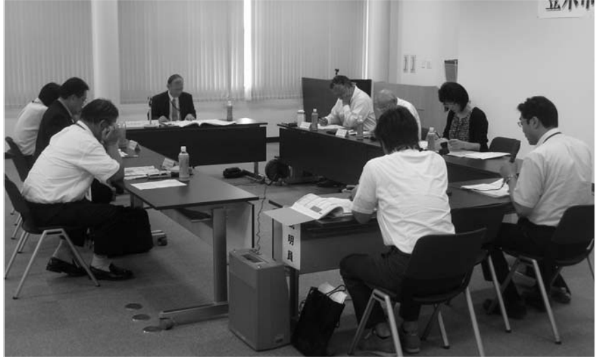
市民の視点で事業を評価し、より良い登米市を目指します

市が取り組んでいる事業について、市民の視点で評価する行政評価の外部評価が8月9、22、29の3日間、市役所庁舎などを会場に開催されました。