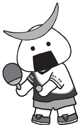
ねんりんピック卓球交流大会のマスコット