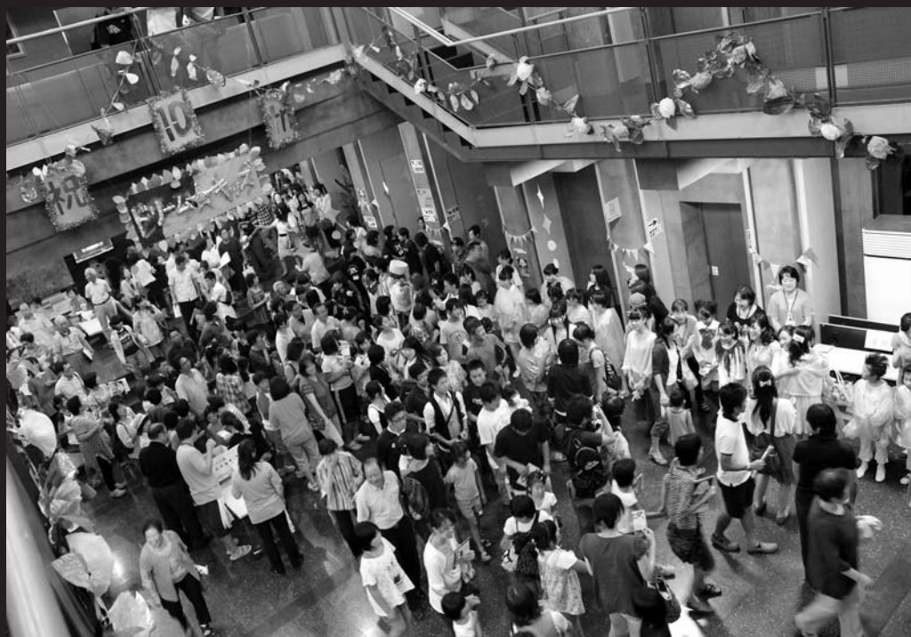
▲ 2日間、大勢の観客が訪れた公演。劇団の10年の歩みは確実に市民に浸透しました

子どもミュージカルの枠を超えた歌、踊り、表現力。10年間の成長を示した見事なステージ