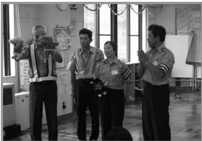
▲人形劇でわかりやすく交通安全を説明する交通安全指導隊