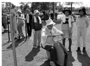
健康教室で遊具を活用し、体力づくりに励む皆さん