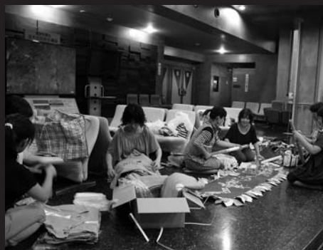
▶ 小道具や衣装を整える団員の保護者ら。公演は多くの人に支えられています