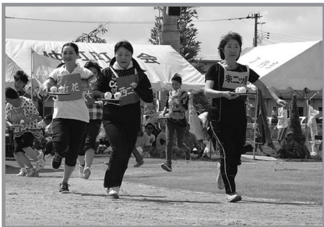
▲秋晴れの下、参加者は心地よい汗を流していました