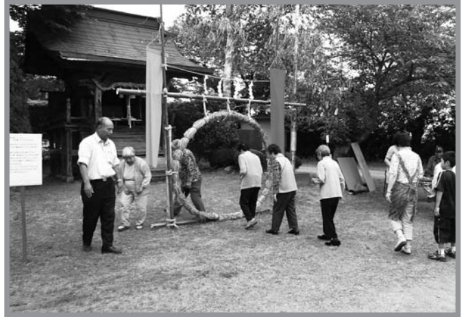
▲地域の伝統行事により健康を祈願しました

南方町沼崎地区の石上神社で6月30日、「夏越の祓 なごしはらい 」が行われました。お正月の初詣は良く知られていますが、夏越の祓は一年の真ん中に当たる6月30日に神社に参り、「茅の輪潜り ちわくぐり 」を行い、その年の半分が無事に過ごせたことへの感謝と、残り半分を無事に過ごせるように祈願するものです。当日は、沼崎区内の住民20人が集まり、人形 ひとがた に自分の名前と生年月日を書き、萱で作られた茅の輪を三回潜った後、神社に拝礼・奉納し、身体壮健で元気に過ごせるよう祈願しました。