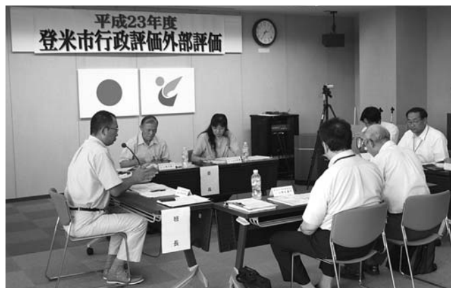
昨年の外部評価では、10人の行政評価委員会委員が2班に分かれ、3日間で50事業を評価しました。

外部評価の結果は、市の最終判断ではありませんが、結果を参考にして、予算編成や今後の事務の改善に向けて取り組んでいきます。