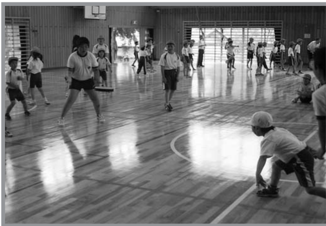
▲低学年から高学年まで、笑顔で元気に楽しんでいました