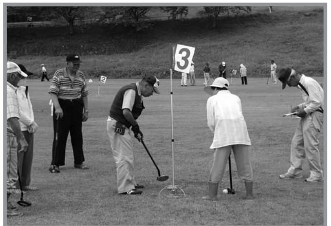
▲笑顔のプレーで交流を深めました

スポーツを通して、区民の親睦と融和を図ることを目的とした「北方地区コミュニティグラウンドゴルフ大会」が7月13日、長沼フットピア公園で開催されました。今年で4回目を迎えるこの大会は、各行政区代表の13チーム、90人が参加し、各チーム優勝目指して熱戦を繰り広げました。日頃の練習の成果を十分に発揮し好成績でプレーする人もいましたが、中には普段は外さない近距離から外し周囲からため息が漏れたりもしていました。会場は大いに盛り上がり、みんな笑顔で楽しそうにプレーしていました。