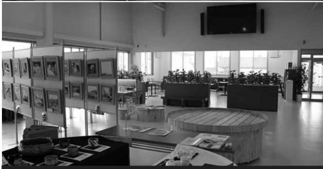
【上】登米市と南三陸町の物産が並ぶ広い販売ブース。壁には大漁旗が貼られています。