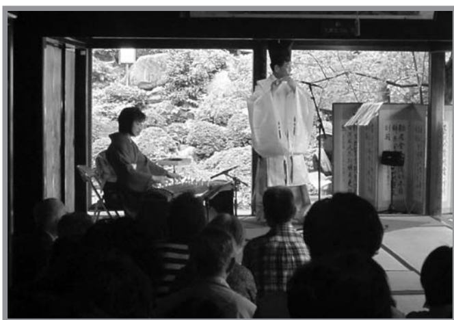
▲古代笛と箏の美しい音色が会場に響き渡りました