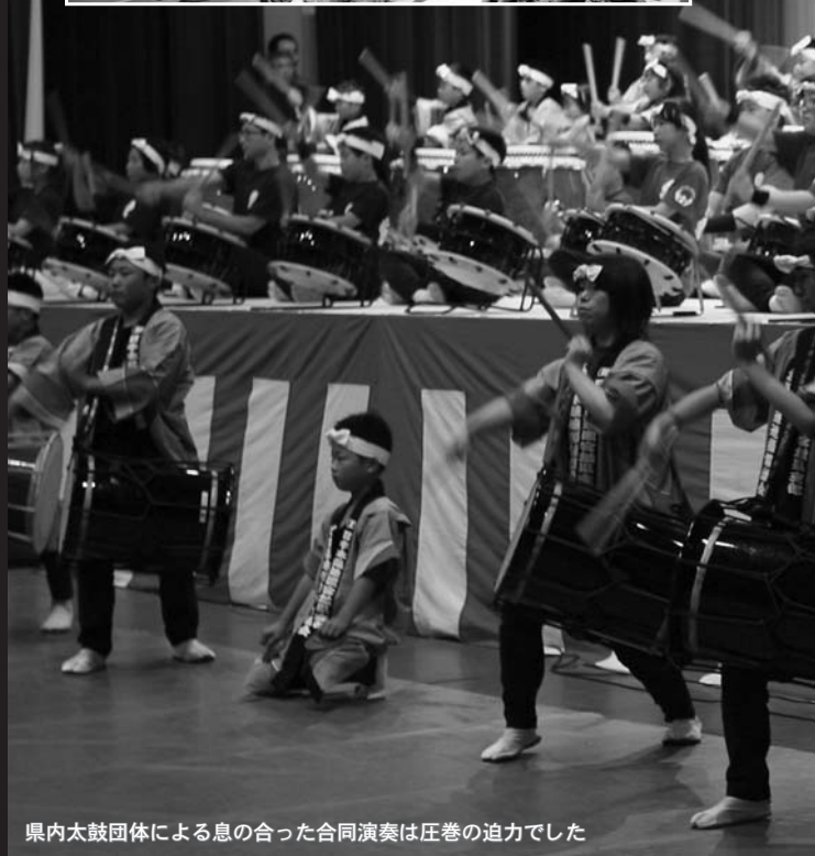
県内太鼓団体による息の合った合同演奏は圧巻の迫力でした