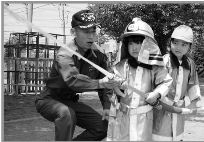
▲防火衣を着た園児たちが目標に向かって放水

登米保育所で7月4日、保育所と地域住民合同の避難訓練が行われました。訓練は、震度5の地震発生後、保育所厨房からの出火を想定。園児の年齢に合わせ避難方法を工夫し、地域の人と協力することで迅速に避難していました。訓練を指導した消防士からは「道路に人が飛び出さないよう注意する人、子供を安心させる人など、役割を意識し行動することが大事」との話があり、訓練の最後には園児たちが体験車両「けし丸くん」に乗車体験し、放水を行いました。