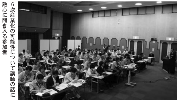
6次産業化の可能性について講師の話に熱心に聞き入る参加者

会場の中田農村環境改善センターには生産者や農業団体、企業関係者など約80人が参加。東北農政局や市の担当者が、6次産業化の動向や支援策などを紹介しました。平成23年には国において6次産業化法が施行されています。