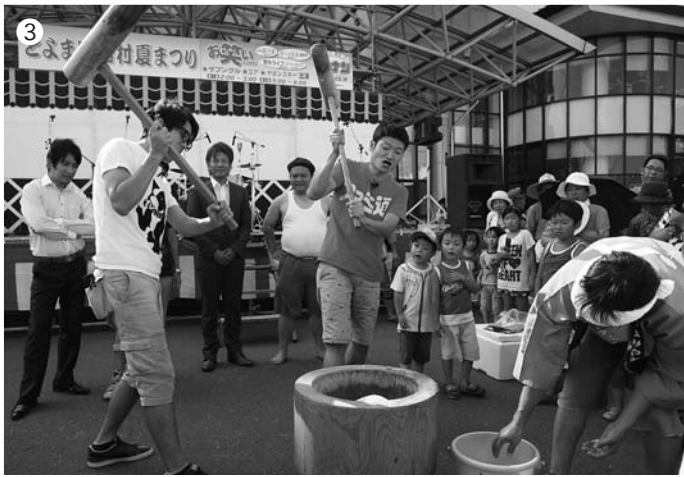
※写真は長沼はすまつり