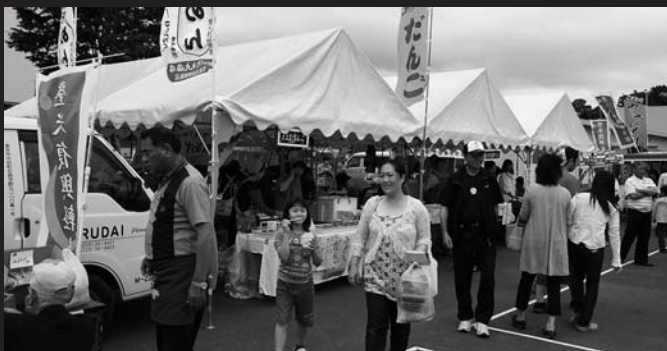
屋外では登米・南三陸物産市や軽トラ市 も開催、大勢の人でにぎわいました