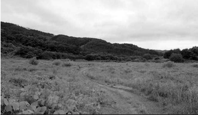
【上】市役所で行われた調印式には多くの報道関係者が詰めかけました 【下】整備する敷地の面積は東京ドーム5個分に相当します