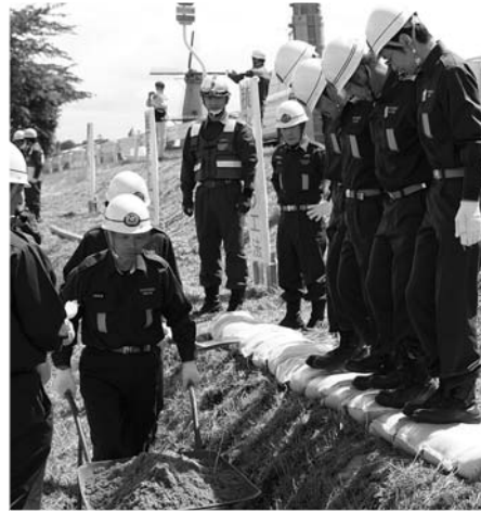
堤防からの越水を防ぐ積み土のう工法

6月24日、長沼フットピア公園で市水防訓練が実施されました。消防団の士気高揚と水防体