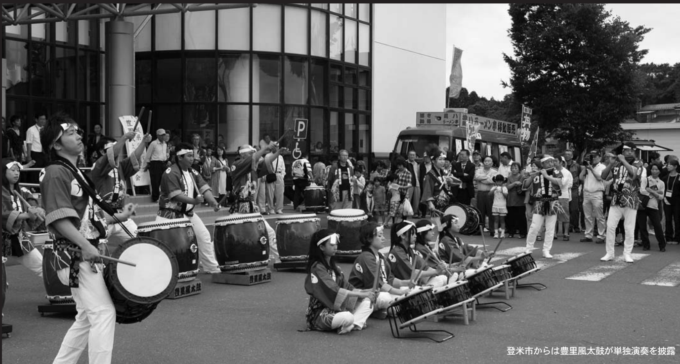
登米市からは豊里風太鼓が単独演奏を披露