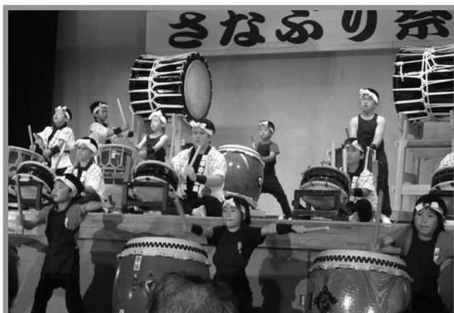
▲子供たちの力強い太鼓が披露されました

田の神を送り、田植えの終了を祝う、「平成24年度さなぶり祭り」が6月24日、中田農村環境改善センターで開催されました。この祭りは、中田文化協会が主催し、毎年開催されているものです。年を重ねるごとに素晴らしいステージが演出され、中田町内外から多くのファンが訪れる一大イベントとなっています。今年は、地元チームのよさこいがオープニングを飾り、舞踊、民謡、神楽などの演目や、子供たちの力強い太鼓が披露され、会場に集まった約300人の観客からは、大きな拍手が送られました。