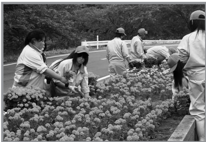
▲自分たちで育てた苗を一株一株丁寧に植えていました

平筒沼ふれあい公園で6月22日、23日の2日間、米山高校農業クラブとJAみやぎ登米米山町青年部・女性部による花の植栽が行われました。自分たちで育てた約1,500株のマリーゴールドを植栽した後、遊歩道周辺のゴミ拾いを実施。米山高校では、この植栽をボランティア活動の一環として毎年行っており、他にも米山地区の駐在所や道の駅などに植栽をしています。参加した生徒は、自分たちが大切に育てた花で公園がきれいになって、「大勢の人に見てもらいたい」と話していました。