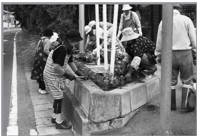
▲配付された花苗を道路脇に植える皆さん