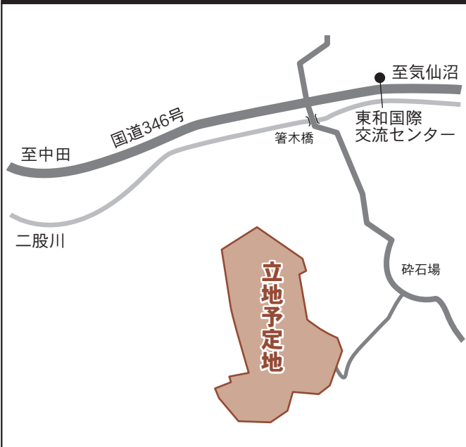
メガソーラー立地位置図