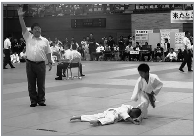
▲強豪チームが集い、熱戦が繰り広げられました