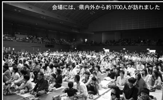
会場には、県内外から約1700人が訪れました

来場者は当初千人程度を見込 んでいましたが、当日は天気にも 恵まれ、また物産市とタイ アップした効果もあって、ここ らの予想を大幅に上回る約17 00人が集まりました。 出演団体は全て手弁当です。 太鼓の仲間の絆に改めて感謝し ています。