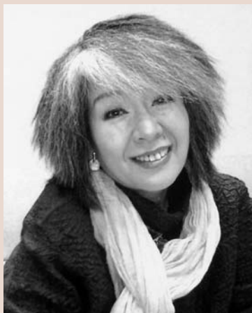
【講師】 落合 恵子さん

【プロフィール】 1945年栃木県生まれ。明治大学英米文学科卒業後、NHK文化放送に入社。アナウンサーを経て作家活動に入る。家族の問題、社会的な問題、教育問題、環境問題などをわかりやすく考えられる「社会に共通な問題」にしていくことに努め、小説の形で表現し続けている。