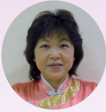
太極拳サークル南方 代表