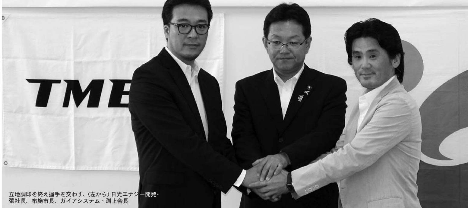
立地調印を終え握手を交わす、(左から)日光エナジー開発・張社長、布施市長、ガイアシステム・洲上会長