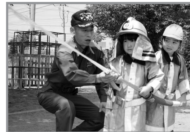
▲防火衣を着た園児たちが目標に向かって放水

登米保育所で7月4日、保育所と地域住民合同の避難訓練が行われました。訓練は、震度5の地震発生後、保育所厨房からの出火を想定。園児の年齢に合わせて避難方法を工夫し、地域の人と協力することで迅速に避難していました。訓練を指導した消防士からは「道路に人が飛び出さないよう注意する人、子供を安心させる人など、役割を意識し行動することが大事」との話があり、訓練の最後には園児たちが体験車両「けし丸くん」に乗車体験し、放水を行いました。