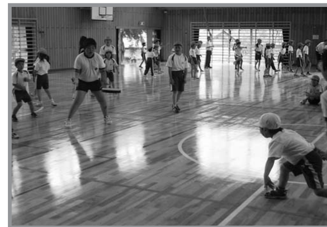
▲低学年から高学年まで、笑顔で元気に楽しんでいました

横山小学校で6月29日、スポーツ大会が開催されました。この大会は児童会活動の一つとして毎年開催されているもの。児童会が中心となり、自分たちで種目を決めたり、役割を分担しながら、大会の進行から表彰まで全て子供たちが行いました。今年は柔らかいフリスビーを使ったドッジビーを行い、全学年を縦割り4班に分け、対戦しました。5、6年生の男子は利き手を使わずに投げるハンデをつけるなど、全学年が楽しめるように工夫がされており、1年生から6年生まで、仲良くスポーツを楽しみました。