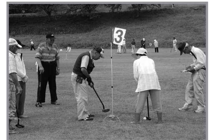
▲笑顔のプレーで交流を深めました

スポーツを通して、区民の親睦と融和を図ることを目的とした「北方地区コミュニティグラウンドゴルフ大会」が7月13日、長沼フットピア公園で開催されました。今年で4回目を迎えるこの大会は、各行政区代表の13チーム、90人が参加し、各チーム優勝目指して熱戦を繰り広げました。日頃の練習の成果を十分に発揮し好成績でプレーする人もいましたが、中には普段は外さない近距離から外し周囲からため息が漏れたりもしていました。会場は大いに盛り上がり、みんな笑顔で楽しそうにプレーしていました。