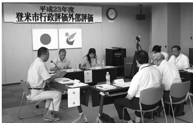
昨年の外部評価では、10人の行政評価委員会委員が2班に分かれ、3日間で50事業を評価しました。

外部評価の結果は、市の最終判断ではありませんが、結果を参考にし、予算編成や今後の事務の改善に向けて取り組んでいきます。