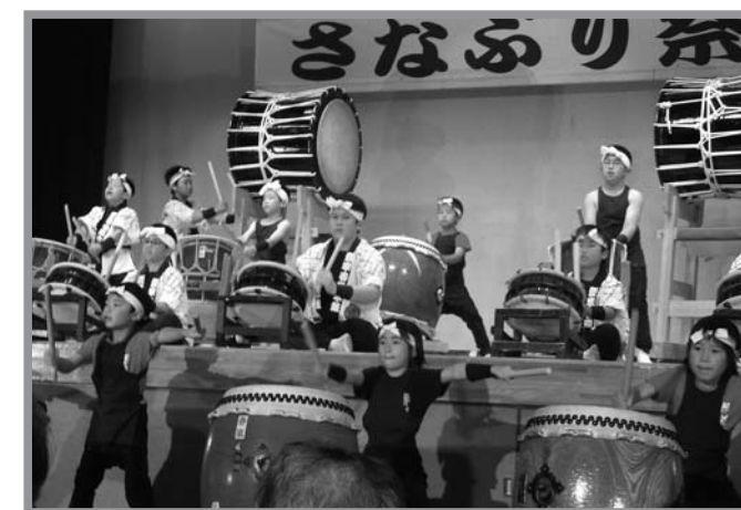
▲子供たちの力強い太鼓が披露されました

田の神を送り、田植えの終了を祝う、「平成24年度さなぶり祭り」が6月24日、中田農村環境改善センターで開催されました。この祭りは、中田文化協会が主催し、毎年開催されているものです。年を重ねるごとに素晴らしいステージが演出され、中田町内外から多くのファンが訪れる一大イベントとなっています。今年は、地元チームのよさこいがオープニングを飾り、舞踊、民謡、神楽などの演目や、子供たちの力強い太鼓が披露され、会場に集まった約300人の観客からは、大きな拍手が送られました。