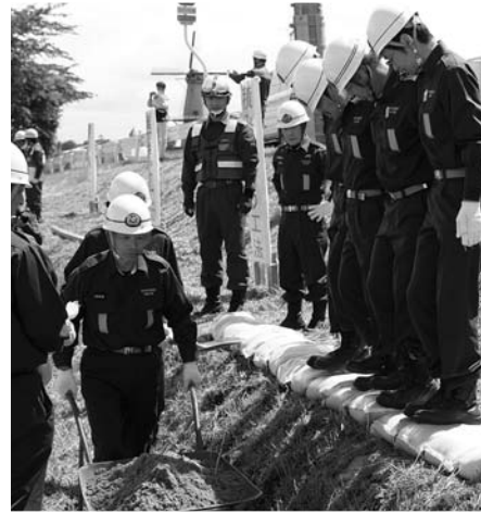
堤防からの越水を防ぐ積み土のう工法

6月24日、長沼フットピア公園で市水防訓練が実施されました。消防団の士気高揚と水防体