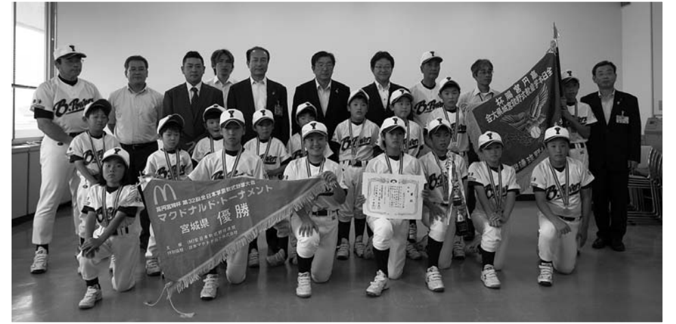
県優勝旗を手に市役所を訪問した柳津ビックパワーズナイン

県内310チームが参加した高岡宮賜杯第32回全日本学童軟式野球大会宮城県予選会で、柳津ビックパワーズ（津山・柳津小）が優勝し、全国大会の切符を手に入れました。同大会で優勝したのは一昨年に続いて2度目となります。7月3日に選手16人と監督、保護者などが市役所を訪れ、