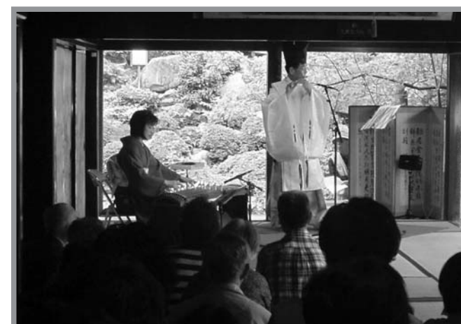
▲古代笛と箏の美しい音色が会場に響き渡りました