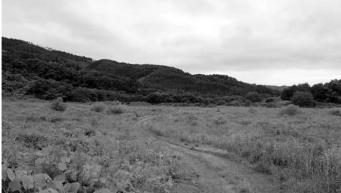
【上】市役所で行われた調印式には多くの報道関係者が詰めかけました 【下】整備する敷地の面積は東京ドーム5個分に相当します