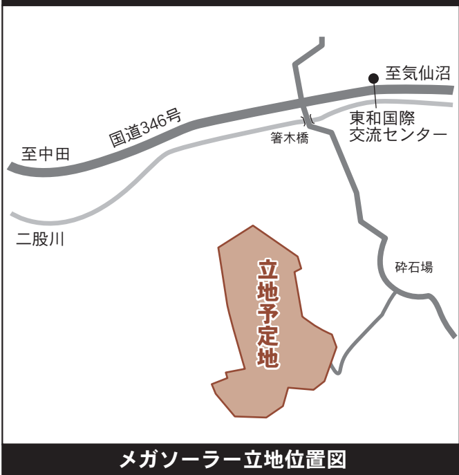
メガソーラー立地位置図