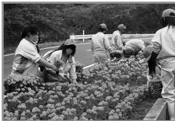
▲自分たちで育てた苗を一株一株丁寧に植えていました

平筒沼ふれあい公園で6月22日、23日の2日間、米山高校農業クラブとJAみやぎ登米米山町青年部・女性部による花の植栽が行われました。自分たちで育てた約1,500株のマリーゴールドを植栽した後、遊歩道周辺のゴミ拾いを実施。米山高校では、この植栽をボランティア活動の一環として毎年行っており、他にも米山地区の駐在所や道の駅などに植栽をしています。参加した生徒は、自分たちが大切に育てた花で公園がきれいになって、「大勢の人に見てもらいたい」と話していました。