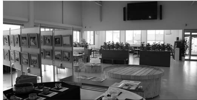
【上】登米市と南三陸町の物産が並ぶ広い販売ブース。壁には大漁旗が貼られています。 【下】大型テレビや展示ブースなどを備えたイベント・交流スペース