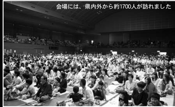
会場には、県内外から約1700人が訪れました