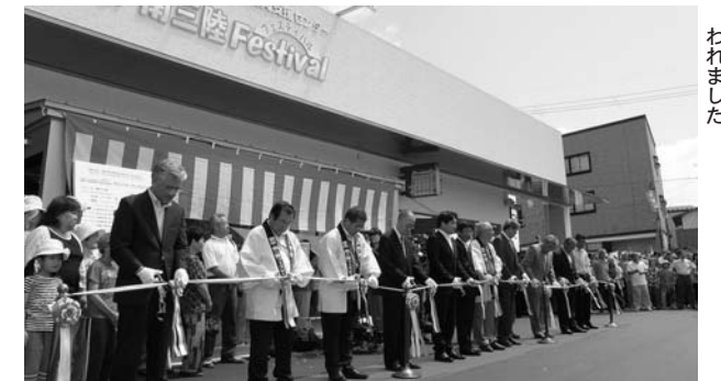
▲式典では、関係者にテープカットが行われました。

登米市と南三陸町の物産販売、交流の拠点施設として迫町西佐沼の大通り商店街に建設が進められていた「登米・南三陸Festival (フェスティバル)」が完成し、7月8日にオープニングセレモニーが行われました。