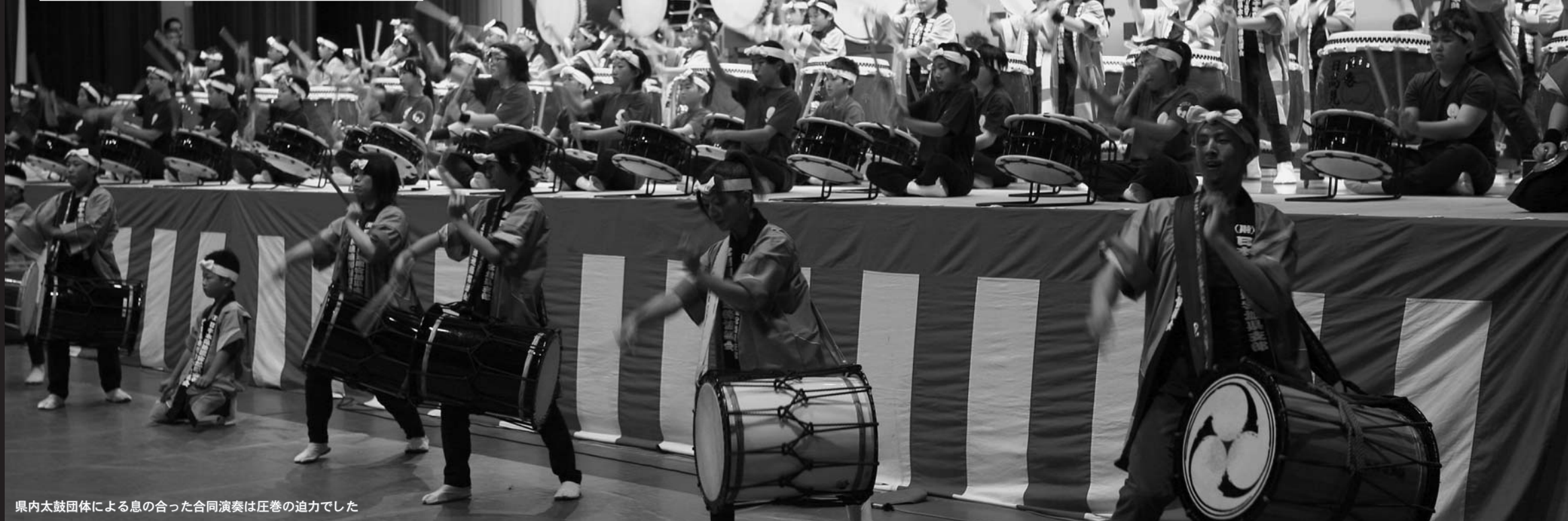
県内太鼓団体による息の合った合同演奏は圧巻の迫力でした