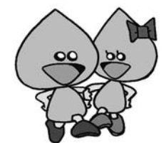
ジョーくん スイちゃん

② 小中学生 ③ 小学生 ④ 小学生 【題材】 ①②③については水道に関するもの ※③は標語を使用しないもの、④は3年生まで「みず」、4年生以上「水道週間」