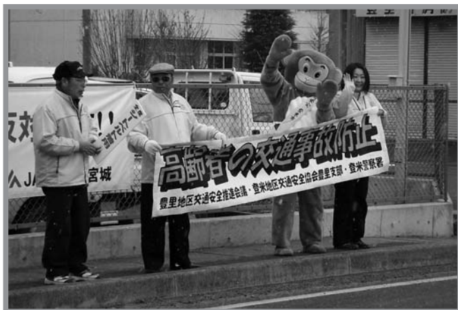
▲街頭に立ち、「着ぐるみ作戦」で安全運転を呼び掛けました

春の交通安全運動初日の4月6日、JAみやぎ登米豊里支店前で交通安全運動出発式が行われ、登米地区交通安全協会豊里支部や交通安全母の会など関係者約67人が参加しました。出発式では「交通事故のない安全・安心なまちづくりを目指します」と宣言し、号令の後各自が街頭指導に出発しました。街頭指導では「安全運転をお願いします」と呼び掛けながら交通安全チラシ・ポケットティッシュ、母の会手作りの折り鶴短冊を信号待ちのドライバーに配布しました。