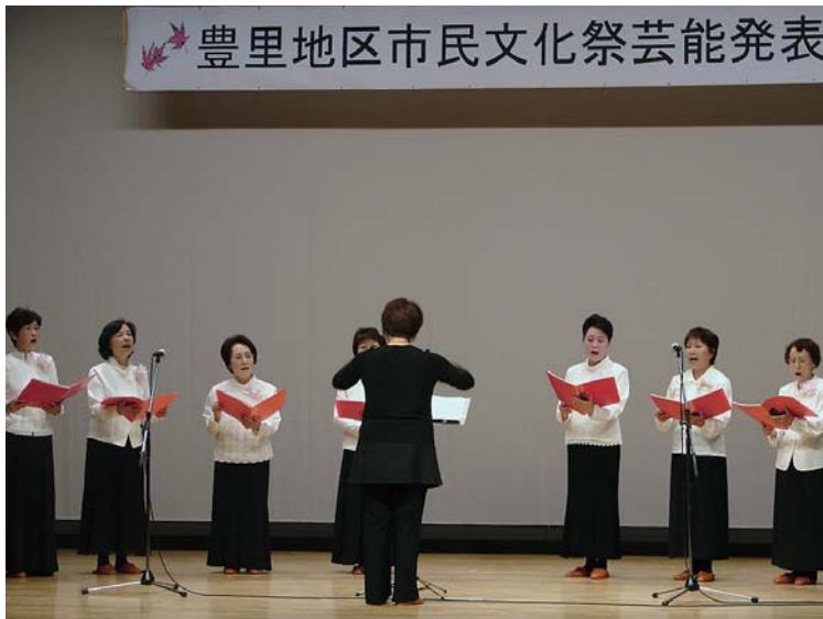
豊里地区市民文化祭芸能発表