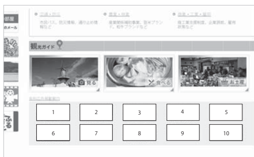
【図2】 ホームページ広告掲載イメージ