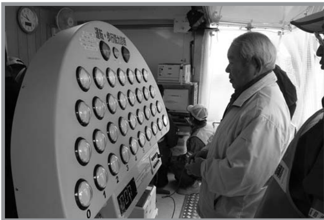
▲ゲーム感覚で楽しく運転適性診断を行いました

県道新田米山線の山成から高石行政区の一部区間が、4月に高齢者横断事故防止モデル地区に指定されたのを受け、4月9日に南方公民館で交通安全教室が開催されました。この教室はモデル地区内の高齢者を対象に行われ、楽しく運転適性診断を実施してもらおうと交通安全教育車(みやぎくん)の機材を使って反応速度や記録力、動体視力などを診断しました。参加者の中には、自分の診断結果に思わず苦笑いする人もいました。