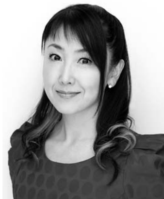
講師 あづま 東 ちづるさん

【プロフィール】 広島県出身。ドラマからコメンテーター、CM、講演、出版など幅広く活躍。現在、土曜ワイド劇場「温泉若おかみシリーズ」や「モーニングバード！」などに出演中。