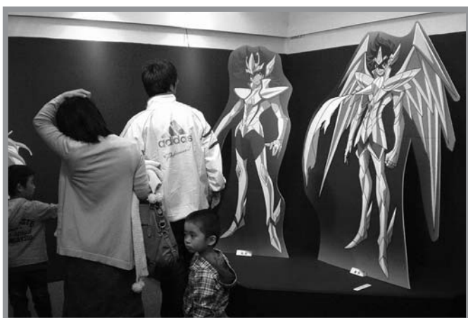
▲聖闘士たちの等身大パネルは、近くで見ると迫力があります