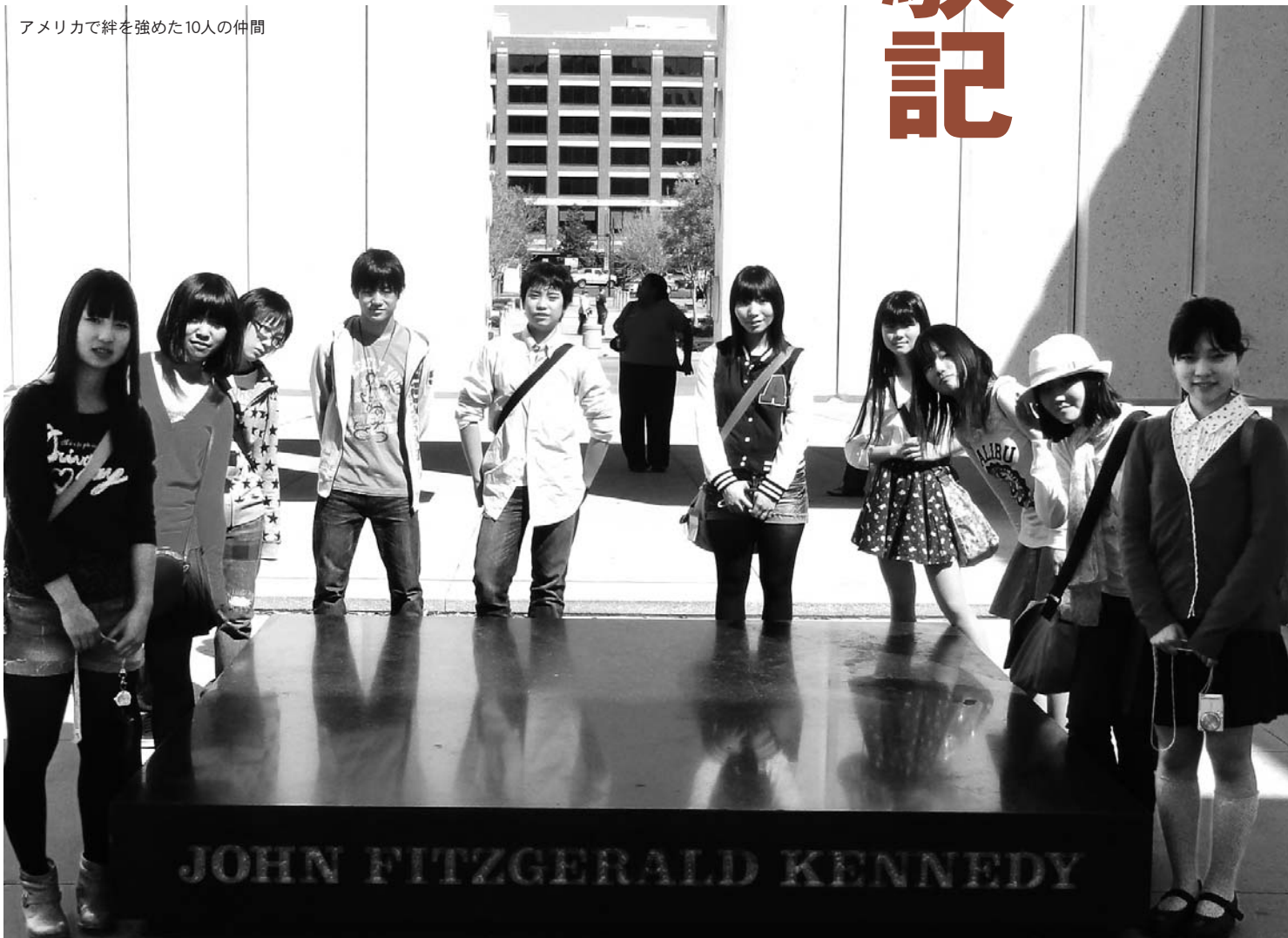
アメリカで絆を強めた10人の仲間

今回の研修を通して、自由でありながら相手を尊重するアメリカという国の素晴らしさを感じました。同時に、日本の治安がいかに良いかなど、海外に行かなければできないような、非常に多くのことを考えることができました。