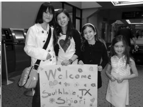
団員はアメリカへ入国後、サウスレイク市で4泊5日のホームステイを体験。ホストファミリーにも温かく迎えられた

※ 6 ページに平成24年度青少年海外派遣事業「ジュニア大使コース」派遣団員募集のお知らせを掲載