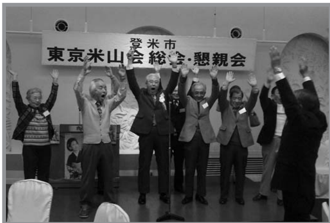
▲同郷の友と登米市の発展を願って万歳三唱をする会員の皆さん