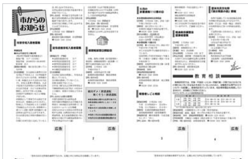
【図1】 広報とめ広告掲載イメージ