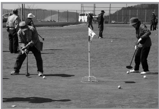
▲参加した選手は一打一打に集中し、熱戦が繰り広げられました