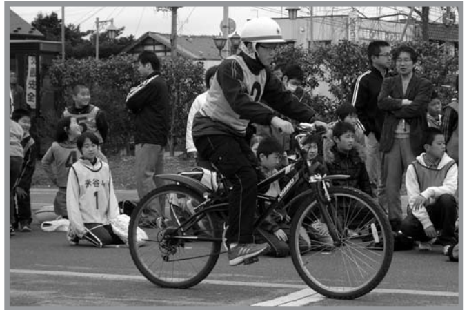
▲たくさんの児童が自転車の安全走行について学びました

登米警察署管内の小学生を対象に4月14日、自転車安全運転講習会が開催されました。これは交通安全について興味と関心を高めてもらい、自転車交通事故を防止するために毎年開催されているものです。登米教育資料館で交通ルールなどについてのテストを行った後、登米交通公園で自転車の実技講習を行いました。参加児童からは「交通安全リーダーとして下級生に交通安全の大切さを伝えたい」という声がかれ、交通安全への意識が高まりました。