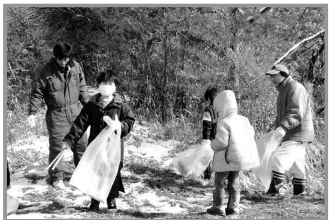
▲気温が低くてとても寒い中、一生懸命にゴミを拾う子どもたち

日ごろの活動場所や周辺環境への親しみを育み、自然環境に対する意識の向上を図ることを目的に、登米市スポーツ少年団迫支部クリーンキャンペーンが3月20日に開催され、団員と保護者、指導者など300人が迫地区内で清掃活動を行いました。参加した団員は、愛着のある日ごろの活動場所周辺の清掃活動を通して、ポイ捨ては良くないことだと再認識し、「思ったよりたくさんあった。みんなで気をつけてゴミを捨てないでほしい」といった感想が聞かれました。