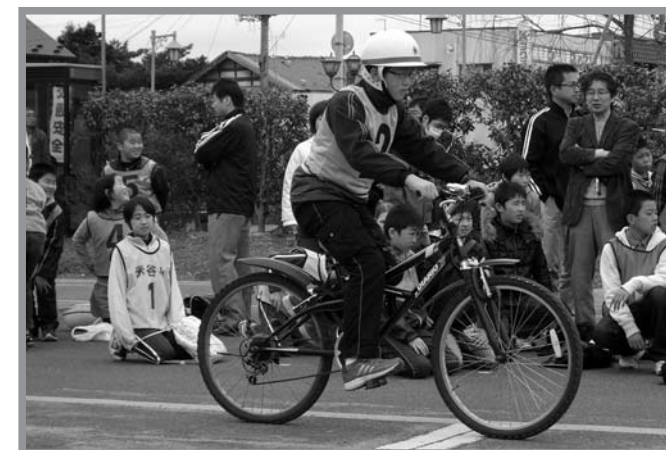
▲たくさんの児童が自転車の安全走行について学びました

登米警察署管内の小学生を対象に4月14日、自転車安全運転講習会が開催されました。これは交通安全について興味と関心を高めてもらい、自転車交通事故を防止するために毎年開催されているものです。登米教育資料館で交通ルールなどについてのテストを行った後、登米交通公園で自転車の実技講習を行いました。参加児童からは「交通安全リーダーとして下級生に交通安全の大切さを伝えたい」という声が聞かれ、交通安全への意識が高まりました。