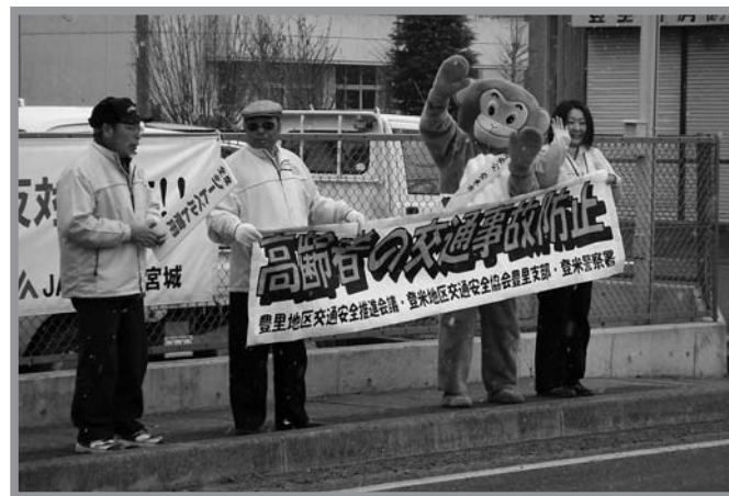
▲街頭に立ち、「着ぐるみ作戦」で安全運転を呼び掛けました

春の交通安全運動初日の4月6日、JAみやぎ登米豊里支店前で交通安全運動出発式が行われ、登米地区交通安全協会豊里支部や交通安全母の会など関係者約67人が参加しました。出発式では「交通事故のない安全・安心なまちづくりを目指します」と宣言し、号令の後各自が街頭指導に出発しました。街頭指導では「安全運転をお願いします」と呼び掛けながら交通安全チラシ・ポケットティッシュ、母の会手作りの折り鶴短冊を信号待ちのドライバーに配布しました。