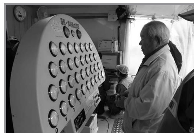
▲ゲーム感覚で楽しく運転適性診断を行いました

県道新田米山線の山成から高石行政区の一部区間が、4月に高齢者横断事故防止モデル地区に指定されたのを受け、4月9日に南方公民館で交通安全教室が開催されました。この教室はモデル地区内の高齢者を対象に行われ、楽しく運転適性診断を実施してもらおうと交通安全教育車（みやぎくん）の機材を使って反応速度や記録力、動体視力などを診断しました。参加者の中には、自分の診断結果に思わず苦笑いする人もいました。