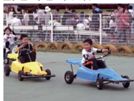
▲ファンシーサイクル