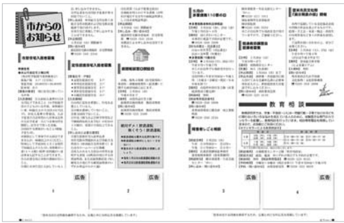
【図1】 広報とめ広告掲載イメージ