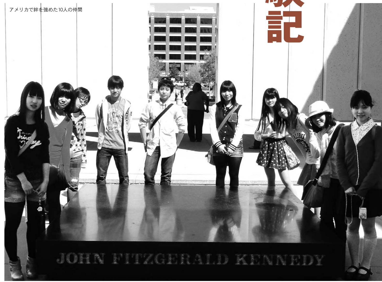
アメリカで絆を強めた10人の仲間

わたしは、以前からアメリカへ行くのが夢だったので、今回その夢が実現し、とても感謝しています。言葉が不自由な中で、現地の人と通じあえたときは、とても喜びを感じることができました。自分にも自信が付き、視野も広がりました。