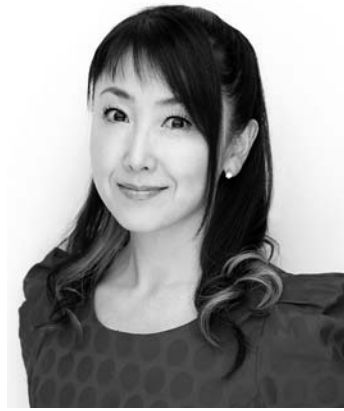
講師 東 ちづるさん

《日時》 5月26日(土) 午前9時45分～午後3時30分 《場所》登米祝祭劇場