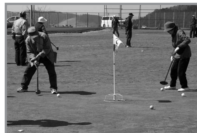
▲参加した選手は一打一打に集中し、熱戦が繰り広げられました