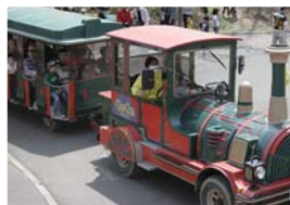
▲チューチュートレイン