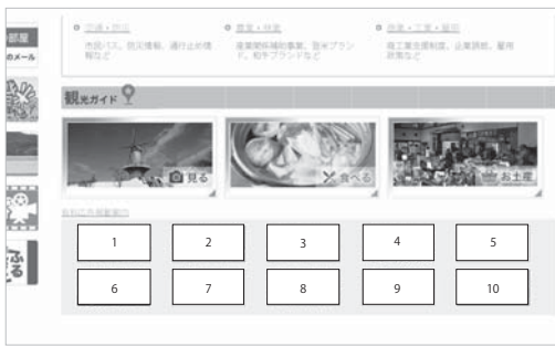
【図2】 ホームページ広告掲載イメージ