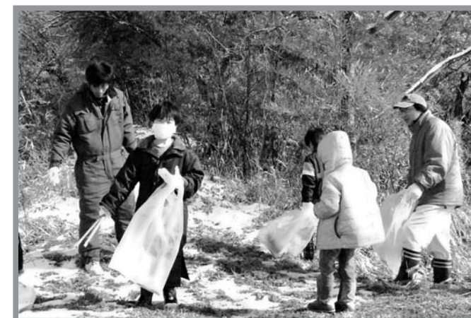
▲気温が低くてとても寒い中、一生懸命にゴミを拾う子どもたち

日ごろの活動場所や周辺環境への親しみを育み、自然環境に対する意識の向上を図ることを目的に、登米市スポーツ少年団迫支部クリーンキャンペーンが3月20日に開催され、団員と保護者、指導者など300人が迫地区内で清掃活動を行いました。参加した団員は、愛着のある日ごろの活動場所周辺の清掃活動を通して、ポイ捨ては良くないことだと再認識し、「思ったよりたくさんあった。みんなで気をつけてゴミを捨てないでほしい」といった感想が聞かれました。