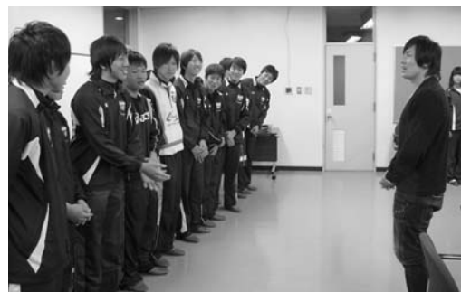
憧れの大畑選手と対面する佐沼高校ラグビー部員

講演では、決して順風満帆ではなかった選手時代や幾多の大けがや困難を克服した経験など、当時を振り返りながら自身のラグビー人生について語り、参加者は熱心に聞き入っていました。