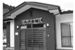
▲北沢町内会で整備した「北沢会館」