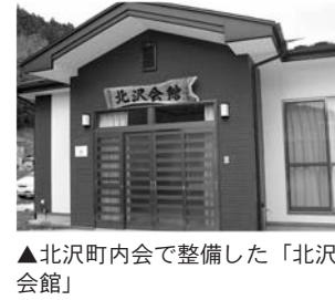
▲北沢町内会で整備した「北沢会館」