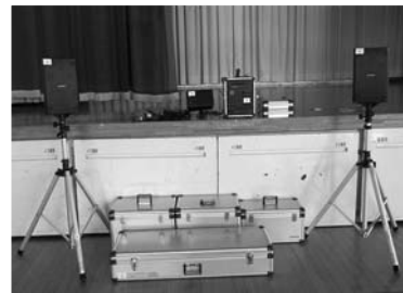
▲北方地区コミュニティ推進協議会で整備した音響システム

【問い合わせ】 企画部市民活動支援課 市民協働推進係 ☎ 0220 (22) 2173