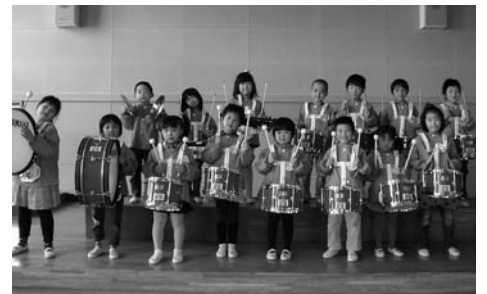
▲新しい鼓笛隊セットをうれしそうに手にする北方幼稚園幼年消防クラブの園児たち